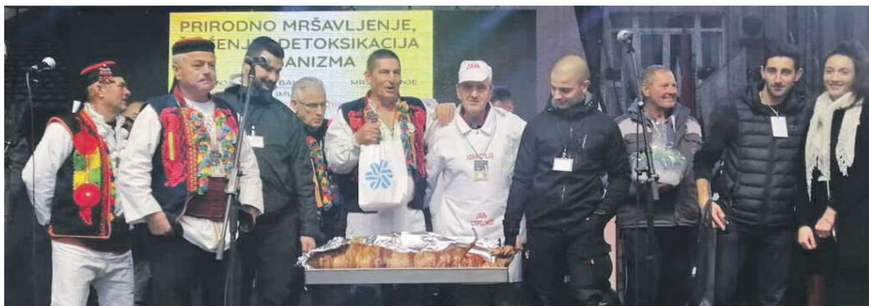
» Програм није могао проћи без Јањана