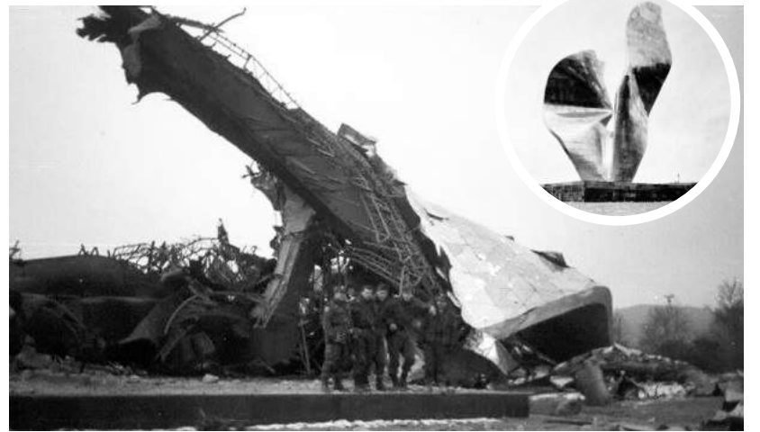
» ЗАДАТАК ЈЕ ОБАВЉЕН: Споменик срушен тек након деветог минирања

Међу споменицима до којих смо успјели да дођемо