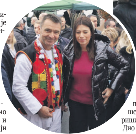
» Министарка Вујовић и градоначелник Вучевић обишли штанд ЗУ Јањана

ни. Изузетно је важно да бринемо о здравом храну и то је један од стубова зелене агенде којој је Србија јако посвећена. Ово је један од начина да се скрене пажња на здраву животну околинду. Такође, футошки купус је симбол квалитета и надам се да ће тај квалитет остати и бити још познатији у наредним годинама. Ово је бренд не само Футога већ читаве Србије и због тога ћемо се сви ми који смо на одговорним позицијама трудити да помогнемо овим добрим домаћинима.