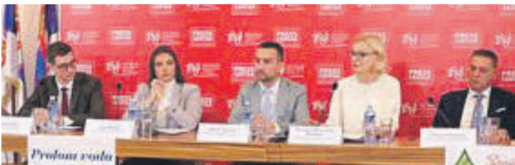
» Учесници Конференције СПОНА 2021

– Сам назив конференције СПОНА – медији и дијаспору говори о томе колико је важно сусретање, повезивање, размјена искустава и разговор о темама које су актуелне и значајне за Србе, како у региону, тако и за цијелу дијаспору. Покрајинска влада је Фонду за избјегла, расељена лица и за сарадњу са Србима у региону додијелила нове надлежности, тако да се од јануара ове године и званично бавимо сарадњом са Србима у региону. Чињеница да су Скупштина АП Војводине и Покрајинска влада прошириле надлежности Фонда, који постоји од 2006. године и који се бавио искључиво програмима од значаја за популацију избјеглих и расељених лица, говори о томе да