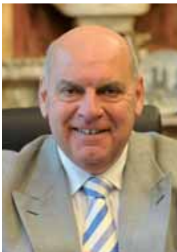
Daniël Termont Burgemeester Gent

Voor de Stad Gent en het OCMW blijft armoedebestrijding een permanent aandachtspunt en een absolute prioriteit. Want iederéén moet kunnen genieten van al het moois dat onze stad te bieden heeft!