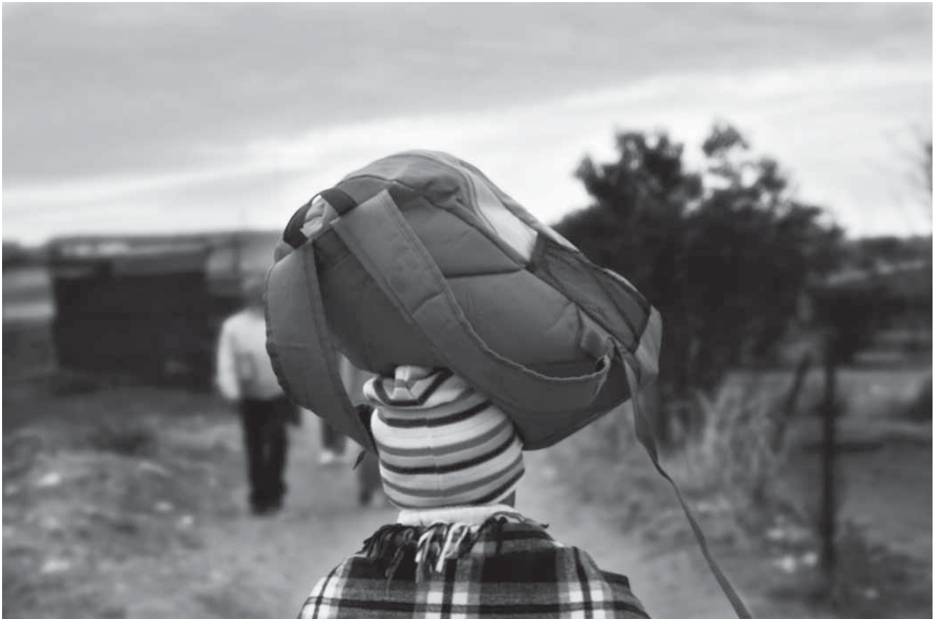
© Jonas Posman / Stad Gent en Narafi