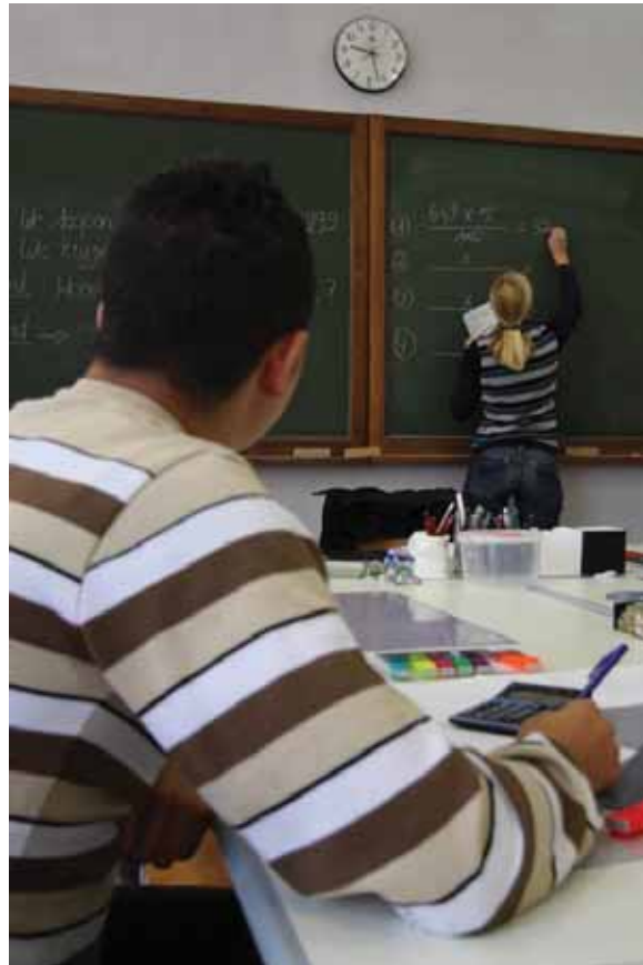
© Oliver Dowdle / Stad Gent