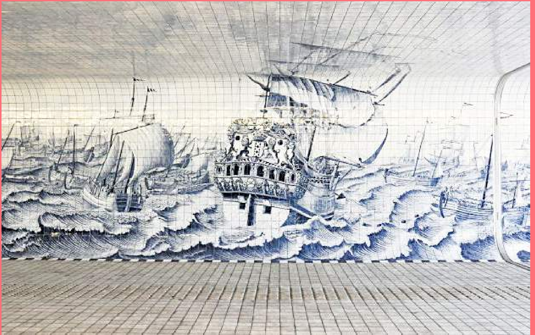
Irma Boom, Zeegezicht aan het IJ (2015), Westzijde CS