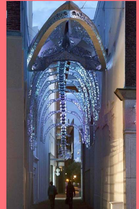
Steeg als eyecatcher; Passage de la Baleine (2015), oude Lombardsteeg, Leeuwarden, Giny Vos