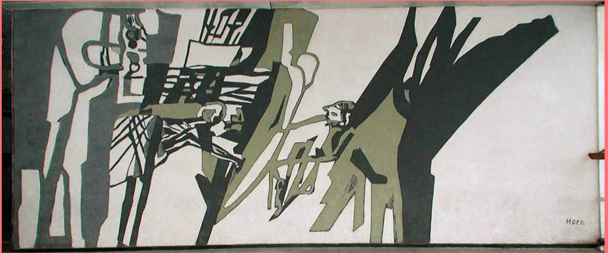
Lex Horn, Het Laboratoriumonderzoek (1965)