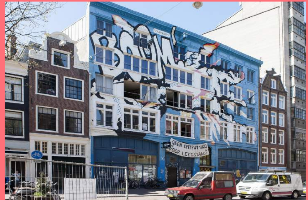
Graffitigevel Vrankrijk (2015) , Spuistraat

Tegenwoordig is 'het zetten' van grote pieces moeilijk in de binnenstad. Het komt voor dat een in de graffiti gemeenschap bekende buitenlandse schrijver een tag zet, maar deze wordt meestal weer snel verwijderd door Stadsreiniging of door de via de pandeigenaar ingehuurde reinigingsdienst. Het werk van Laser 3.14, aangebracht op het hout waarmee panden dichtgetimmerd zijn tijdens verbouwingen, blijft zolang de verbouwing duurt. Graffiti en street art is in het Amsterdam van nu vooral