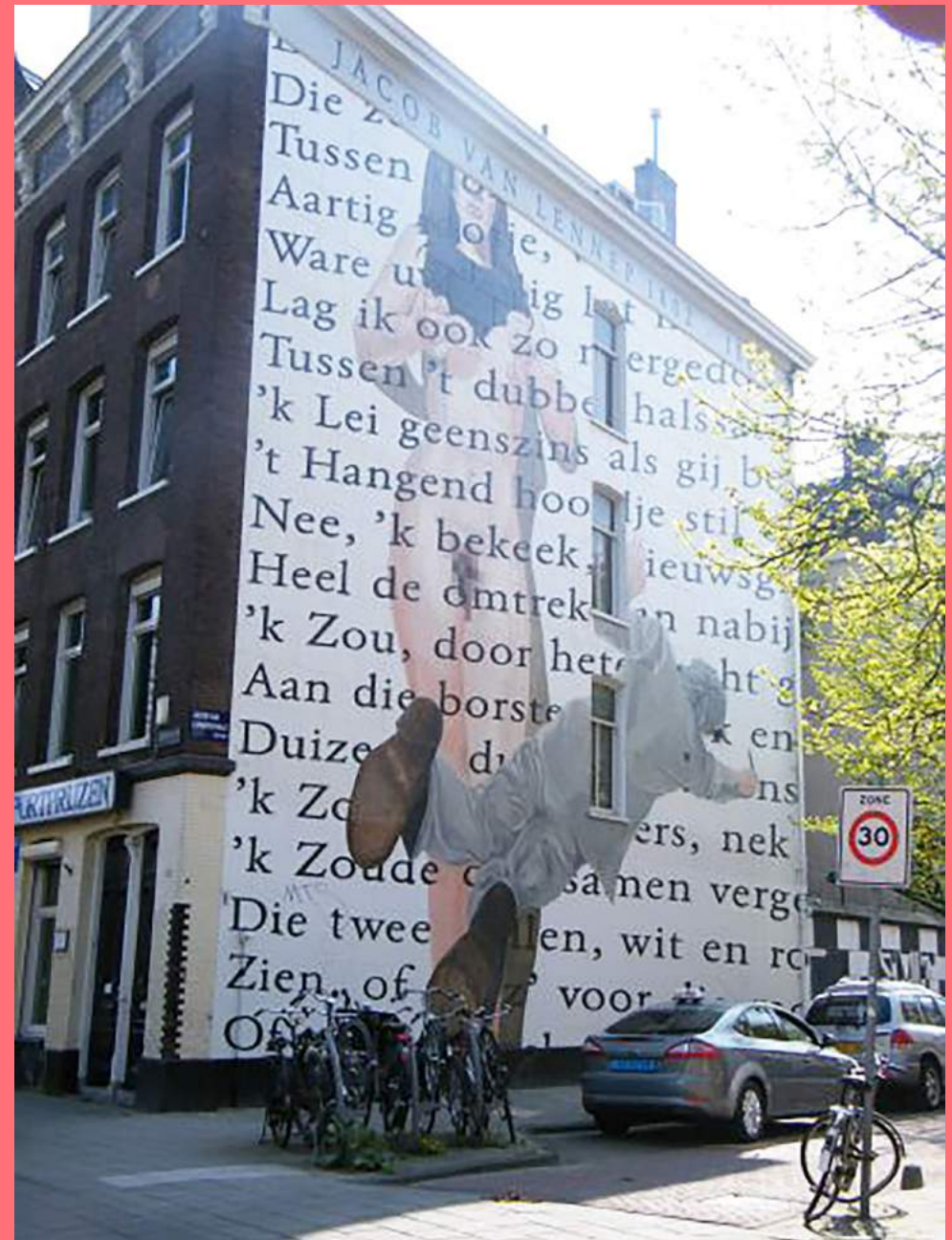
Rombout Oomen, Aan een Roosje (2004), Jacob van Lennepstraat

Andere vormen van muurschilderingen in de openbare ruimte zijn de reclameschilderingen uit de 19 de eeuw die weer opnieuw aangebracht worden. Ook worden tijdelijk commerciële muurschilderingen aangebracht, bijvoorbeeld Playstation in de Wibautstraat (juni 2021). Al eerder, in de jaren tachtig, namen ondernemers het initiatief voor muurschilderingen op de rolluiken voor winkels en andere openbare plekken. Berucht waren de reclames voor de coffeeshops van The Happy Family. Een recent voorbeeld is de trompe l'oeil met het stadswapen in de Trompettersteeg van graffiti kunstenaar Dopie. Het was een initiatief