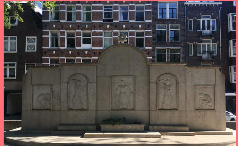
Johan Gustaaf, Monument van Joodse Erkentelijkheid (1950), Weesperplein