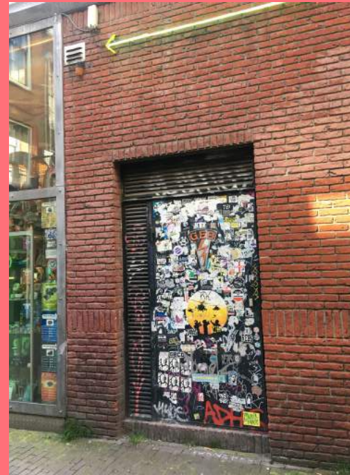
Bestickerde deur (2021), Sint Annenkwartier