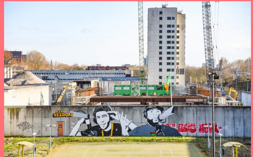
Kamp Seedorf, MocoManiac en Rotjoch (2020), voormalige Bijlmerbajes