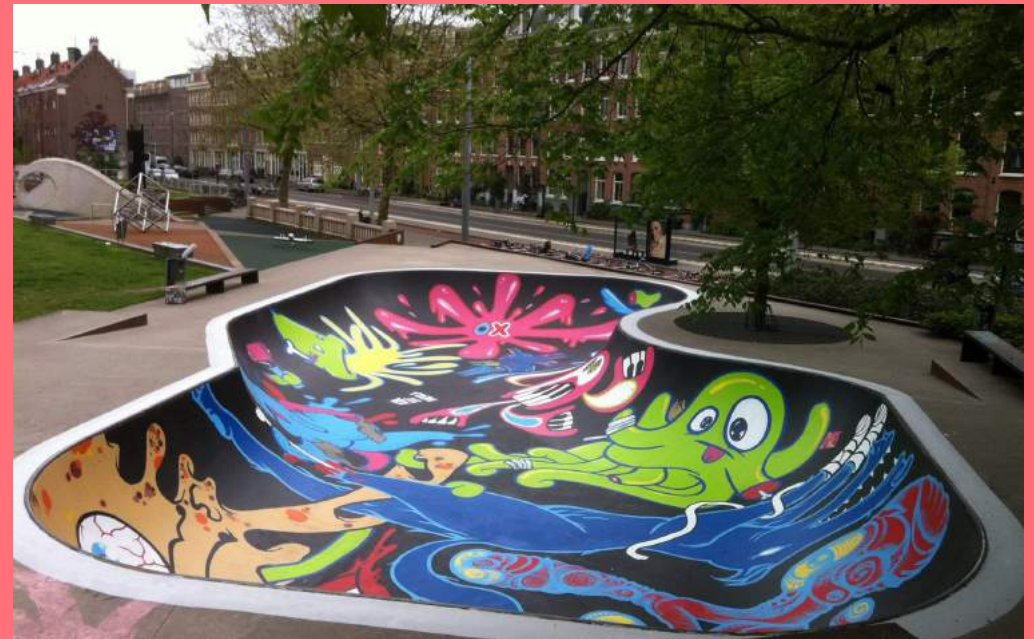
Graffiti, skatepark Marnixstraat