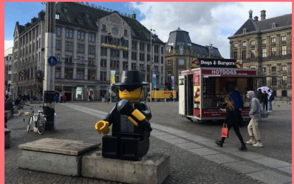
Street Art Frankey, legobeeld André Hazes (2021, tweede versie), de Dam