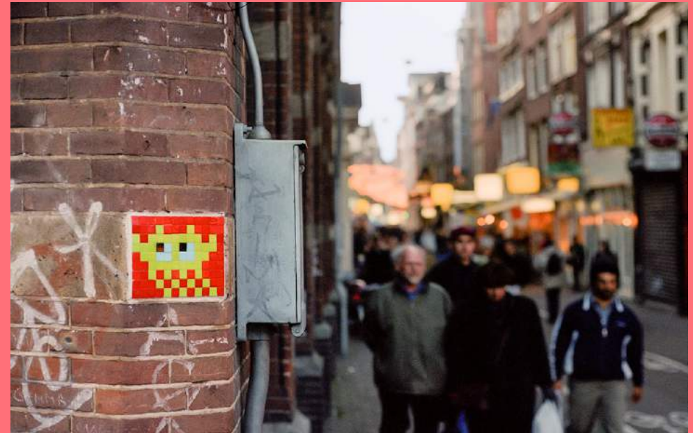
Space Invaders (1999), mozaïek

Graffiti kan variëren van een snel geplaatste tag (handtekening) tot een complexe grafische compositie van letters (piece). Murals zijn grote muurschilderingen, die op dit moment grote populariteit genieten. In Zuid-Amerika hadden murals een politieke lading en waren deze schilderijen een inspiratiebron voor Amerikaanse graffiti-schrijvers in de jaren '70 en '80. Door kunstenaars als Banksy werden murals gemaakt met sjablonen (stencils) populair. In navolging van New York en Berlijn zijn er in Amsterdam ook steeds meer murals te vinden. De laatste