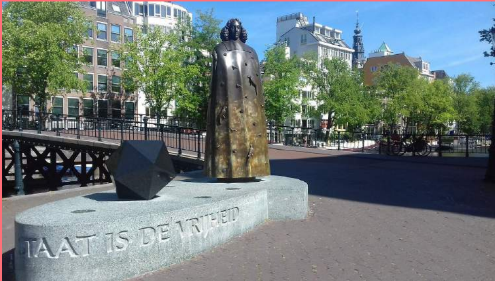
Nicolas Dings, Spinoza Monument (2008), Amstel 1