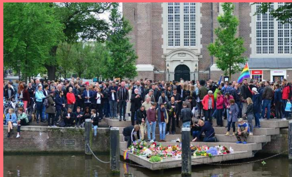
Herdenkingsbijeenkomst slachtoffers Orlando bij Homomonument in 2016 (monument ontworpen door Karin Daan, in 1987)