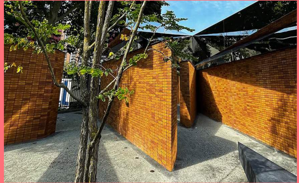
Daniel Libeskind, Nationaal Holocaust Namenmonument (2021), Weesperstraat