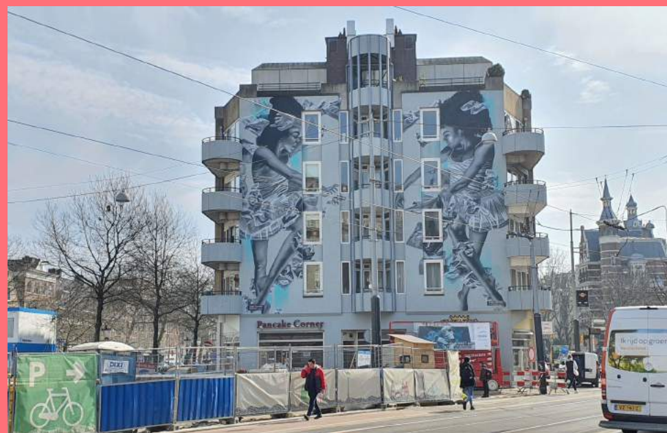
Judith de Leeuw, Diversity in Bureaucracy (2021), Kleine-Gartmanplantsoen