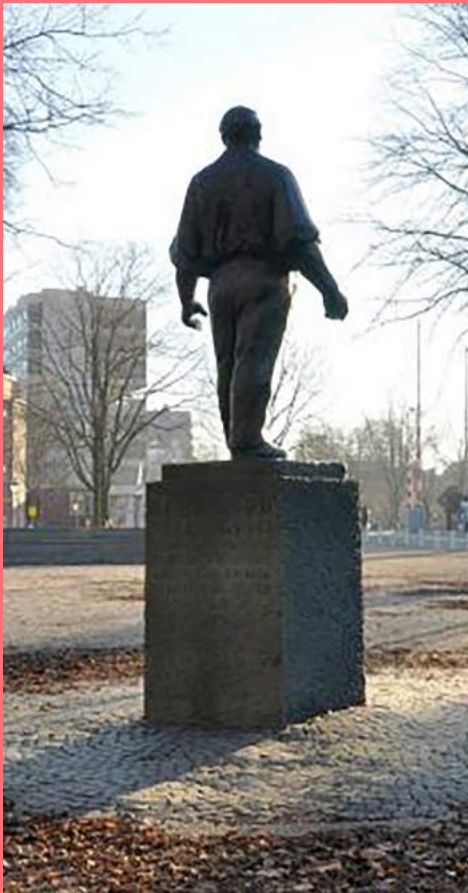
Mari Andriessen, De Dokwerker (1952), Jonas Daniël Meijerplein