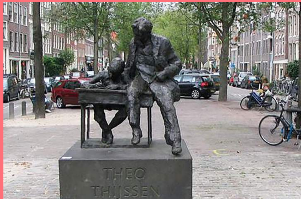
Hans Bayens, Theo Thijssen Standbeeld (1979), Brouwersgracht

Niet alle kunst in de openbare ruimte hoeft verhalend te zijn. Er zijn interessante kunstwerken, zoals bijvoorbeeld de fontein op het Rokin van