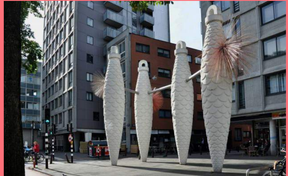
Hans van den Ban, Fete Galante (1994), Weesperstraat