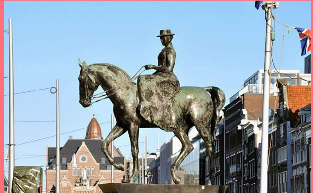
Theresia R. van der Pant, Ruitersstandbeeld Koningin Wilhelmina (1972), Rokin