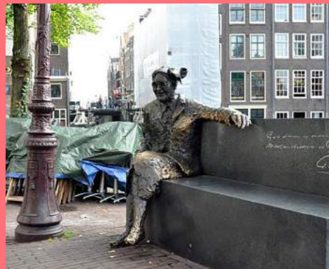
Peter Leeuwe, Majoor Bosshardt (2013), Majoor Bosshardtbrug