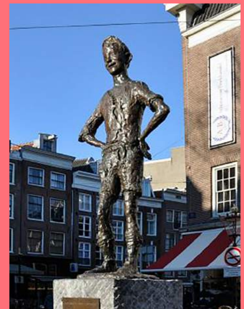
Voorbeelden van bloembakke, vuilnis en straatmeubilair bij kunstwerken in de binnenstad (2021)