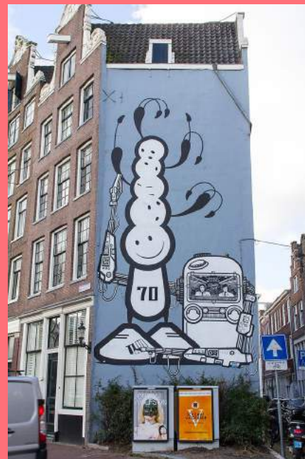
Mural, London Police (2009), Prinsengracht

De binnenstad heeft de afgelopen decennia stukje bij beetje zijn rauwe randjes verloren. Panden zijn opgeknapt, de stad is aantrekkelijker en ook duurder geworden (zowel om te bezoeken als om in te wonen), kraken is verboden en veel alternatieve plekken (kunstenaarsinitiatieven, subculturele plekken) zijn uit het centrum verdwenen. Binnen deze ontwikkelingen is het logisch dat ook voor ongevraagde street art steeds minder ruimte is in het centrum. De spanning tussen wat kunst is en wat vandalisme, is reëel en begrijpelijk. Toch pleit SCA voor meer ruimte voor ongevraagde street art, omdat ook deze vorm van creatieve expressie bij Amsterdam hoort. Het is wenselijk om juist in de binnenstad plekken aan te wijzen of te creëren, als (tijdelijke) gedoogplekken en meer te vertrouwen op het zelfreinigende vermogen van de street art scene: deze kunstvorm bestaat bij de gratie van de maker die beter wil worden. Deze vrije gedoogplekken creëren een organische humuslaag en een uitnodiging aan anderen om op door te werken. Dit zouden enkele specifieke stegen kunnen zijn (er was reeds een initiatief in de Pijlsteeg, vanuit stichting Amsterdam Street Art, die de plek zou cureren,