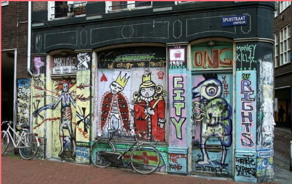
Graffiti op een gekraakt pand (2004), Spuistraat 217