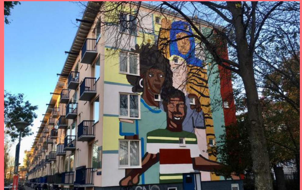
Iriée Zamblé, zonder titel (2020), Wiltzanghlaan