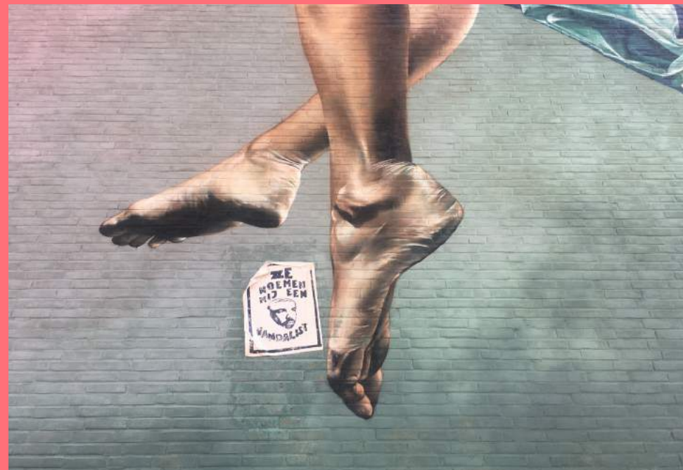
Detail van Mural Studio Giftig, Floating between freedom (2019) plus anonieme paste up (foto gemaakt in 2021), Platanenweg

In de collectie van het Amsterdam Museum zijn enkele iconische street art werken opgenomen, waaronder een deel van de door Hugo Kaagman beschilderde schutting die tijdens de bouw van de Stopera op het Waterlooplein stond, het portret van Theo van Gogh dat Donovan Spaanstra schilderde op een stuk hout in de Warmoesstraat en meer recent, een deel van de schutting bij de Tolhuistuin met door Hedy Tjin gemaakte portretten van slachtoffers van racistisch geweld in de VS (project van Verdedig Noord in samenwerking met United Painting).