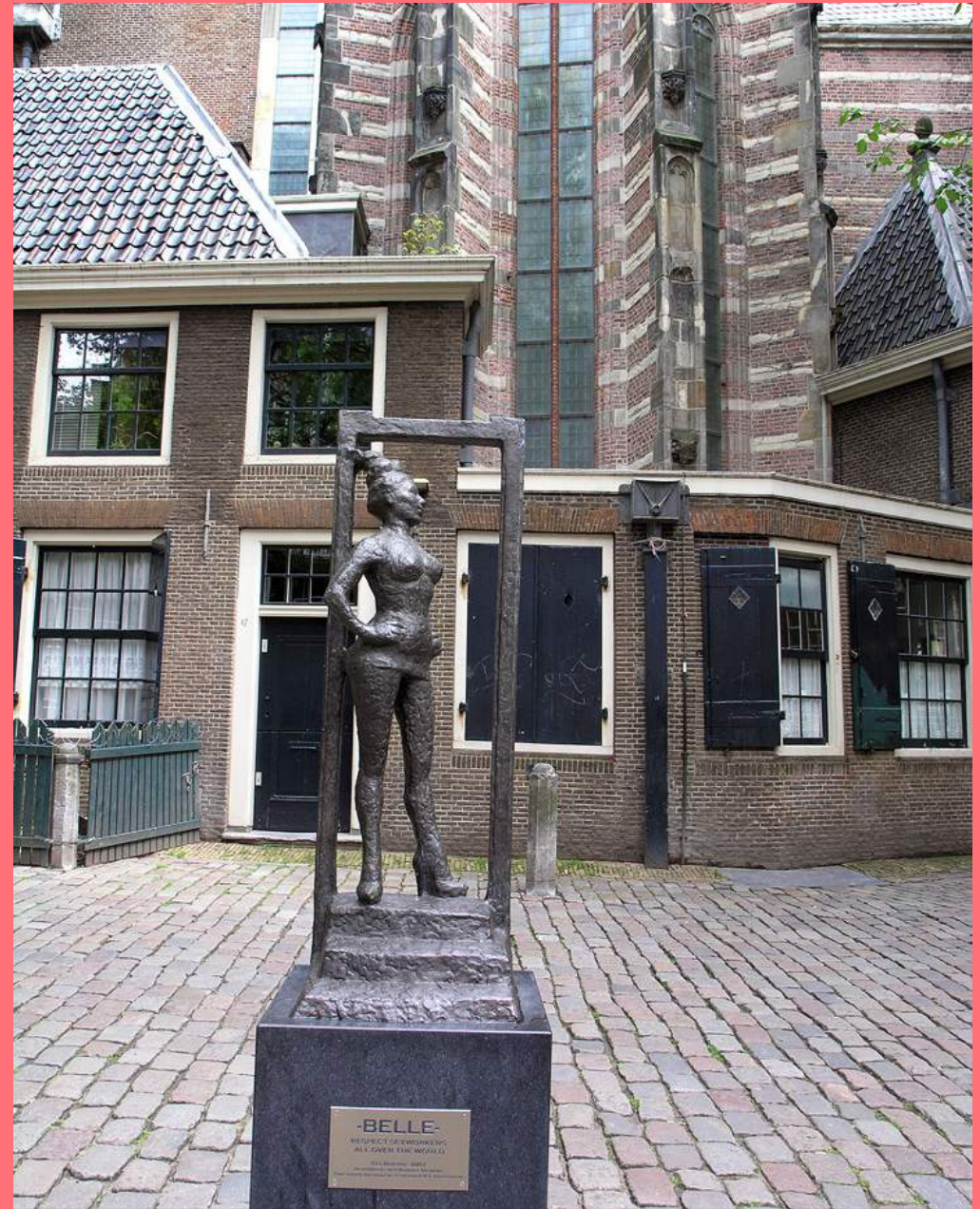
Els Rijerse, Standbeeld Belle (2007), Oudekerksplein