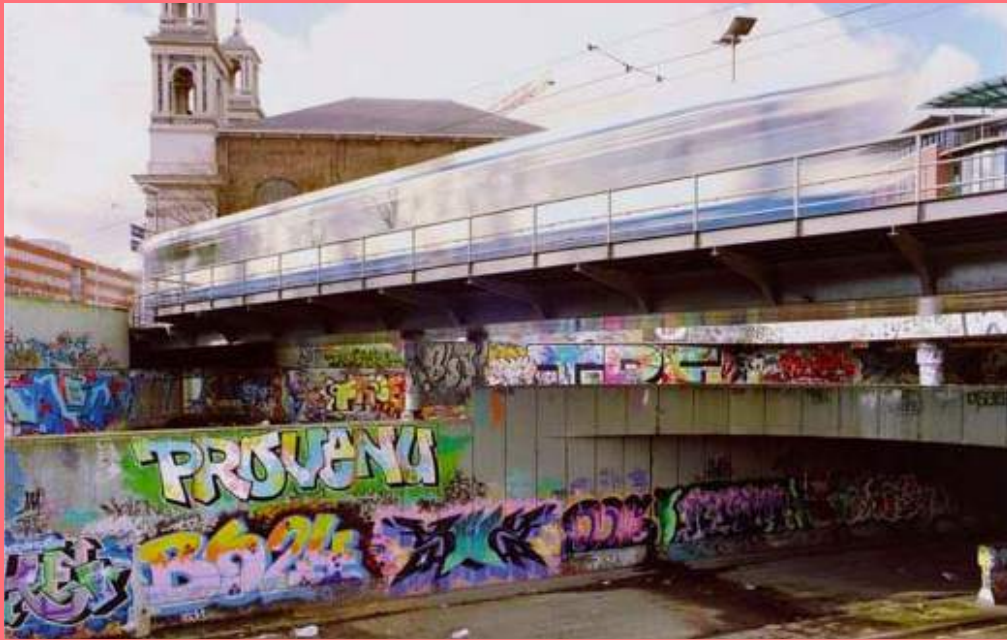
Graffiti, autotunnel Mr. Visserplein