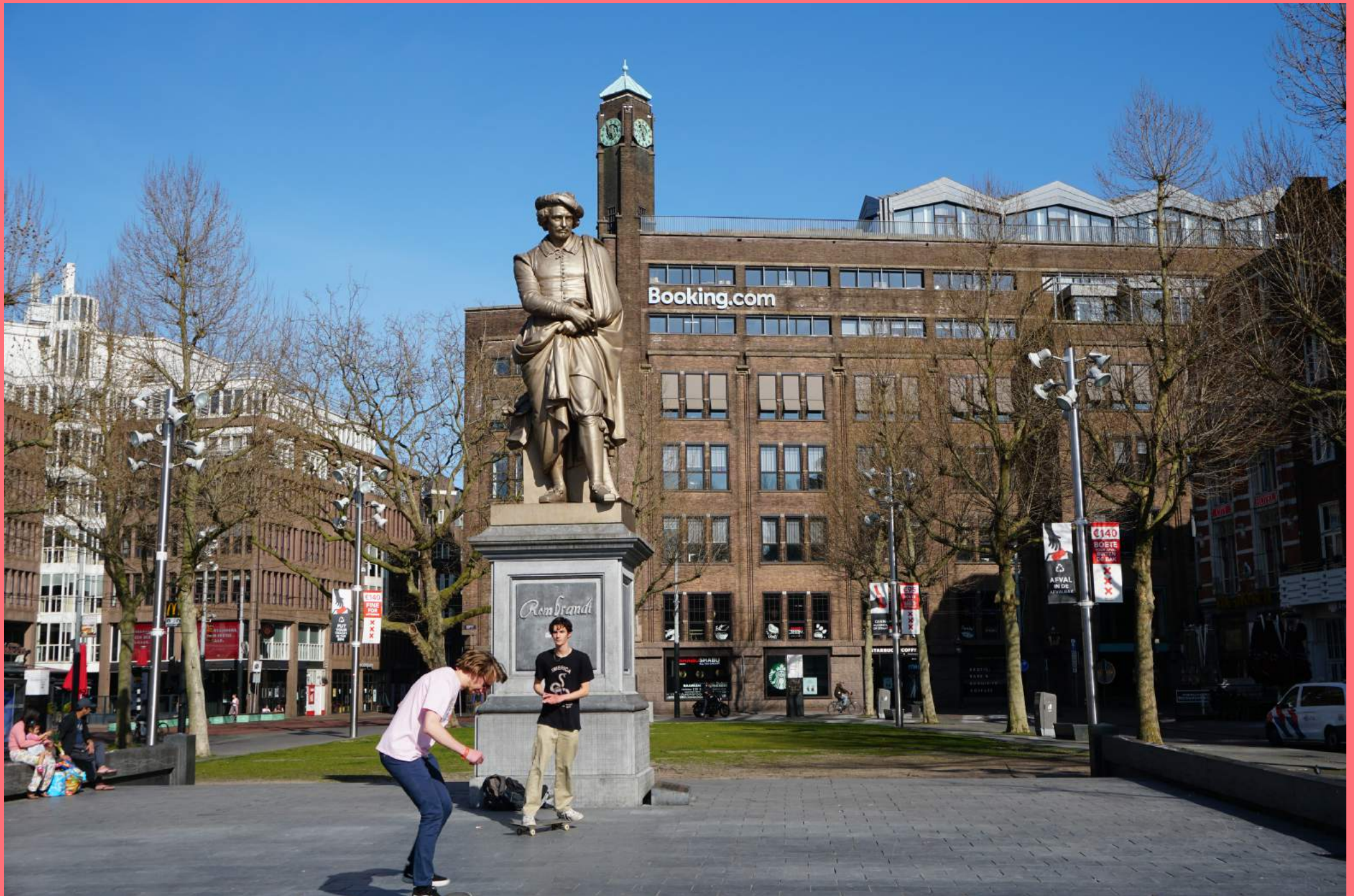
Louis Royer, Rembrandtmonument (1852), Rembrandtplein