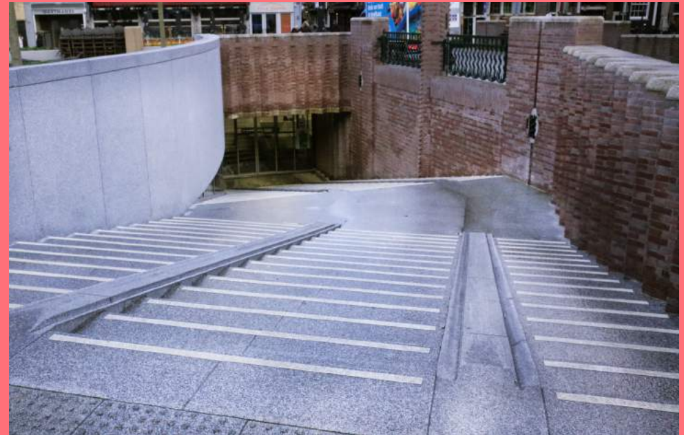
Entree fietsenstalling (2021), onder het Kleine-Gartmanplantsoen

Een groot deel van de binnenstad bevindt zich onder de beschermende en enigszins verstikkende koepel van Unesco Werelderfgoed. Hoe verhoudt zich dit tot de wens meer ruimte te bieden aan particulier initiatief - ook voor kunstwerken - zodat verschillende stemmen hoorbaar en zichtbaar worden, naast die van degenen die cultureel dominant zijn en die weten welke wegen ze moeten bewandelen om iets voor elkaar te krijgen. Zorgvuldig opdrachtbeleid aan kunstenaars en vormgevers is daarbij belangrijk. Particulier initiatief, in allerlei vormen (vanuit bewoners, kunstenaars, ondernemers), hoeft niet altijd te leiden tot grote, permanente ingrepen, maar kan - zeker in de beschermde binnenstad - ook bestaan uit tijdelijke interventies en meer performatieve presentaties. SCA pleit voor kunstwerken die bij de stad passen in die zin dat ze zich duidelijk onderscheiden. Kunstwerken die de stad 'branden', niet door groot, duur en glimmend te zijn, maar die zich onderscheiden door afwijking en experiment. Juist door laagdrempelig andere vormen van kunst in de openbare ruimte een plek te geven creëren we onverwachte aanwezigheid.