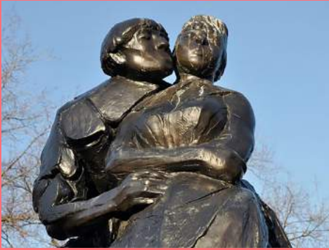
Piet Esser, Bredero-monument (1968), centrum