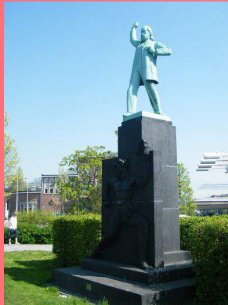
Johan Polet, Standbeeld Domela Nieuwenhuis (1931), Westerpark