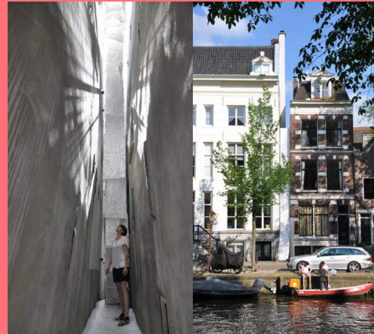
HOH Architecten / Jarrik Ouburg, Tussen-ruimte, tijdelijke interventie Herengracht (2013)