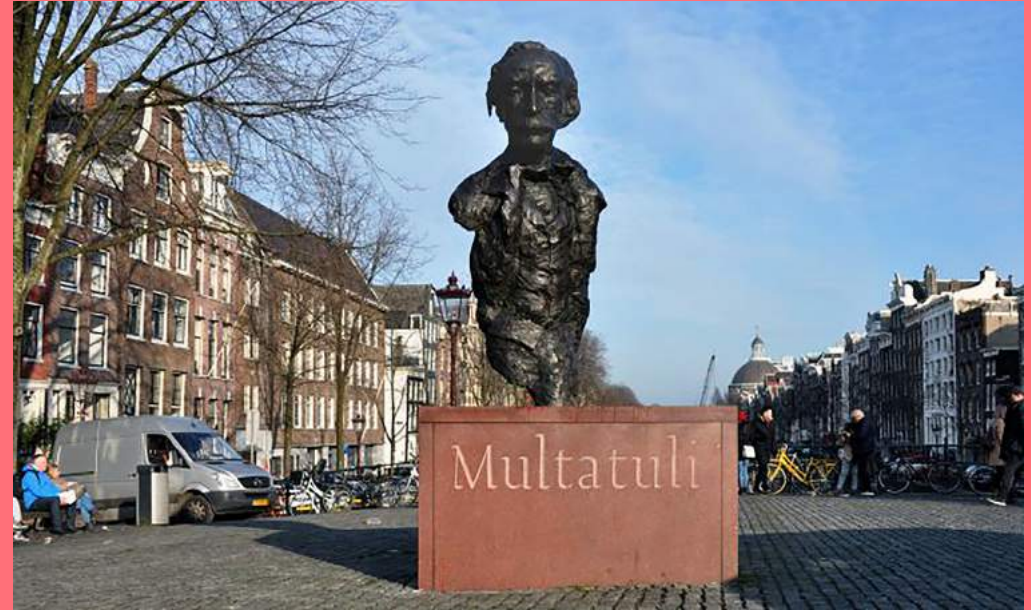
Hans Bayens, Multatuli (1987), Torensluit