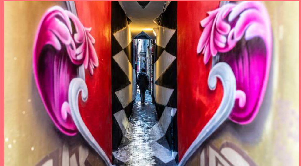
Dopie, Muurschildering (2021), Trompettersteeg