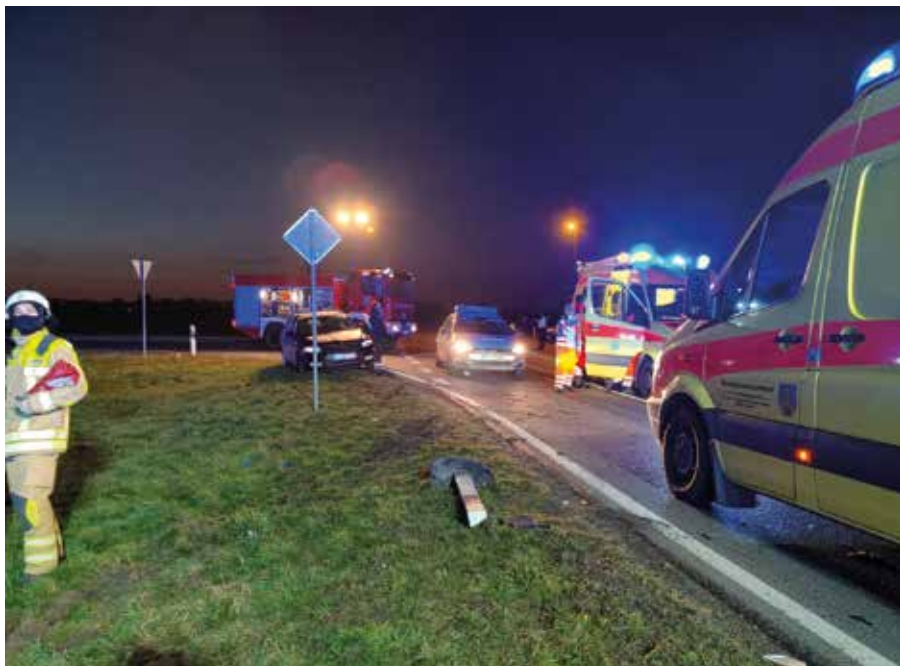
Im November mussten die Kameraden unter anderem wegen eines Verkehrsunfalls ausrücken.

Den größten Einsatz in diesem Jahr hatten wir am 5. Dezember zu absolvieren. In einem Einfamilienhaus befand sich das Erdgeschoss bei unserem Eintreffen bereits in Vollbrand. Zum Glück war das Haus mit Rauchmeldern ausgestattet, so dass der sich im Haus befindliche Bewohner selbst retten konnte, bevor wir da waren. Alle Brandiser Ortsfeuerwehren waren mit allen ihren Fahrzeugen und insgesamt 42 Einsatzkräften aktiv. Durch einen gezielten Innenangriff und Löscharbeiten von außen konnte die Flamme schnell gelöscht werden. Diese hatte sich jedoch bereits vorher in die Dachkonstruktion hineingefressen, so dass von