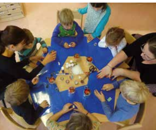
Auch gemeinsames Basteln stand in der Kinderstube auf dem herbstlichen Programm.

Der Monat November zeigte sich uns in diesem Jahr oft farbenfroh und freundlich und auch die Kinder der Kinderstube ha-