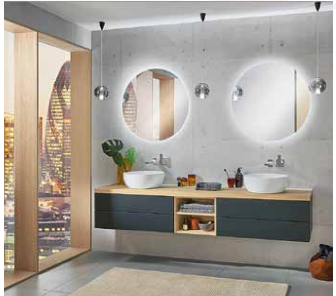
Per Facelift zum Traumbad: Sanipa hat seine modulare Badmöbelserie 2morrow um neue Farben, Oberflächen, Produkte und viele clevere Details ergänzt.

Mehr gibt es unter www.sanipa.de sowie www.homeplaza.de .