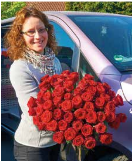
Wir liefern Ihren Blumengruß gern für Sie aus.