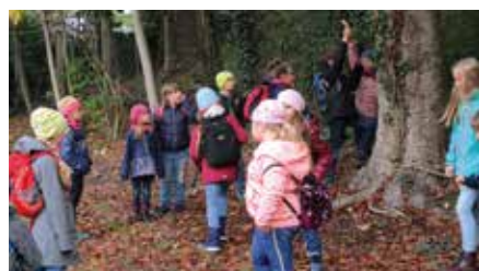
Herbstlicher Spaziergang für die Kinder der Brandiser Hortgruppen.

Fahrzeugparcours rasch, geschwind im Slalom gefahren mit lustigen Stationen gespickt Fahrzeuge