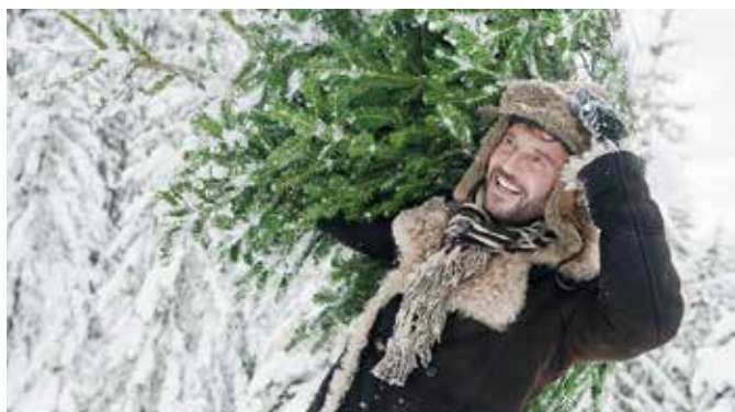
Umweltfreundlich: Am besten wählt man einen Baum aus ökologischem Anbau oder vom heimischen Förster vor Ort aus.