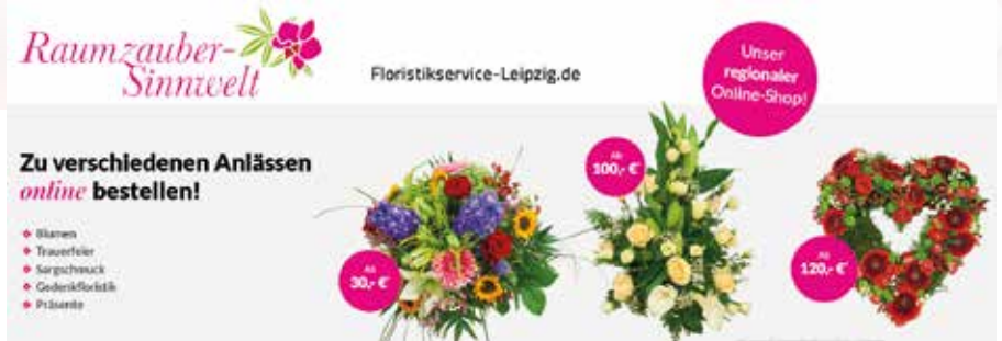
Rund um die Uhr einfach von zu Hause aus bestellen.