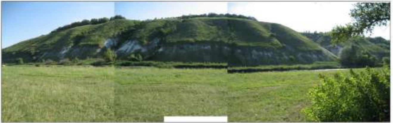
Вигляд з і сходу (з багат шарового поселення Старобільськ-I) на русло р. Айдар та його правий берег. Фото 2007 року.