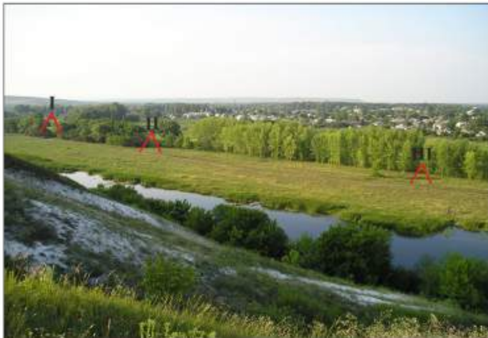
Вигляд на поселення Старобільськ-I, II, III з півдня-південного заходу, з правого берега р. Айдар. Місця поселень позначено червоним, їх нумерація чорним. Фото 2007 року.