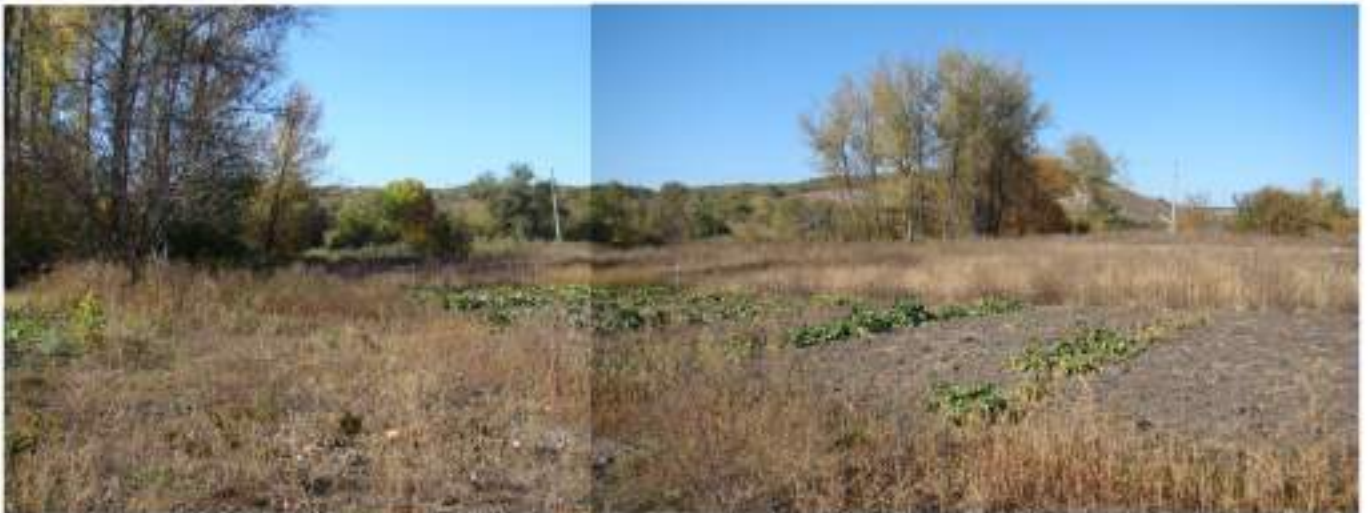
Вигляд з південного сходу на північний захід, на поселення Старобільськ-IV. Фото 06/X/2018 року.