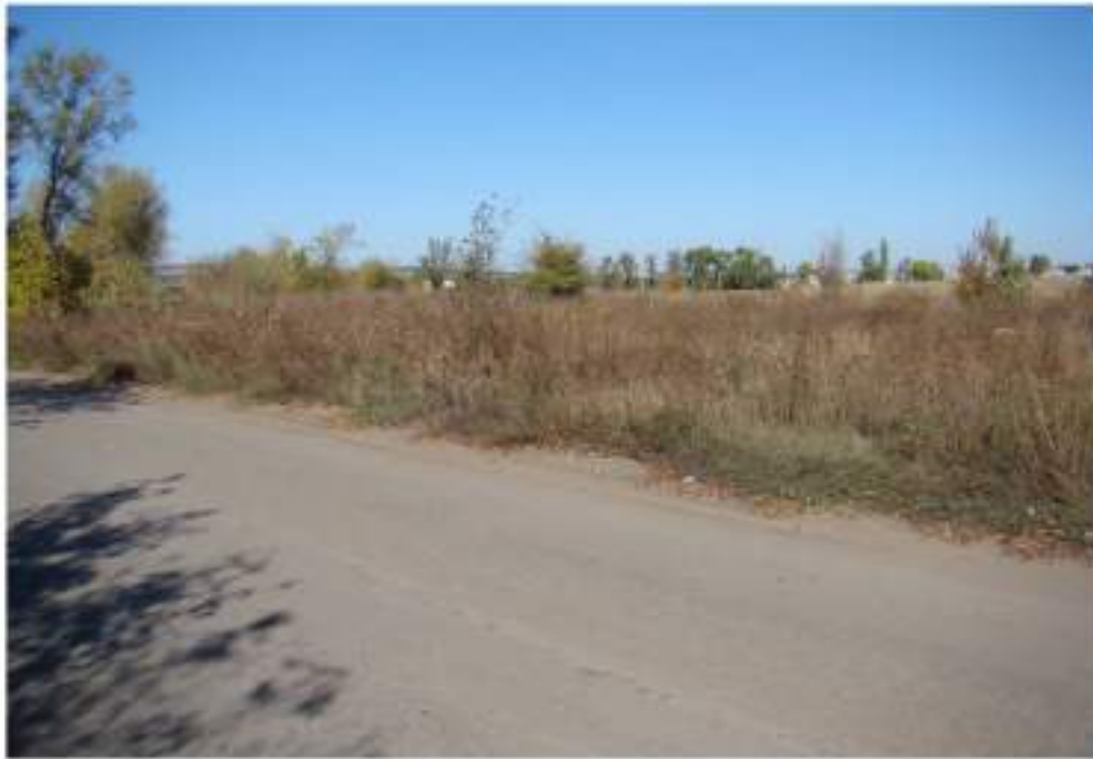
Вигляд з півдня на північ-північний захід, на поселення Старобільськ-IV. Фото 06/X/2018 року.