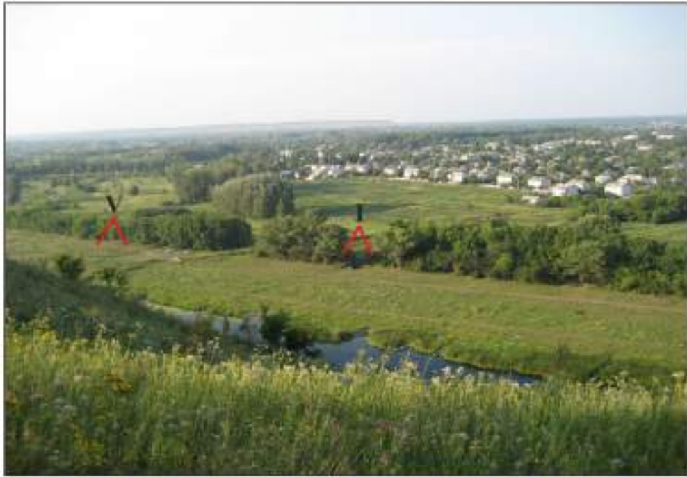
Вигляд на поселення Старобільськ-V та Старобільськ-I з півдня-південного заходу, з правого берега р. Айдар. Місця поселень позначено червоним, їх нумерація чорним. Фото 2007 року.