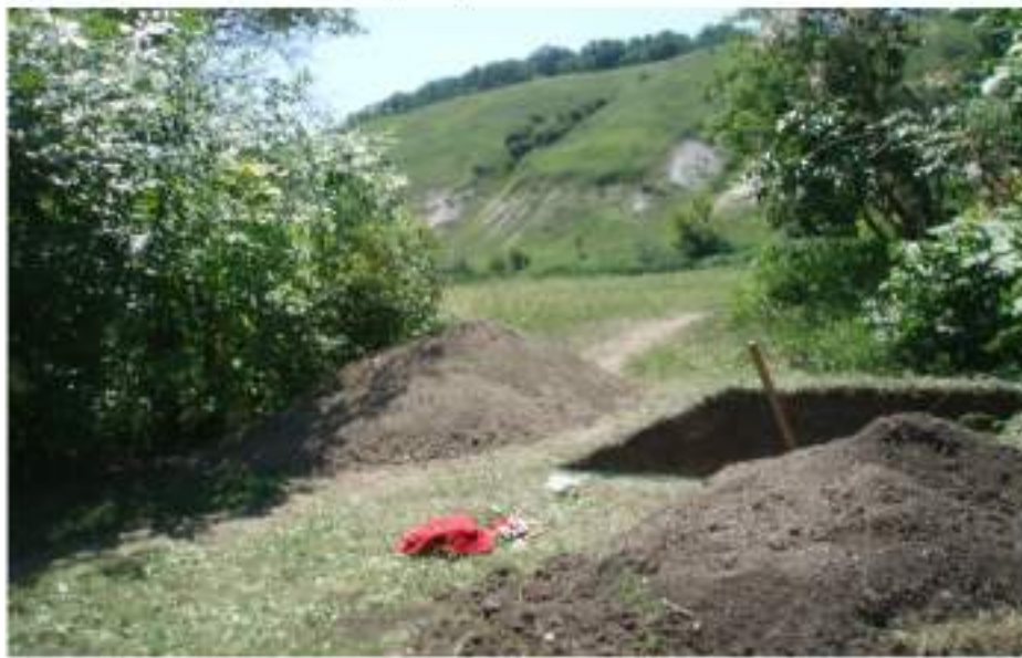
Вигляд з північного сходу ( з багат шарового поселення Старобільськ-I) на русло р. Айдар та його правий берег. Фото 2007 року.