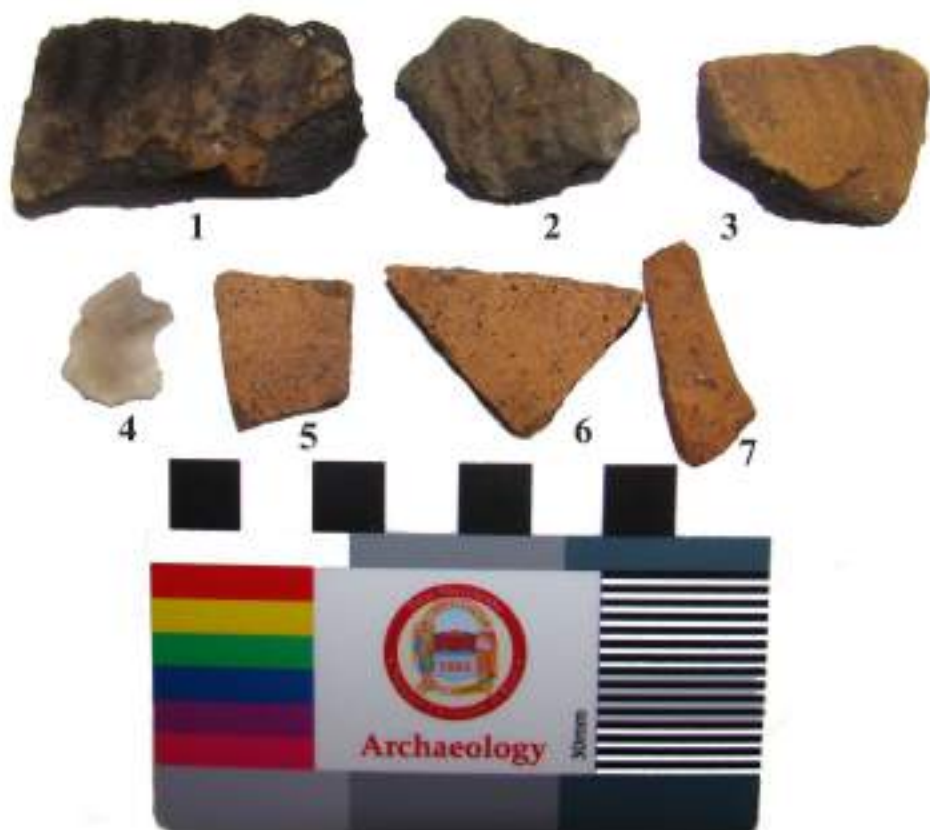
Старобільськ-IV. Археологічний контекст, виявлений в результаті зборів на поверхні. 1,2-кераміка епохи пізнього неоліту; 3-фрагмент ліпної орнаментованої посудини епохи пізньої бронзи; 4-кременевий відщеп; 5,6,7-фрагменти кругляного посуду XVIII-XIX ст.