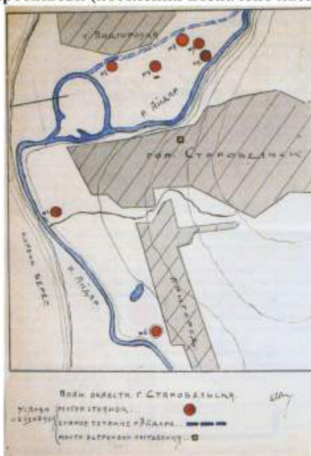
Місце розташування поселень, досліджених експедицією Ворошиловградського музею у 1939-40 рр. (за «Отчет об археологических раскопках в окрестностях г. Старобільска от 26/X-2/XI-1939 г» С.А. Локтюшев).