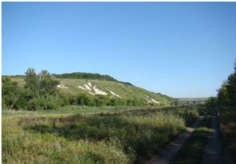
Вигляд з південного сходу на північний захід на долину р. Айдар в місці розташування зони суцільного археологічного заселення. Фото 2015 року.