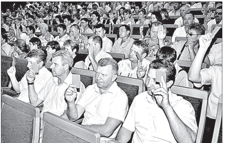
● Коллективный договор признан выполненным.