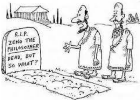
"He was a Stoic's Stoic."

resignadament, el patiment que comporta ser virtuós. El savi estoic virtuós desl darrers temps es caracteritzaria per: