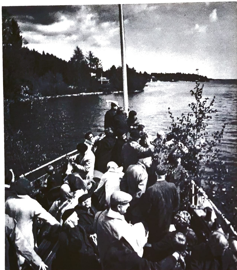
Till Björkö 23 maj 1968.