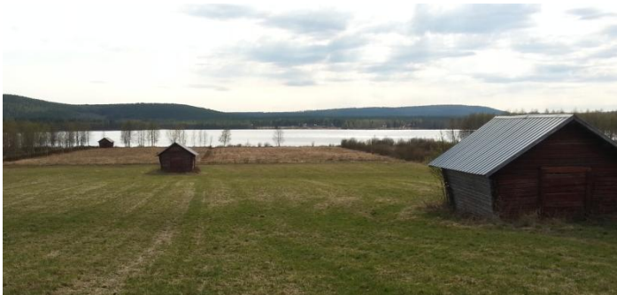
Samma vy som ovan, 74 år senare, 2014. Landskapet närmast sjön har börjat växa igen. Höladorna har minskat och gärdesgårdarna är helt borta (Foto: Evelina Christoffersson, 2014).

Dagens vägdragning genom byn är likadan som på 50-talet bortsett från att vägen längs södra delen av sjön till västra sidan inte finns. En lite större väg går dock ner till sjön där färjan till västra sidan avgick (5) mellan åren 1934-1959 (Lehto 1997). Ett antal mindre stigar som gick över åkrarna, ängarna och helt eller delvis i skogen finns inte heller idag.