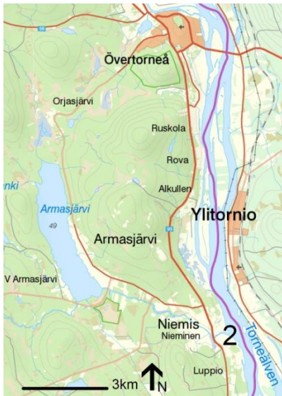
2: Armasjärvi och grannbyn Luppio.

odlingsjordar. Lehto skriver att de första gårdarna i Armasjärvi anlades vid mitten av 1600-talet och att det blev en egen by 1764. På 1700-talet var det enligt Lehto många som flyttade till Armasjärvi, främst hemmansägare och nybyggare. Vid laga skifte år 1877 fanns det 13 gårdar i byn. Lehto (1997) skriver att byn sedan sin uppkomst har varit präglad av jordbruk. Idag finns det ingen verksam jordbrukare, den sista avslutade sin verksamhet för några år sedan. Enligt Lehto driver tolv av invånarna egna företag. Lehto hävdar att det finns ungefär 35 hushåll, med nästan 100 invånare. Som mest bodde det 200 personer i byn under 50-talet. Lehto skriver att det mellan 1934-1975 fanns en skola i byn som efter nedläggningen gjordes om till bostadshus. Han berättar att det har funnits tre affärer i byn, varav den sista lade ner i början av 70-talet. Armasjärvi har sedan 1991 en byastuga och en aktiv byaförening. Lehto skriver att färjan över sjön till västra sidan av Armasjärvi togs i bruk 1933 eller 1934. Han skriver vidare att när det 1959 byggdes en väg runt södra delen av sjön så behövdes inte färjan längre. Bebyggelsen i Armasjärvi är ganska utspridd längs huvudvägen genom byn. Den är blandad med äldre gårdar och villor som byggts mellan 1950-2000-talet.