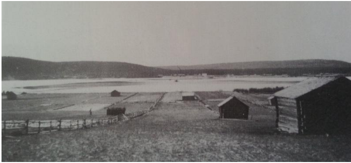
Armasjärvi 1940, sett från byn mot väster. Landskapet var öppet ned mot sjön. Här syns både hölador och gärdesgårdar.