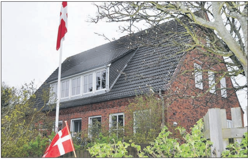
List Danske Kultur- og Forsamlingshus.