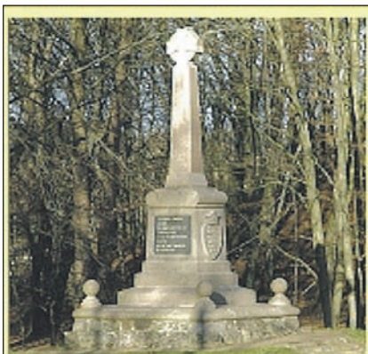
Den danske mindestøtte ved Sankelmark

Alle er velkomne til at bakke op om og deltage i arrangementet, der har udviklet sig til at være et synligt udtryk for fredelig sameksistens i det dansk-tyske grænseland, hvor det tidligere var et udelukkende tysk arrangement. Selv om det oprindeligt var både danske og tyske flensborgere, der efter sigende efter slaget ved Sankelmark i februar 1864 drog ud på slagmarken for at yde en humanitær indsats.