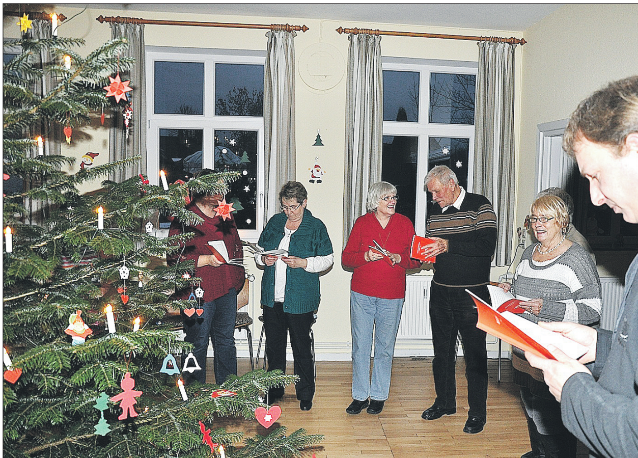
Først en sang, og siden blev der danset.