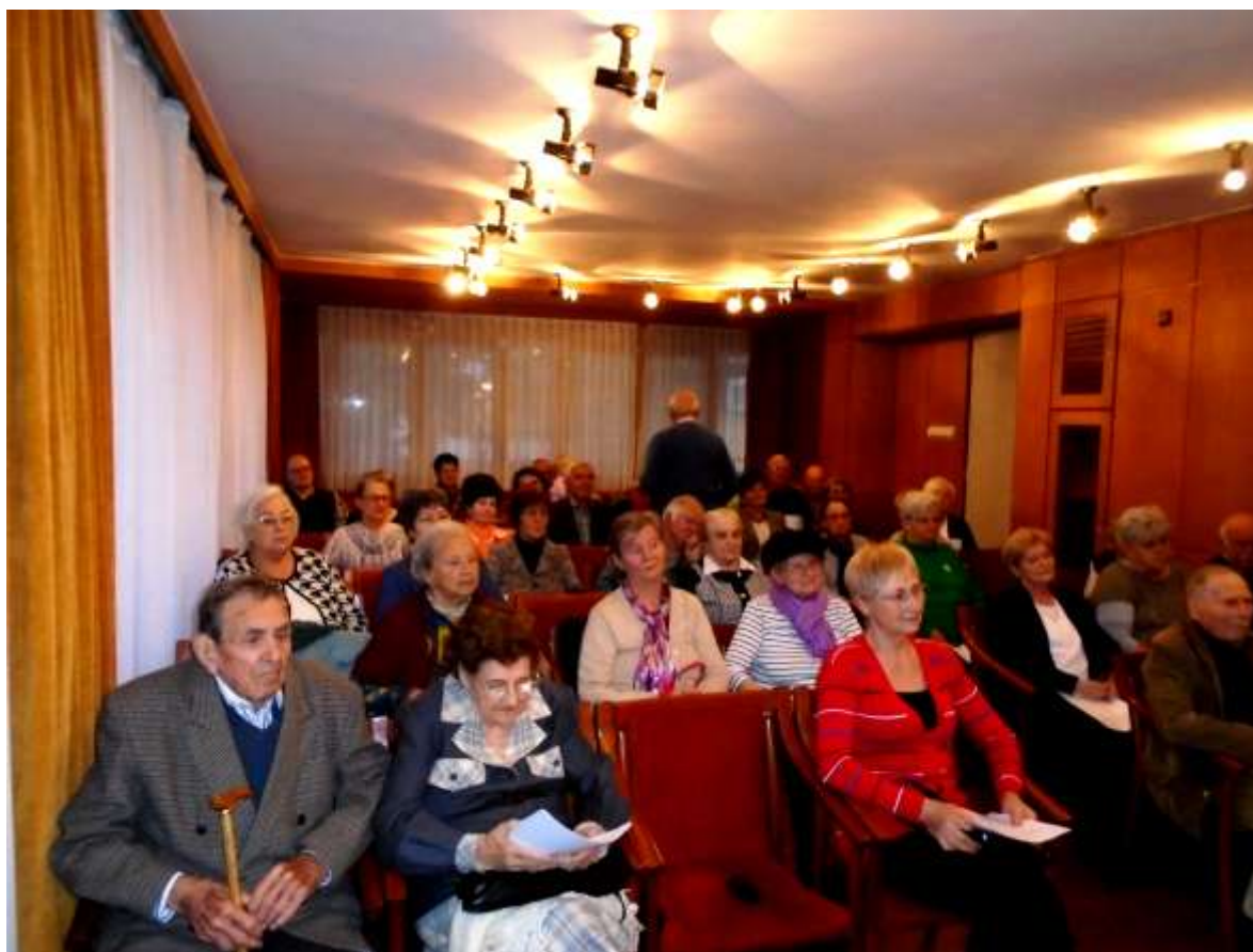
Zenés adventi ünnepség résztvevői 2018. december 7-én