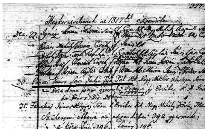
Keresztelési bejegyzése a hajdúszoboszlói református anyakönyvből