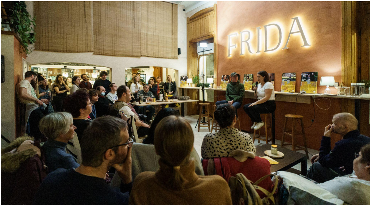
A TASZ debreceni regionális irodájának megnyitó rendezvénye a Frida kávézóban, 2022. december 2-án.

Úgy gondoljuk, hogy a jogvédelem mindenkinek kijár. Éppen ezért hatalmas öröm számunkra, hogy Pécs mellett már Debrecenben is állandó irodával vagyunk jelen. A városban már 2020 óta működött ingyenes jogsegélyszolgálatunk, idén azonban állandó munkatársunk és saját irodánk is lett, amit december 2-án szakmai beszélgetéssel és bulival is megünnepeltünk. Pécs után azért Debrecenben nyitottuk meg új regionális irodánkat, mert Debrecen egy egyetemváros, vannak civil szerveződések, van szabad sajtó, amit a helyi polgárok tartanak fenn. Ezek a szabadság alapjai. A szabadság érték Debrecenben, és ennek az értéknek az erősítésén dolgozunk mi is. Tudatosan szeretnénk hozzájárulni a demokratikus részvétel növekedéséhez, ahhoz, hogy közéleti kérdésekben minél több jogtudatos polgár nyilvánuljon meg. Úgy véljük, ez elengedhetetlen ahhoz, hogy mindenki tisztában legyen az alapvető jogaival és megvédhesse azokat a hatalommal szemben. A missziónk eléréséhez szükséges változásnak ez az alapja.