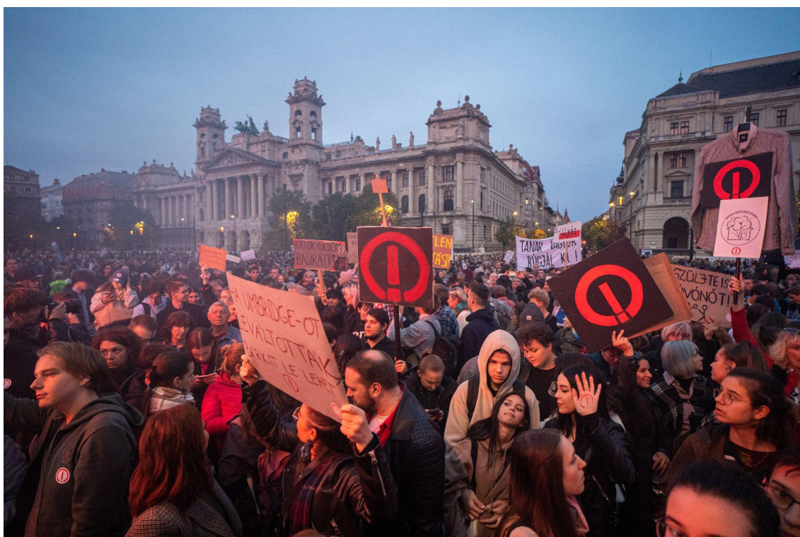
Tüntetés a pedagógus bérek rendezéséért és a közoktatás állapotának javításáért a pedagógusok világnapján Budapesten, 2022. október 5-én.

Hiszünk abban, hogy a bátor kiállásnak ezek a példái másokra is megtermékenyítő hatással lesznek, és közös sikereinkben átélhetjük azt, ami a tüntetéseken egyre többször hangzik fel: Nincs hatalmad felettem!