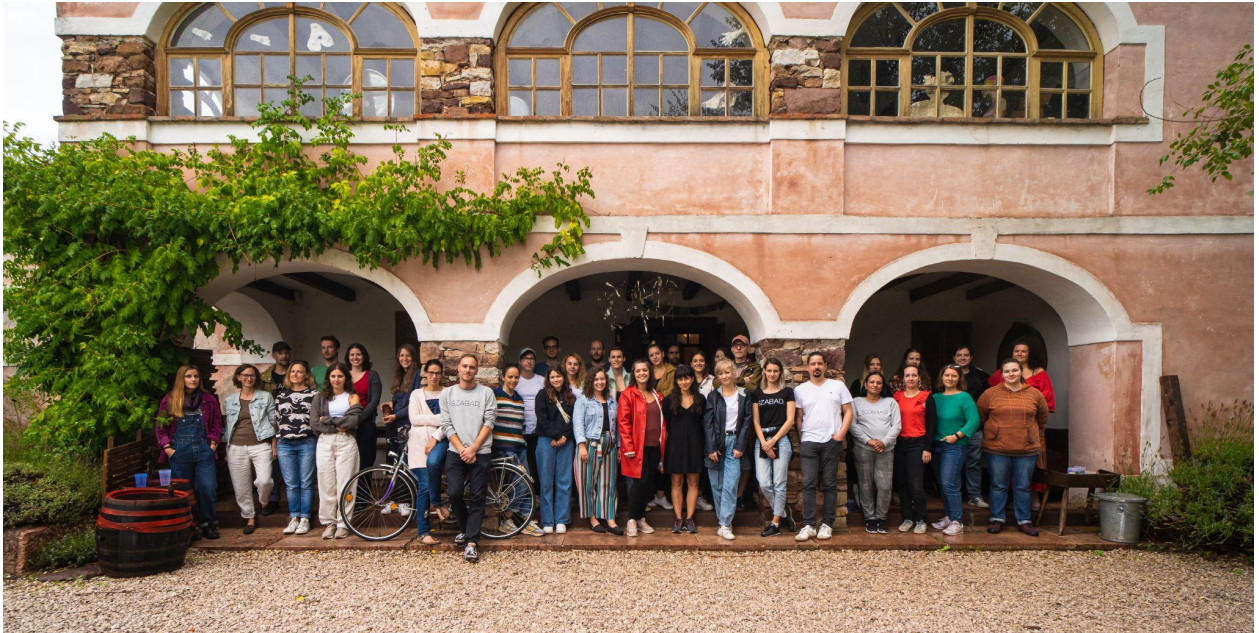
2022. szeptember 15-16. Paloznak