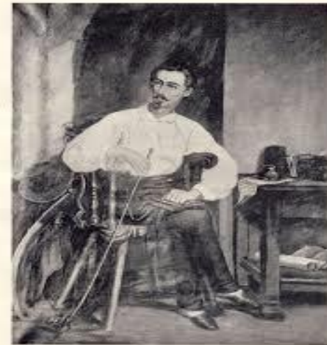
Orlay Péter festmény

Petőfi utolsó képe. Orlay Petrics Soma munkája