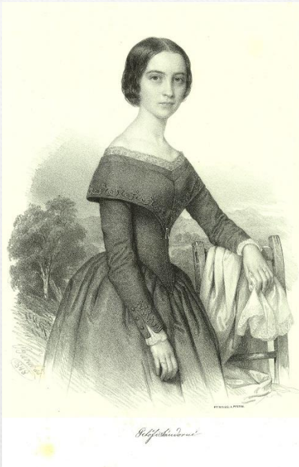
Barabás Miklós festménye