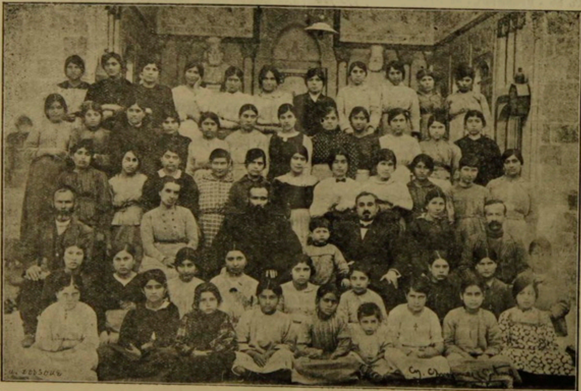
Կ. Բ. Ը. ՄԻՈՒԹԵԱՆ ԴԱՄԱՍԿՈՍԻ ՀԱՅՈՒՇԵԱՑ ԱՊԱՍՏԱՆԱՐԱՆԸ