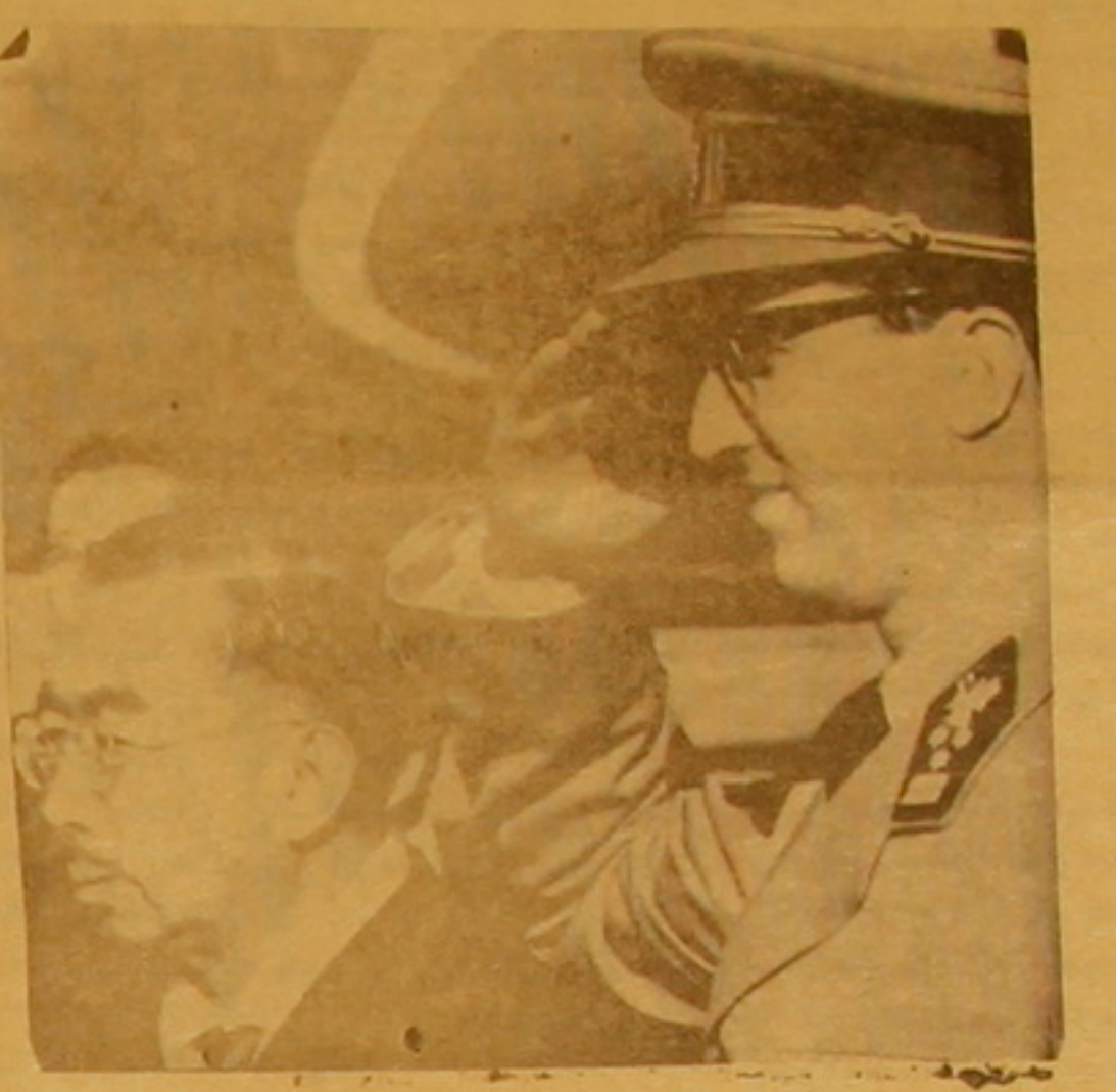
ՊԼՃԻՄՅԱԻ ՊՅՈՒՆԻՆ ԲԱՉԱՆՈՐՔ ԾԱՐՏԻ ԿՅԱՐ ՀԻՐԱԹԻՐԱՅԻ ՆԻՑ

ԳերՄԱՆԻԱ կարճ պայմանաժամով նիւթական օժանդակութիւն խոստացած է Սուրիոյ: