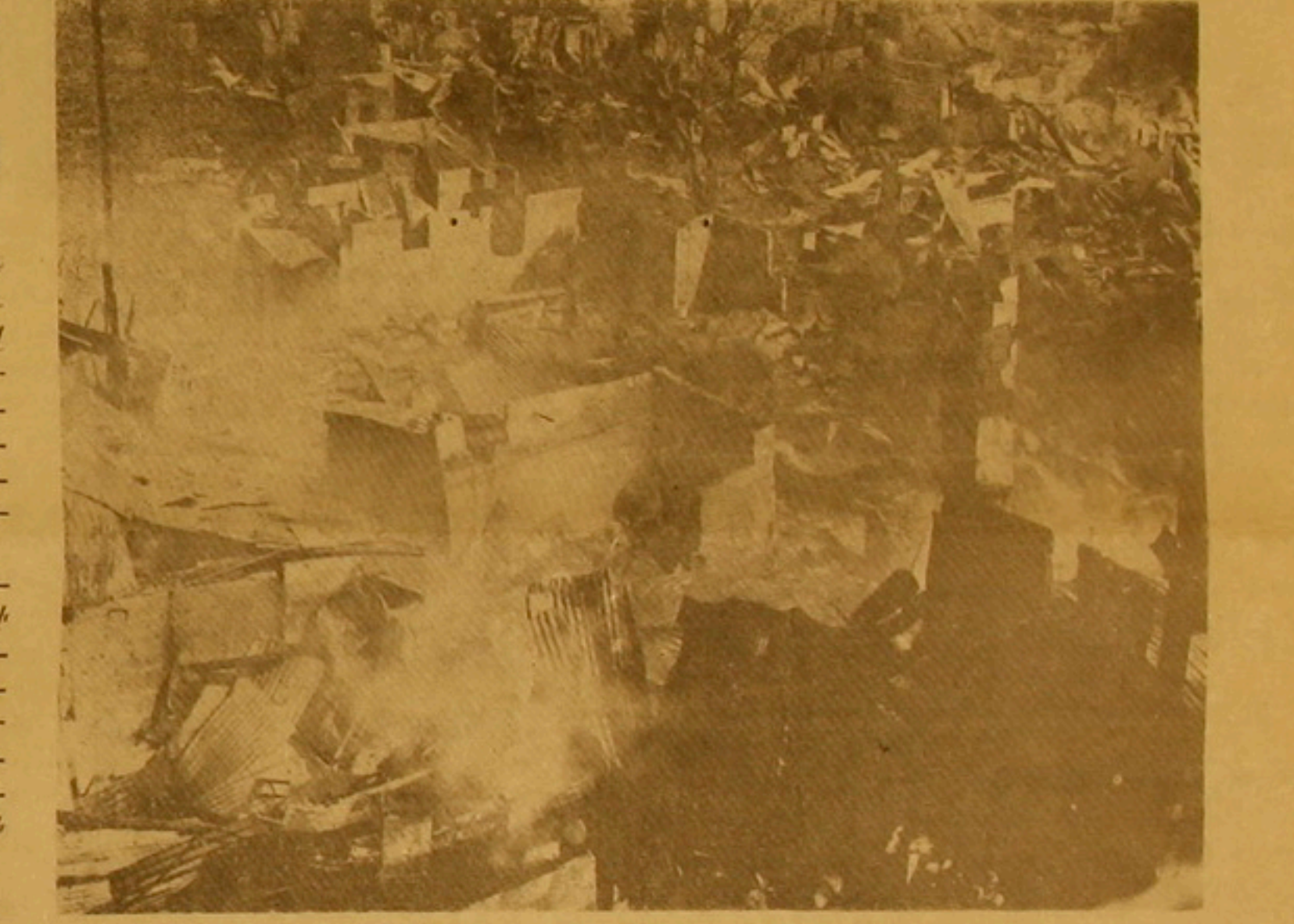
Տեսարան մը համայնակուլ հրդեհի մտք...