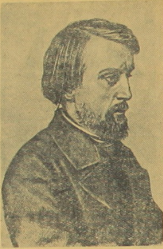
այն եղրակացության, որ միմիայն սոցիալիզմը կարող է փրկել մարդուն աղքատությունից ու ստրկությունից, որ միմիայն սոցիալիզմի ժամանակ կլինի իսկական եղբայրություն եվ հավասարություն:

Ծանապարհորդելով արտասահմանյան մի շարք երկրներ, ծանոթանալով կապիտալիստական երկրներում տիրող կարգերին, Քելինսկին վճռականորեն հանգում է այն կարծիքին, որ կապիտալիստները երբեք չեն կարող լինել հայրենասեր, որ նրանք միմիային իրենց գրպանի եվ որովայնի մասին են մտածում, որ կապիտալիստները հայրենիքից, խղճից, պատվից զուրկ մարդիկ են: Քելինսկին հանգեց