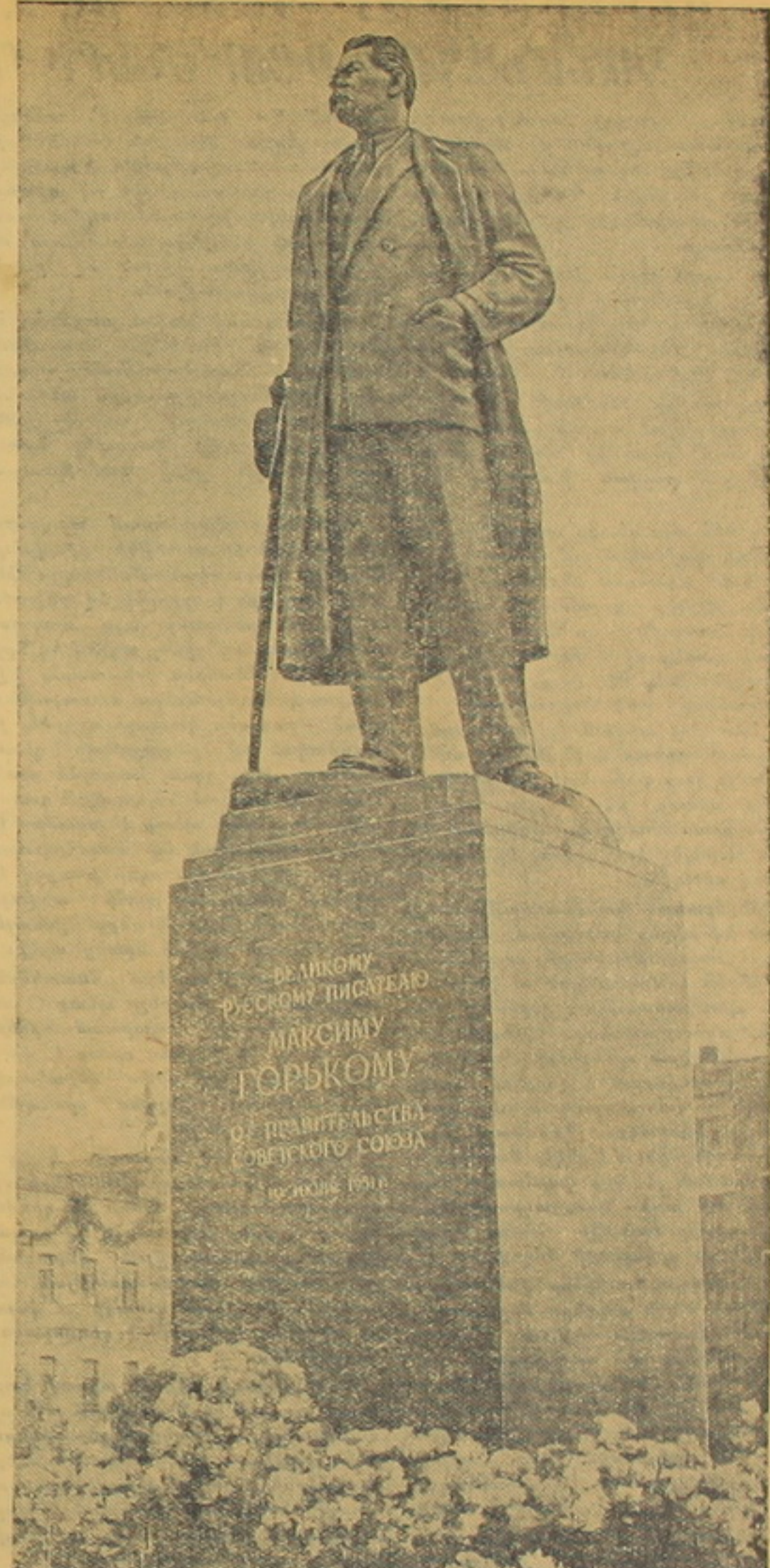
1951 թ. ՀՈՒՆԻՍԻ 10-ԻՆ ՄԵՍԿՎԱՅԻՄ ՈՒՅՎԵԾ Ա. Մ. ԳՈՐԿՈՒ ՀՈՒՅՈՐԾՆԵՐ

Ի. Վ. Միչուրինի ստեղծած կենտրոնական գենետիկ յարքրատորիայի բազայի վրա Միչուրինսկում կազմակերպվել են գիտական հիմնարկներ եվ յարքրատորիաներ: Սովետական երկրում միչուրինյան սորտերի հիքրիդային ֆոնդում հաշվվում է ազելի բան 2 միլիոն բույս: