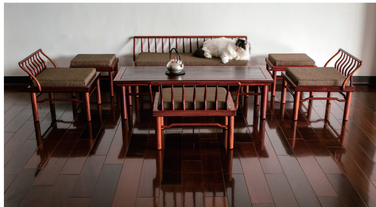
陳念舟設計的茶席家具組（圖／張志清）