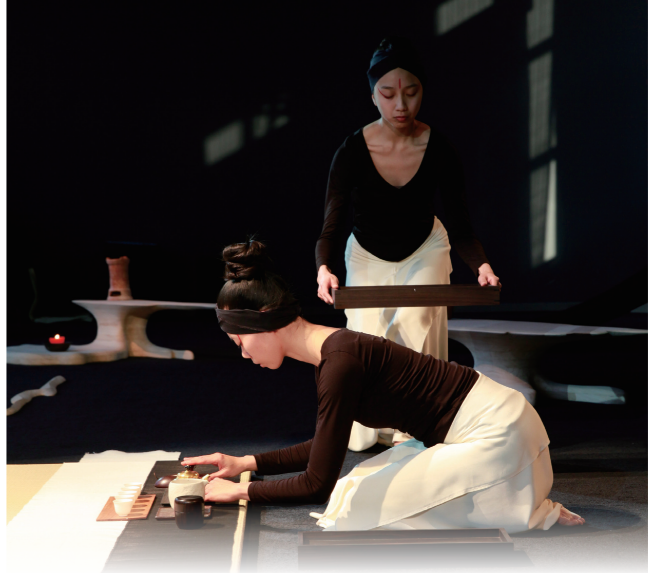
無垢舞蹈劇場於北京鈞天坊演出「茶舞人」