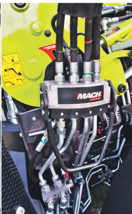
Joystick ElectroPilot-(l.) und Multikuppler (r.) erleichtern die Bedienung und Montage.