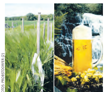
Stabiler Ertrag mit Amidala.