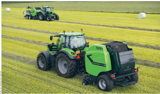
Die variable Presse VariMaster erzielt unschlagbare Hochleistungen.

Festkammerpressen sind nach wie vor als typische robuste Silagepresse beliebt.