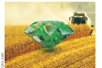
Hohe Erträge mit Juwel Smaragd

KWS-Maissorten sind vor allem aufgrund ihrer hervorragenden Vitalität bei den Landwirten beliebt. Schnelle Jugendentwicklung und gesunde Pflanzen sichern reichlich Erntegut.