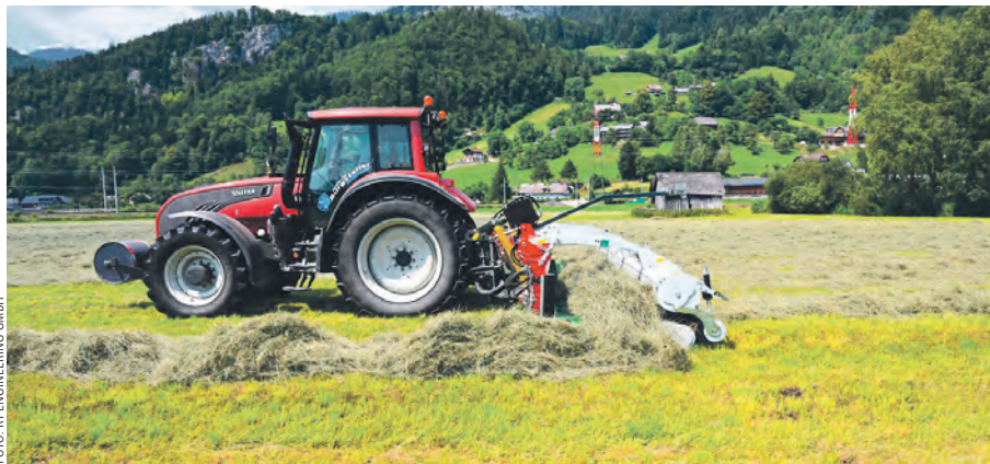
Respiro im Einsatz: Mit dem passenden Traktor Schwaden wie mit einem Selbstfahrer

Neu sei die patentierte Aufhängung der Arbeitseinheiten über zwei Stützrollen und einen Oberlenker. „Dies ermöglicht eine sehr kompakte Bauweise und damit einen Schwerpunkt nahe am Traktor“, betont der Maschinenbauer aus Hofkirchen an der Trattnach. Um das Gewicht und die Komplexität der Maschine bewusst niedrig zu halten, wurde auf die Mittenschwadablage ver-