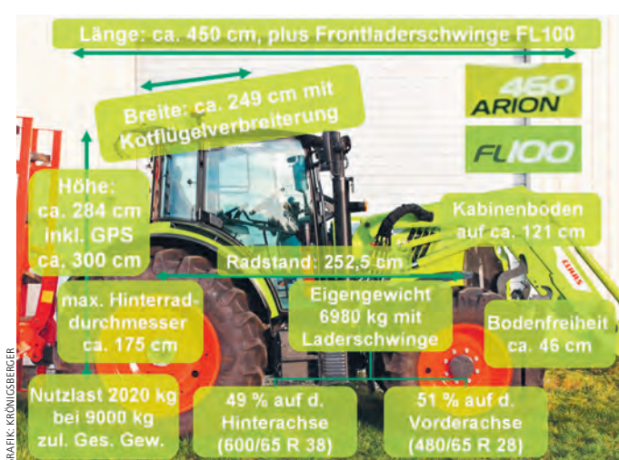
Abmessungen und Gewicht des Claas Arion 460 mit Laderschwinge