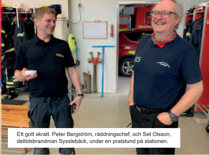
En brandman är alltid redo att rycka ut.