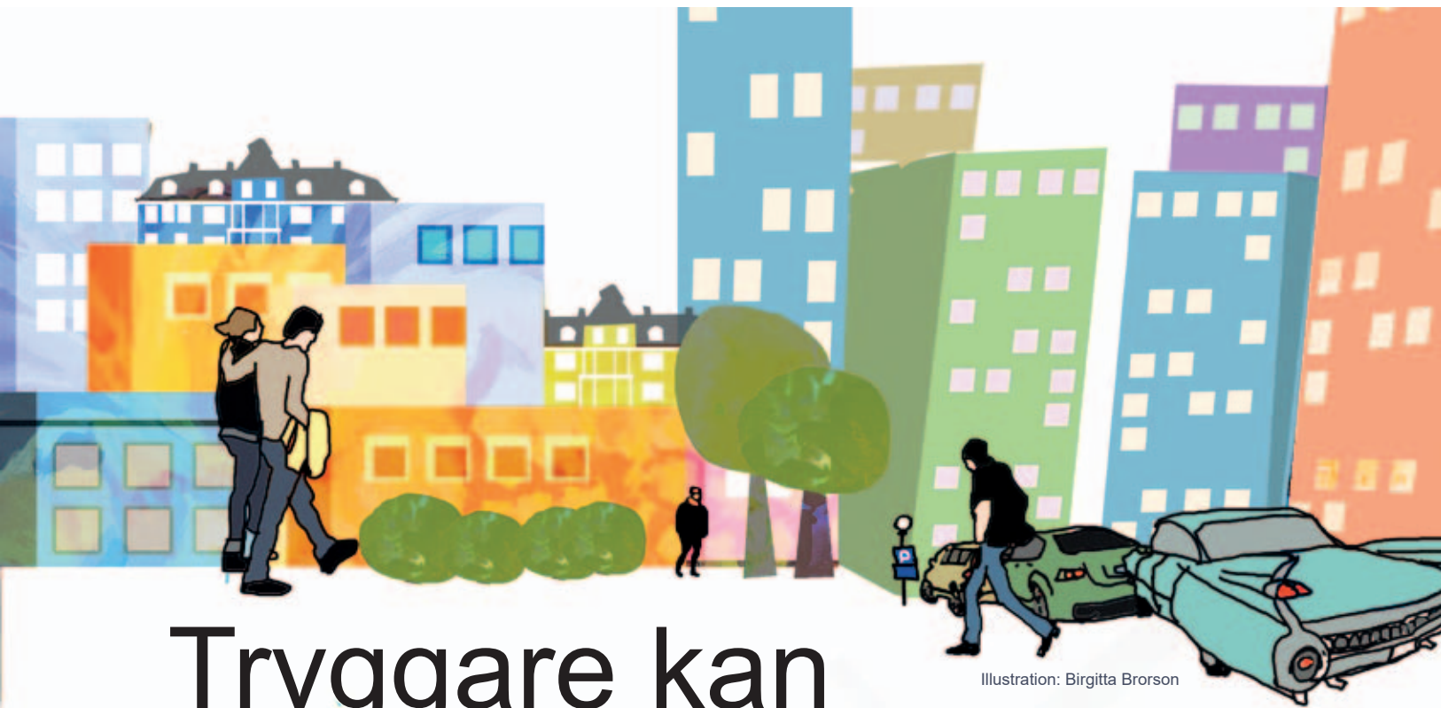
Illustration: Birgitta Brorson