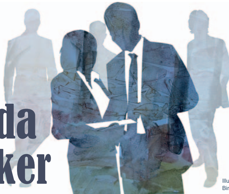
Illustration: Birgitta Brorson

Här finner du de politiker som är nyvalda sedan vi senast redovisade nyvalda i Torsby Nu nr 1, 2020.