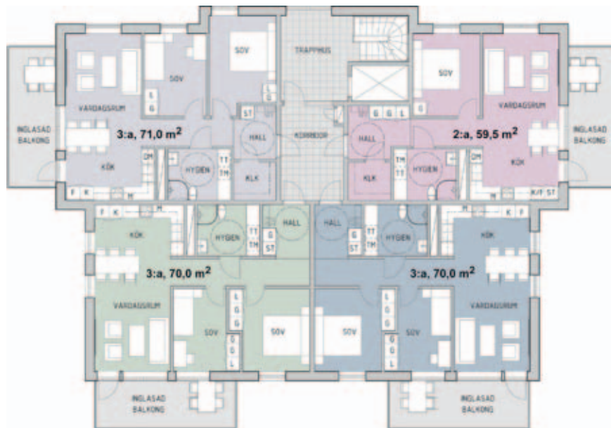
Våning 3-7. Illustrationer och fotomontage: Klara arkitekter