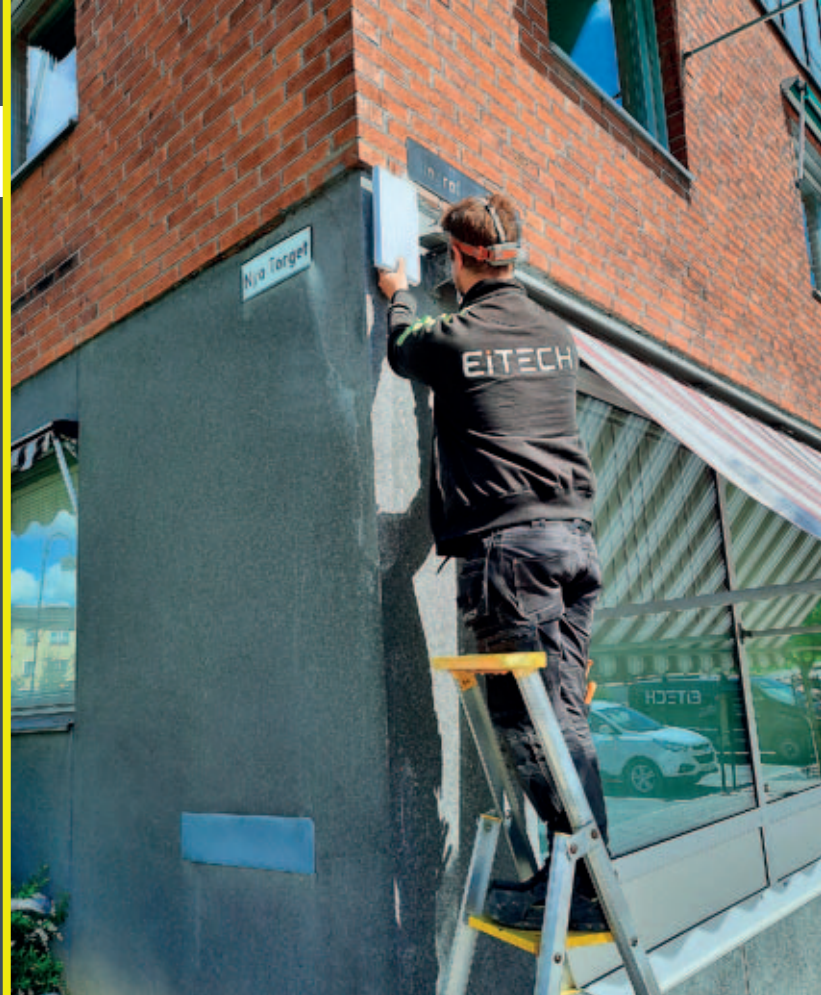
Montering av den första accesspunkten i centrum.