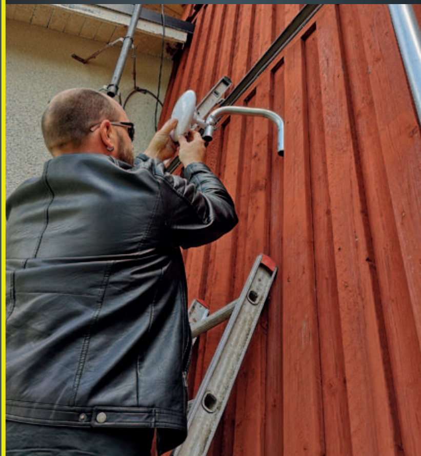
Montering av trådlös utrustning.

COM3 är en förkortning för "Building Competencies for Competitive Companies". I projektet deltar länder från EU Nordsjöregion, vilket innebär att liknande satsningar som i Torsby nu även görs i Belgien, Tyskland, Holland, Danmark, England och Norge. Mer information finns att läsa på www.torsby.se/projektcom3