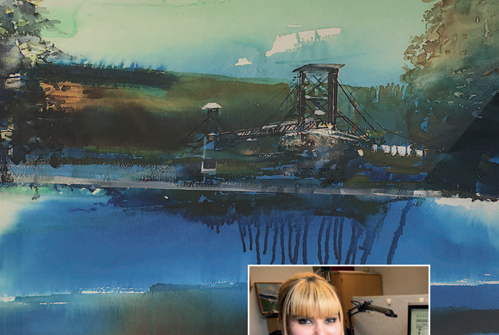
Hängbron heter det här verket av Albin Liljestrand.