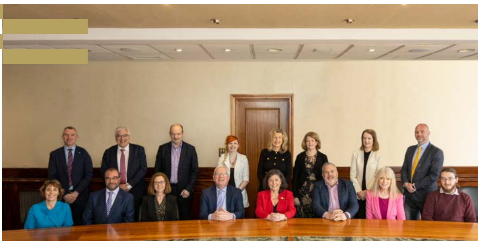
Tionóltar Bord Rialaithe Tionscnaimh Stairiúil TUS den Chéad Uair

“Bhí sár-obair á déanamh sa chúlra ar gach leibhéal den eagraíocht ó bunaíodh TUS breis is sé mhí ó shin – idir chomhtháthú na gcóras agus rolladh amach an bhranda nua. Anois, agus ár mBord Rialaithe méadaithe i bhfeidhm, táimid ag tnúth le tacaíocht a thabhairt d’fhorbairt TUS agus é a stiúradh sa turas dúshlánach ach spreagúil atá amach romhainn,” a dúirt sí.