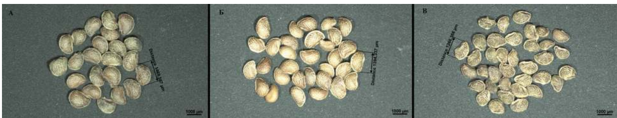
Рис. 6. Внешний вид орешков Potentilla laciniosa (А), P. pedata (Б) и P. recta (В) под увеличением.