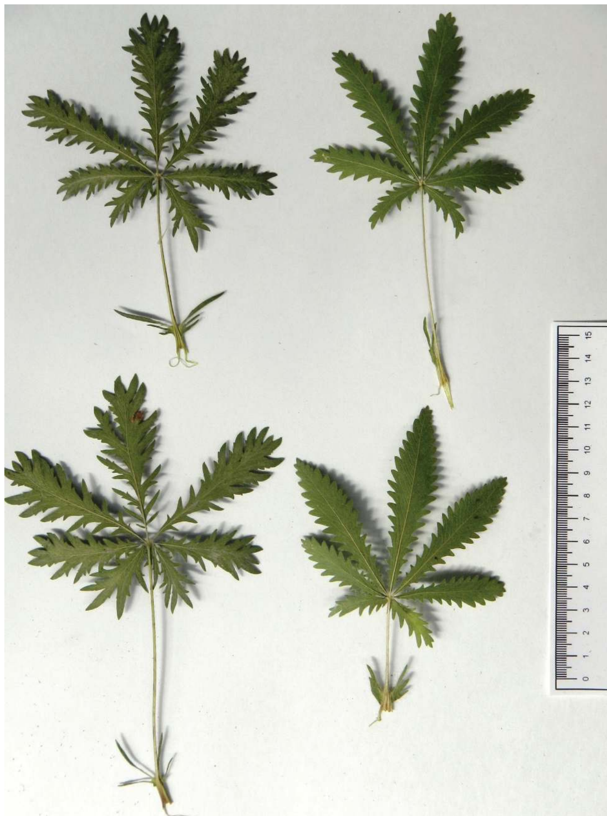
Рис. 4. Внешний вид листовых пластинок Potentilla laciniosa (слева) и P. recta (справа).