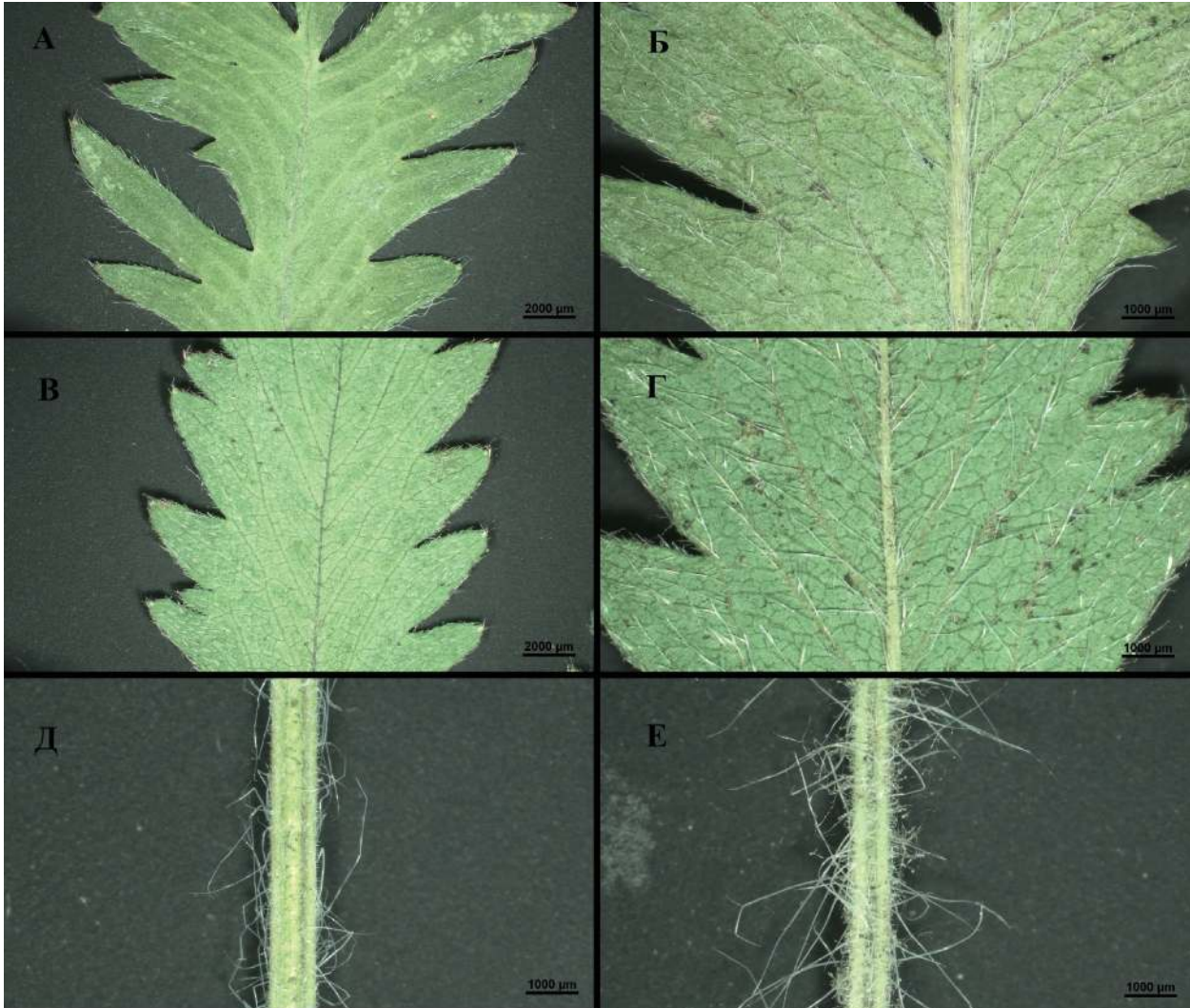
Рис. 5. Некоторые морфологические признаки Potentilla laciniosa и P. recta под увеличением: А – поверхность листочка P. laciniosa с верхней стороны, Б – поверхность листочка P. laciniosa с нижней стороны, В – поверхность листочка P. recta с верхней стороны, Г – поверхность листочка P. recta с нижней стороны, Д – опушение черешка листовой пластинки P. laciniosa , Е – опушение черешка листовой пластинки P. recta .