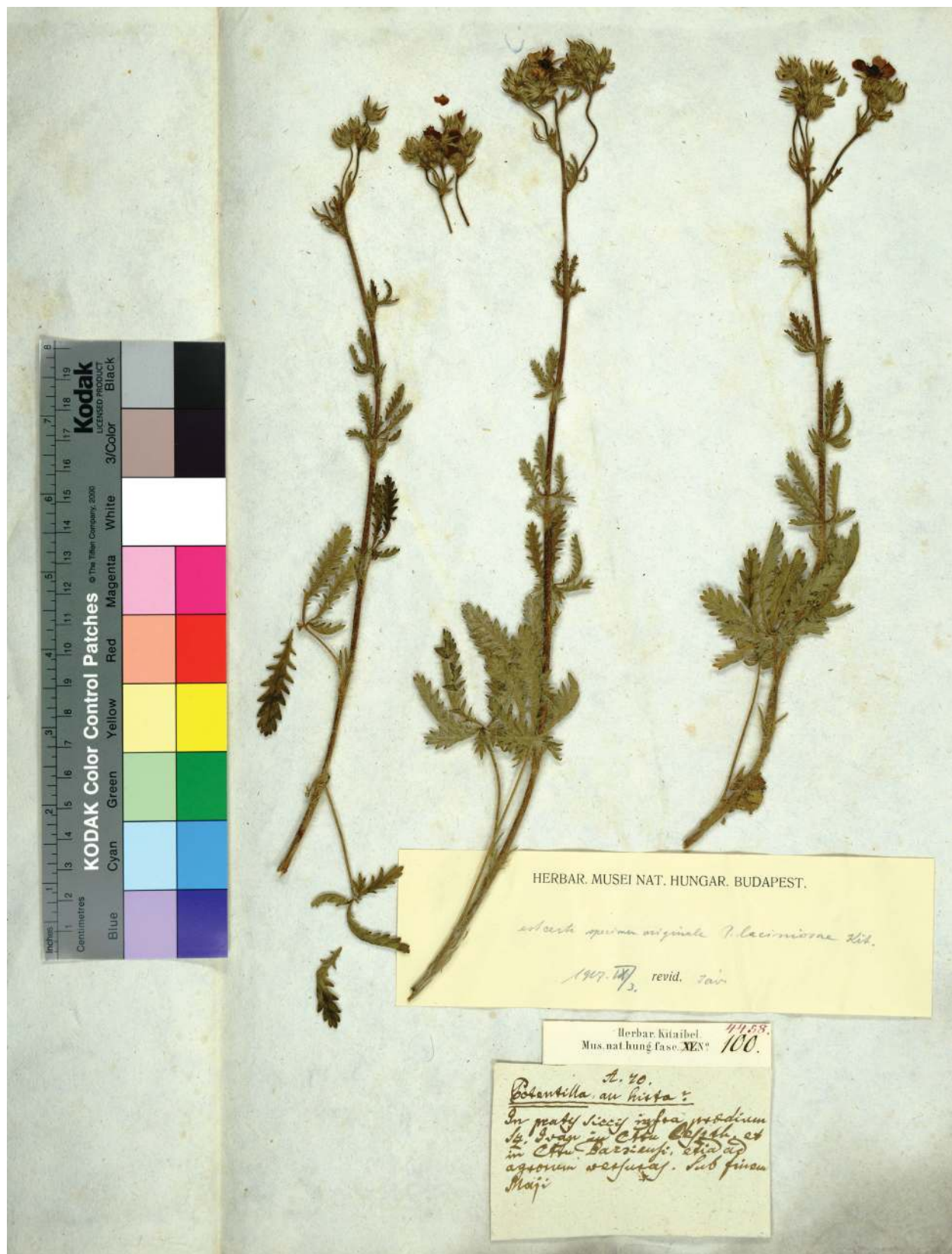
Рис. 3. Оригинальный образец Potentilla laciniosa .