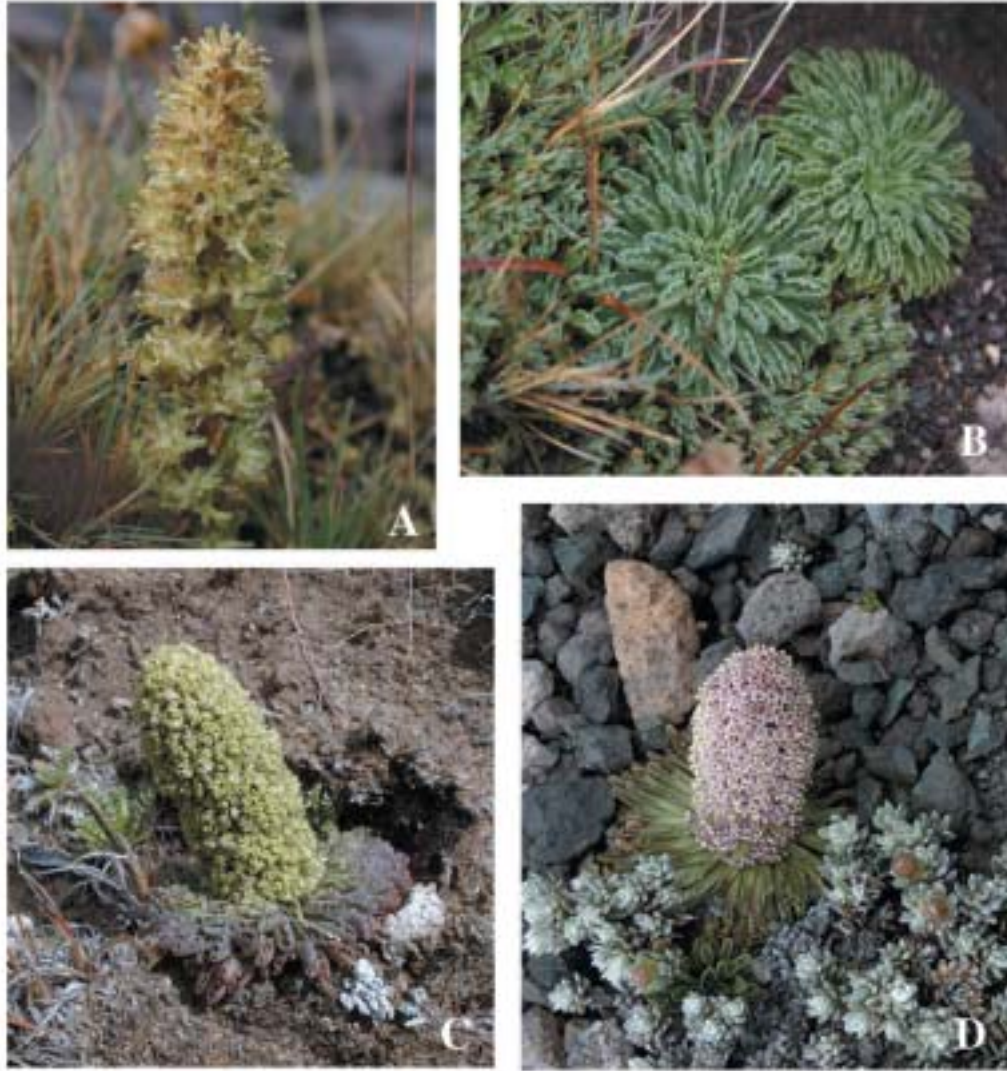
FIGURA 2. Valeriana moyanoi : A. con frutos, B. vegetativa, C y D. con flores.

distribución conocida para la especie en aproximadamente 46 km hacia el oeste, encontrándose protegida en la amplia zona de altas cumbres de la RNLJ. Con este registro el género Valeriana queda representado en Chile por 45 especies, y la familia Valerianaceae por 49.