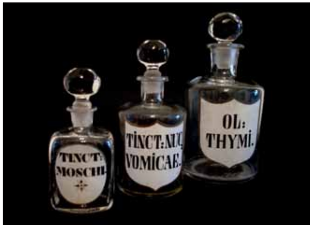
Slika 6. Deo kolekcije staklenih stojnica tipa boca iz Filijalne apoteke u Kragujevcu koja je radila od 1853. do 1859. god.

Od svoga osnivanja 1853., Filijalna Pravitelstvena apoteka je poslovala narednih šest godina, do sredine 1859. kada je po odluci kneza Miloša Obrenovića kupoprodajom ustupljena njenom dotadašnjem provizoru mr ph. Radosavu Šiliću.