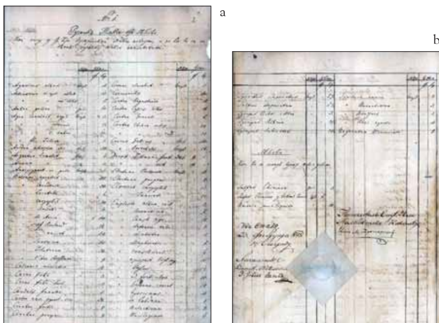
Slike 4. Naslovna (a) i poslednja (b) strana Dodatak Austrijskoj taksi lekova koji je donet uz Pravila o rukovanju Pravitelstvene apoteke iz 1845 god. Ovaj dodatak je obuhvatio lekove koji se nisu našli u izdanju takse iz 1836. god. i glasi: “ Ručnik takse lekova koji nisu u Cesarsko -Austrijskoj taksi navedeni, a za koje će se po ovom računu taksa naplaćivati ”.

Kada je u Kragujevcu osnovana filijalna apoteka, kao druga državna apoteka u Srbiji, na osnovu već postojećih pravila za Glavnu apoteku, 15.