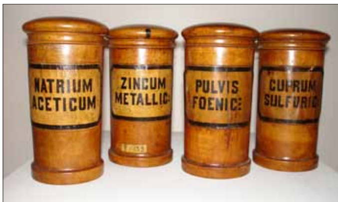
Slika 7. Deo kolekcije drvenih stojnica albarello tipa sačuvanih iz Filijalne apoteke u Kragujevcu koja je radila od 1853. do 1859. god.

Dva staklena suda za ekstrakciju u obliku lule, na čijim se krajevima nalaze otvori. Koristili su se za izolovanje, odnosno ekstrakciju supstanci iz biljnog ili životinjskog materijala.