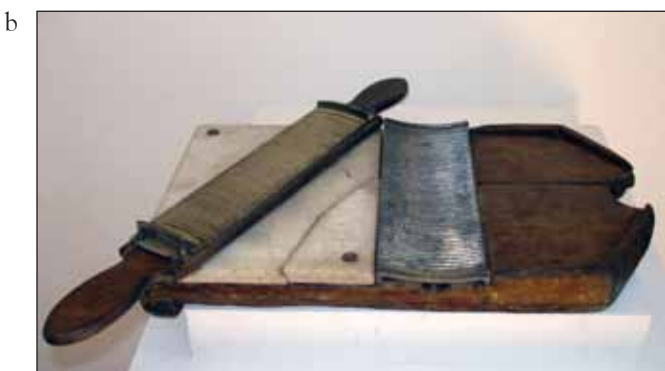
Slike 9. Pilular (a) i nož za sečenje pilula (b) koji potiču iz Filijalne apoteke u Kragujevcu koja je radila od 1853. do 1859. god.

Figure 9 Pill holder (a) and a pill knife (b) belonging to the Kragujevac branch pharmacy that operated from 1853 to 1859.