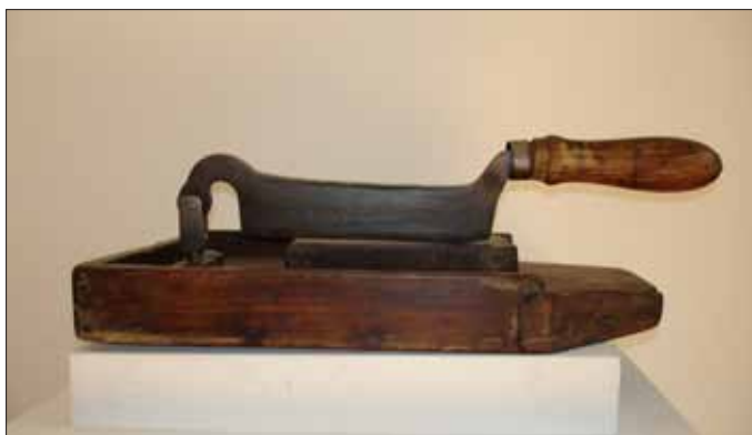
Slika 8. Nož za sečenje korenja i trava sa drvenim postoljem koji potiče iz Filijalne apoteke u Kragujevcu koja je radila od 1853. do 1859. god.

Figure 7 Items from a collection of the albarello-style wooden jars of the Kragujevac branch pharmacy that operated from 1853 to 1859.