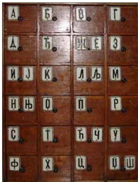
Slika 10. Deo sačuvanog inventara koji potiče iz Filijalne apoteke u Kragujevcu koja je radila od 1853. do 1859. god.

Figure 10 Objects belonging to the Kragujevac branch pharmacy that operated from 1853 to 1859