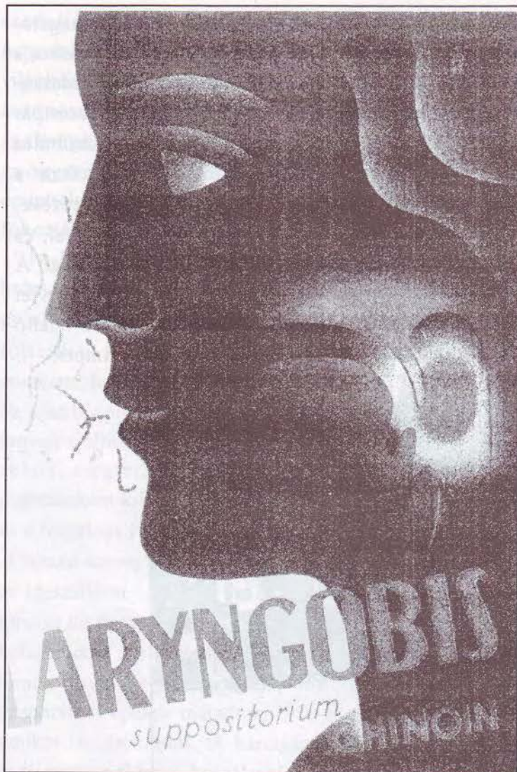
Reklámok a „hőskorból”