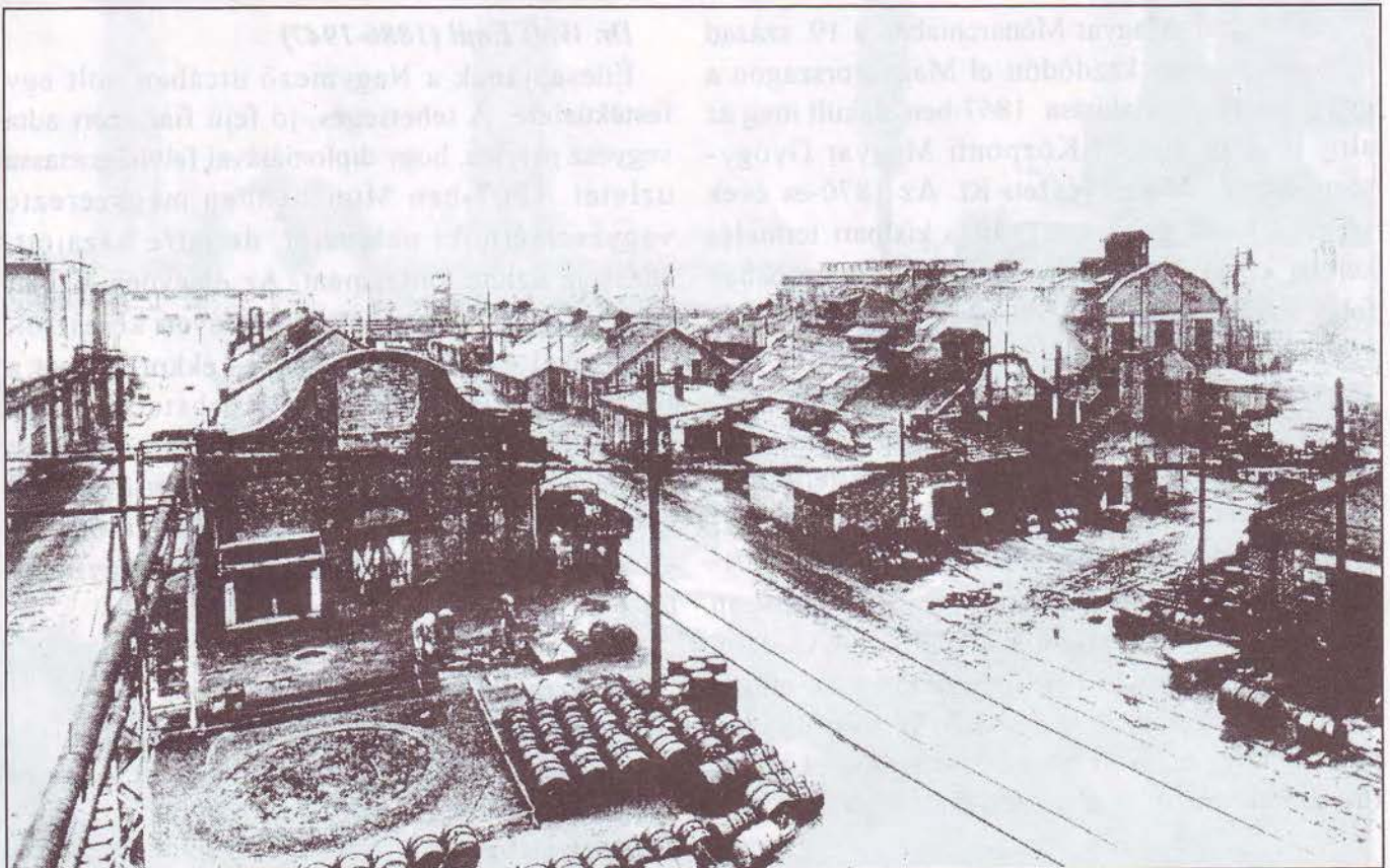
A Chinoin gyártelepe madártávlatból, 1921-ben