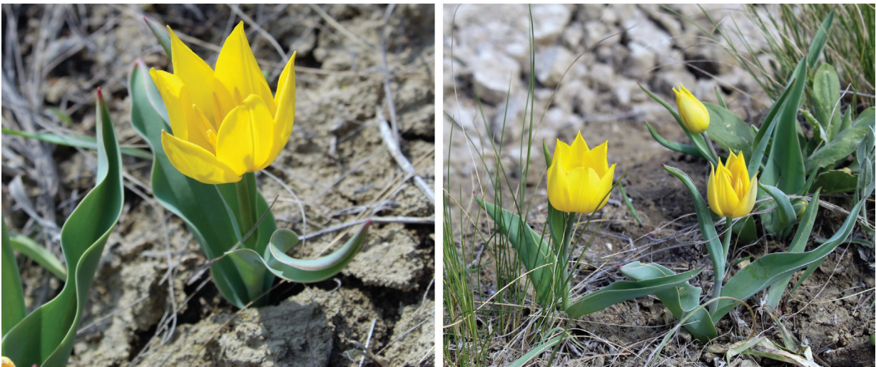
Рис. 2. Низькорослі рослини Tulipa suaveolens у посушливий рік (04.04.2020)