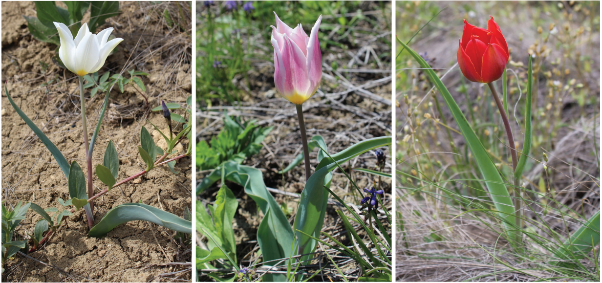
Рис. 3. Рослини Tulipa suaveolens з оцвітинами різних кольорів (30.04.2021)