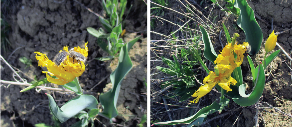
Рис. 1. Рослини Tulipa suaveolens , пошкоджені Tropinota hirta (21.04.2018)