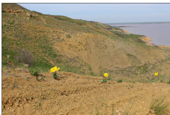
Рис. 7. Схили Куяльницького лиману після екстремальної їзди на мотоциклах (30.04.2021)