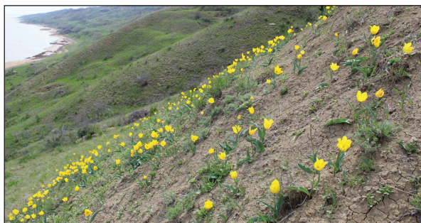
Рис. 6. Tulipa suaveolens на зсувному схилі (30.04.2021)