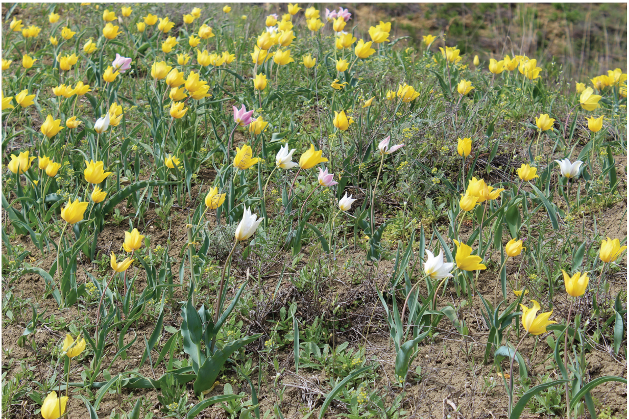
Рис. 4. Загальний вид ділянки рослин Tulipa suaveolens з оцвітинами різного забарвлення (30.04.2021)