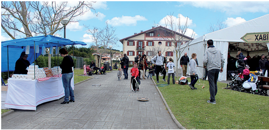
Larunbaterako egun osoko festa eguna antolatu dute Getariako San Prudentzio auzoan. NEREA URANGA