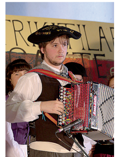
Aurreko edizio bat.

Txapelketan 18 urte arteko trikitilariak parte hartu dezakete. Bikote bakoitzak hiru pieza jo behar ditu: Trikitia, pot-pourria (gehienez zazpi minutuko iraupena) eta aukeran Arin-arina, fandangoa eta porrusalda. Epaimahaiak honakoa baloratuko du: piezen zailtasuna, bat etortzea, kantua, dantzagarritasuna