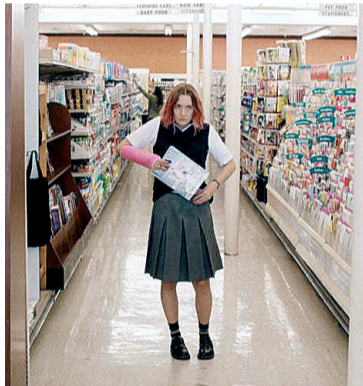
Saoirse Ronan.

KULTURA // Dantza saioez bete-ta dator maiatza. Hasteko, hilaren 5ean, Dantzazaleon Eguna izango da, eta horren barruan, Afrikako dantzen masterclassa egingo da. Astinduko bazkideentzat doan izango da, eta besteentzat 15 euro. Egun horretan bertan bazkaria ere izango da. Aurreko kasuan bezala, doan izango da bazkideentzat; bazkide ez direnek 15 euro ordainduko dituzte. Izenak maiatzaren 2ra arte eman daitezke Alondgia kultur etxean (10:00-13:00), edo astindu.zde@gmail.com edo kulturetxea@zumaia.eus helbideetara idatzita.