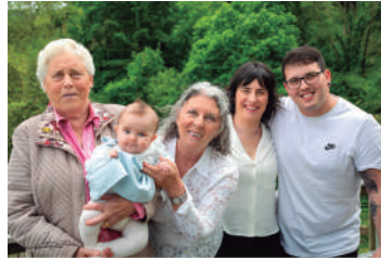
Familiako bost belaunaldi. JAVIER LUCAS