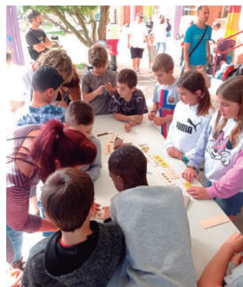
Baratzea, sanmartinak, bazkariak eta askariak, kros txikia eta eskularen tailerra.

trukea ere bai, herriko beste talde batzuekin. Guraso elkarteak kudeatzen du goizetako ezinbesteko zaintza zerbitzua ere. Gurasoek zuzenean parte hartzen dute eskola kirolaren saioetan. Eta, orain, gurasoek baratze berriaren proiektua abiatu dute.