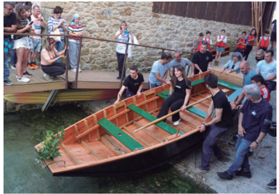
Ikasleek Mutiozabalen egindako alaren botadura ekitaldia.

"ONTZIOLAN ERE LANTZEN DIRA MATEMATIKA, HISTORIA ETA FISIKA, BAINA BESTE MODU BATERA"