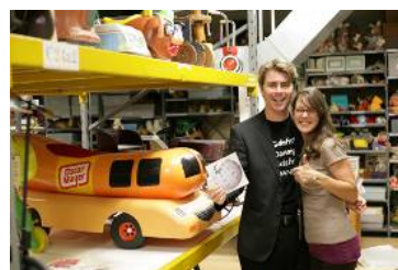
Twee Wikipedians-in-Residence - Bron