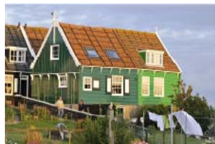
Een winnende foto van Wiki Loves Monuments NL

3) Wiki Loves Monuments NL - is een fotowedstrijd om zo veel mogelijk kwalitatief hoogwaardige en vrij te gebruiken foto's van rijksmonumenten te verzamelen. Het uitgangspunt voor de wedstrijd was een aan Wikimedia gedoneerde databank van de Rijksdienst voor Cultureel Erfgoed (RCE). Het doel was iedereen die gebruik maakt van Wikipedia een goed overzicht te geven van het prachtige monumentale erfgoed van Nederland. Dit heeft tot nu toe 13719 foto's van ruim 8000 monumenten voor de Commons opgeleverd.