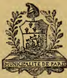
Armes de la Municipalité de Paris, en 1790.