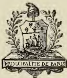
Armes de la Municipalité de Paris, en 1790.

TOME QUATRIÈME ASSEMBLÉE LÉGISLATIVE (PREMIÈRE PARTIE)