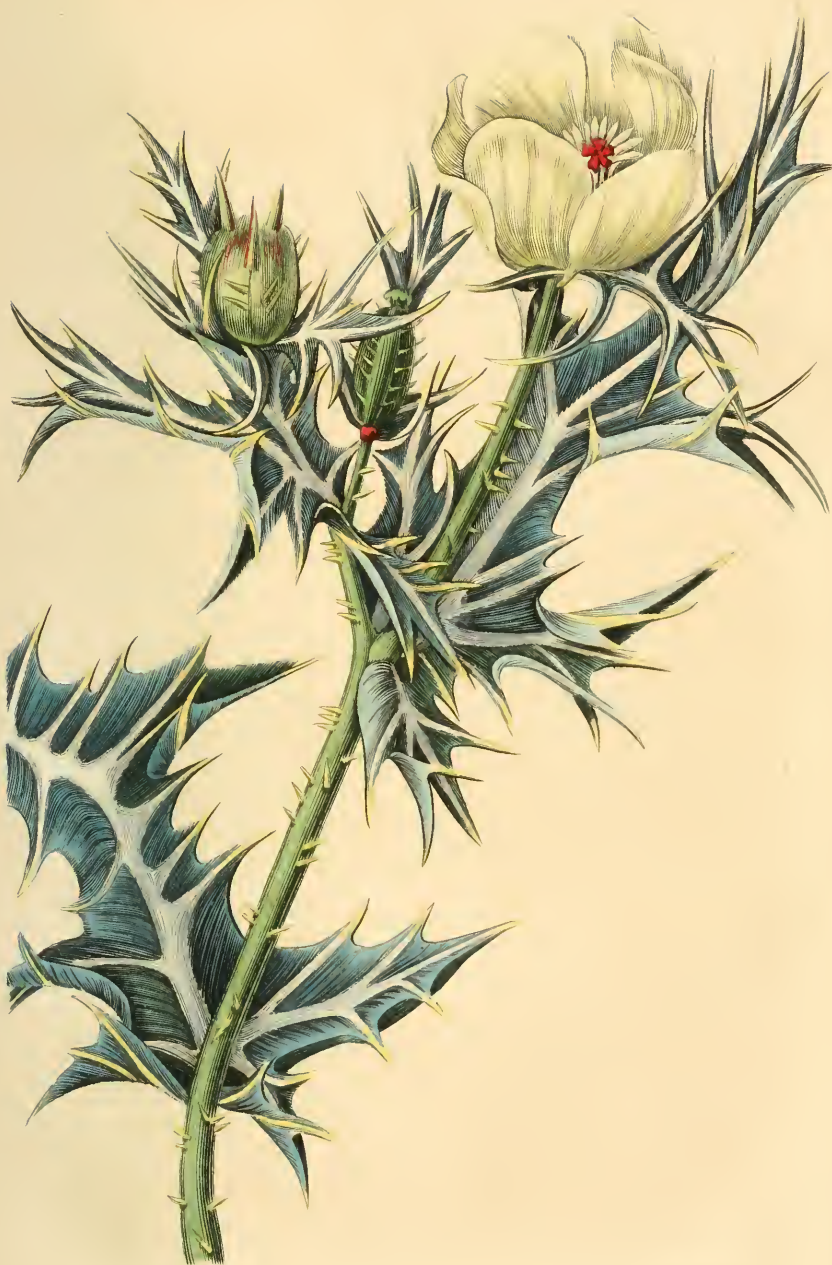
ARGEMONE JAUNE PÂLE