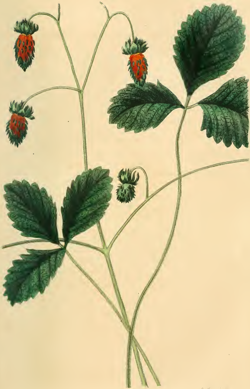
FRAISIER DE PLYMOUTH