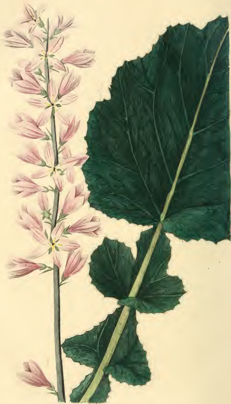
FRANCOA A FEUILLES DE LAITRON