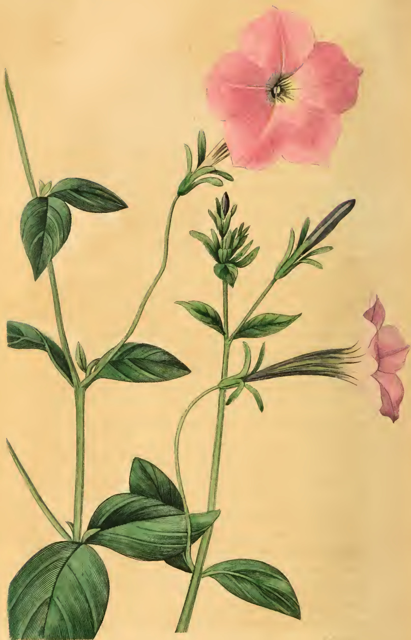
PÉTUNIE À FLEURS VIOLETTES Pétunia violacea.