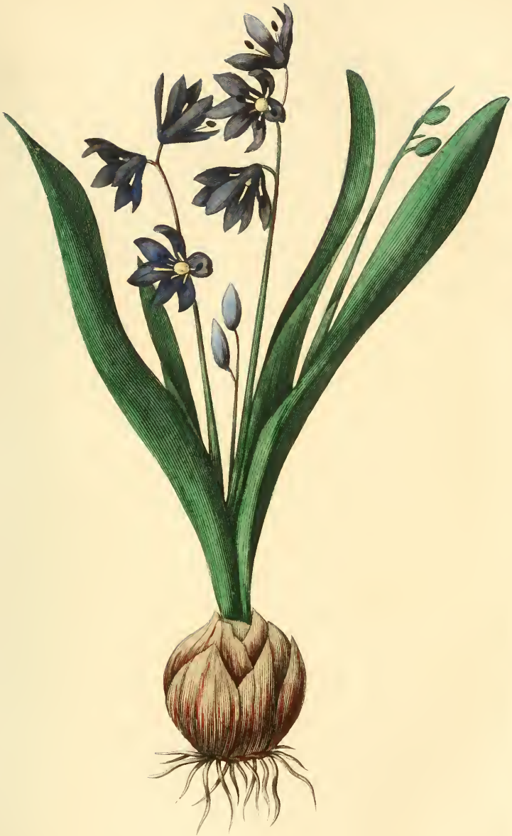
SCILLE DE SIBÉRIE Scilla Sibirica