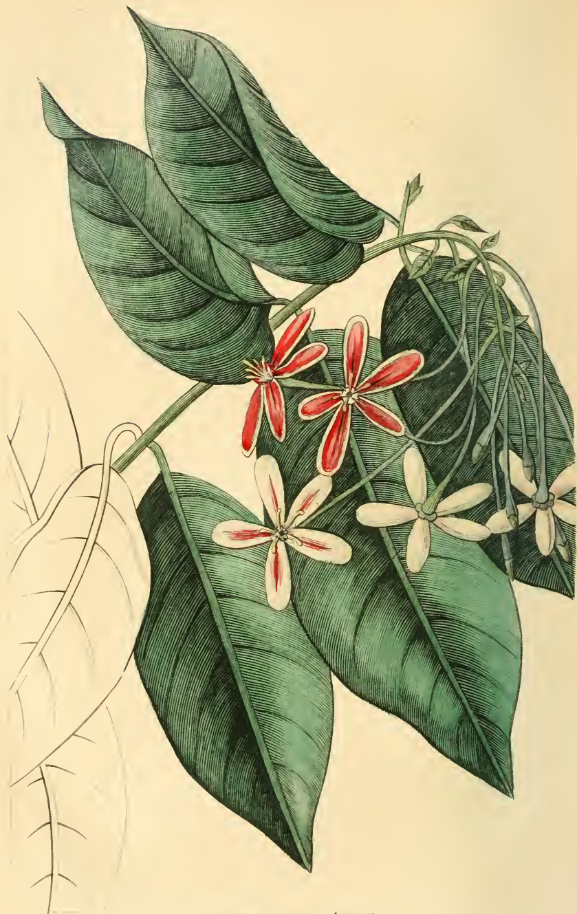
QUISQUALIS DE L'INDE