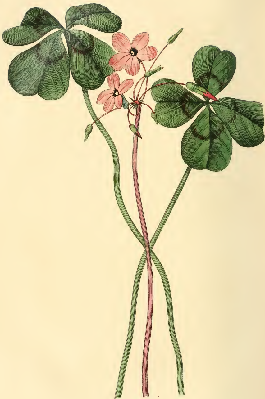
SURELLE DE DEPPE