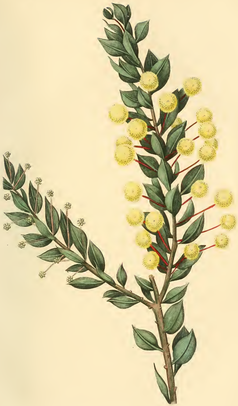
ACACIE À FEUILLES D'OLIVIER Acacia oleifolia .