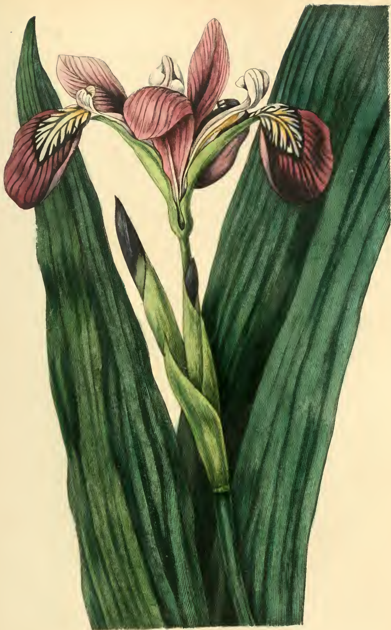
IRIS DE DIVERSES COULEURS