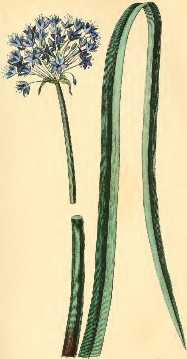
III. AZURÉ Allium Azureum.