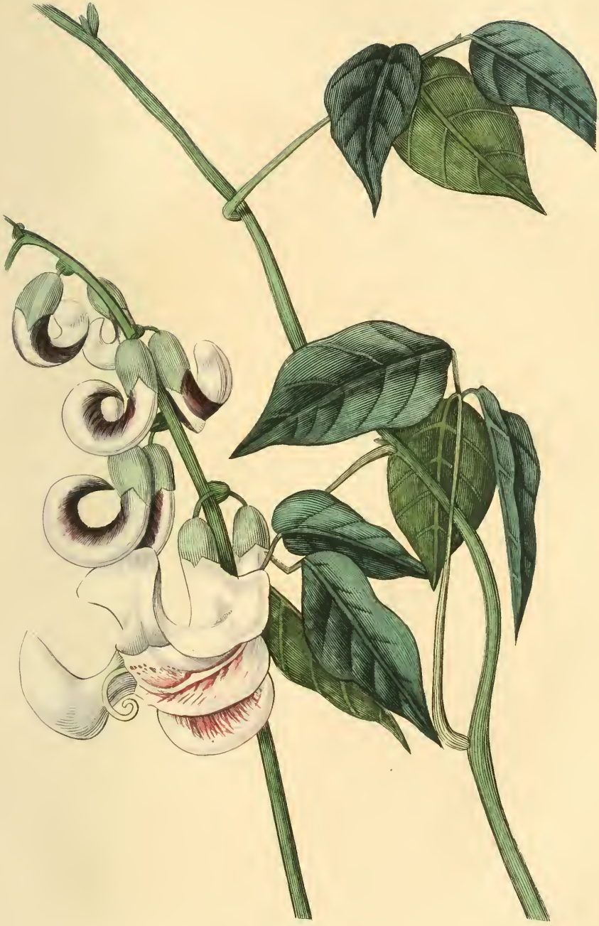
HARICOT CARACOLLE Phaseolus caracalla