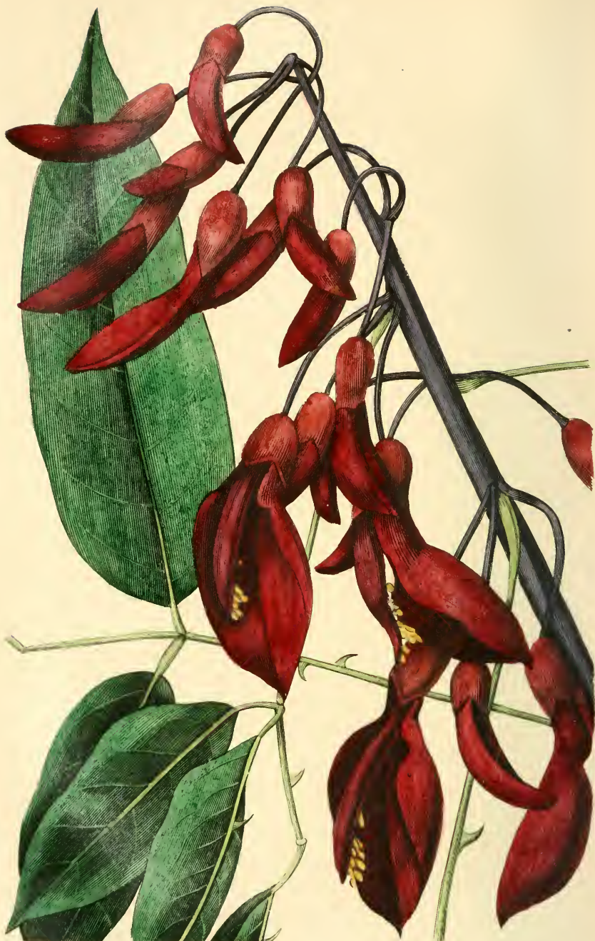
ERYTHRINE CRÊTE DE COQ Erythrina crista-galli