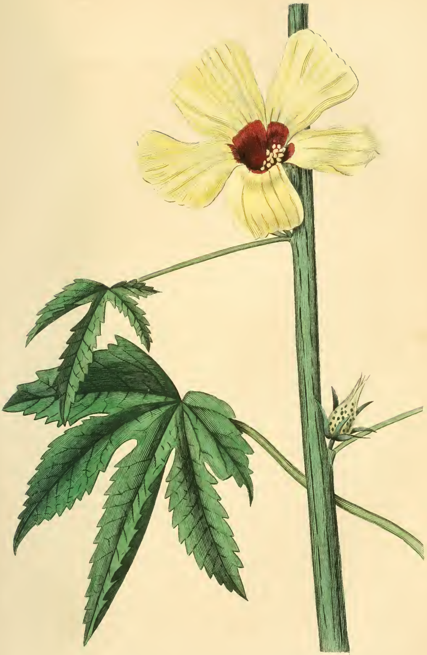
KETTIE À FEUILLES DE CHANVRE