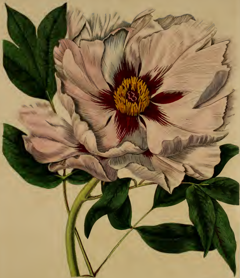
PIVOINE PAPAVERACEE A FLEURS ROSES