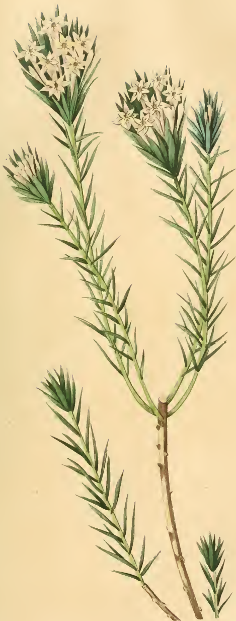
GNIDIENNE À FEUILLES DE PIN