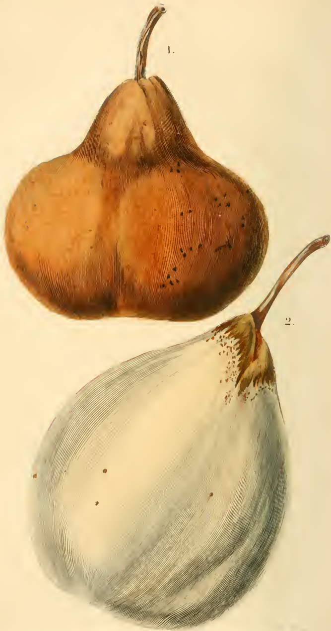
1. POIRE PARFUM D'HIVER.