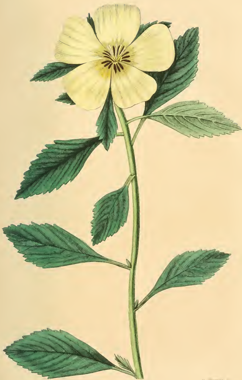
TURNÈRE À FLEUR DE KETMIE