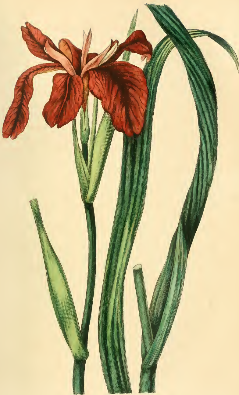
IRIS FAUVE Iris fulva