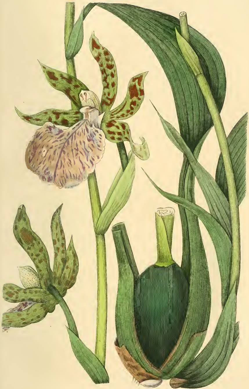
ZYGOPÉTALON DE MACKOY.