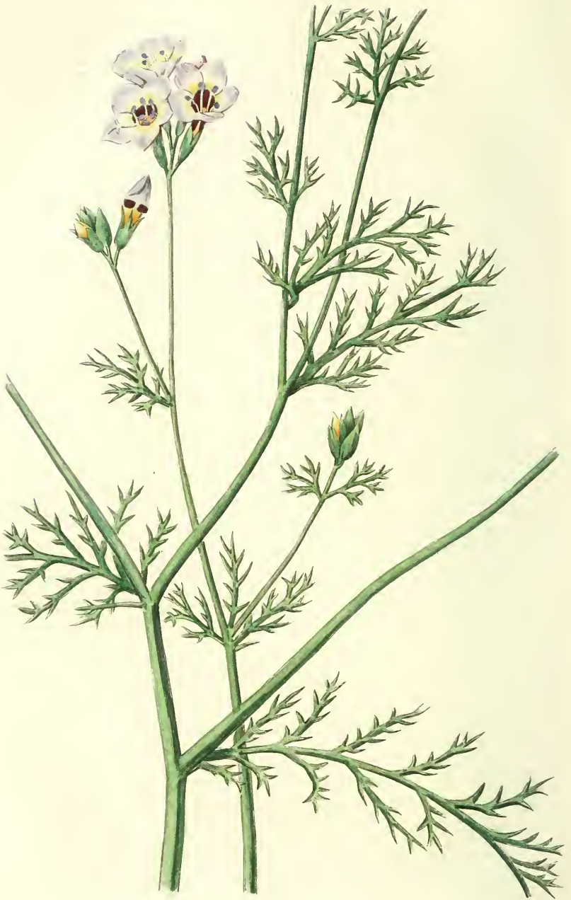
GILIE DE TROIS COULEURS