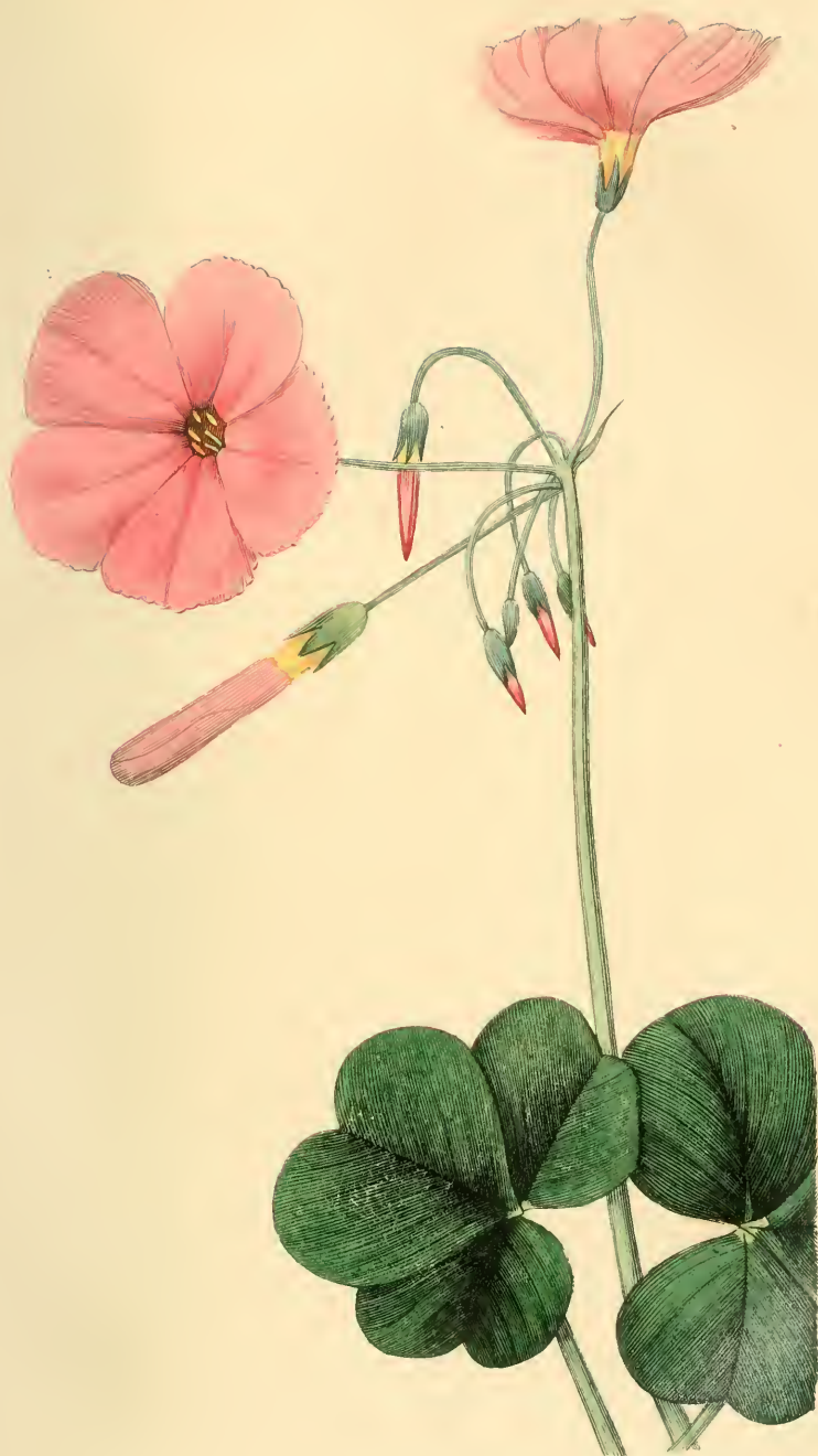
SURELLE DE BOWE