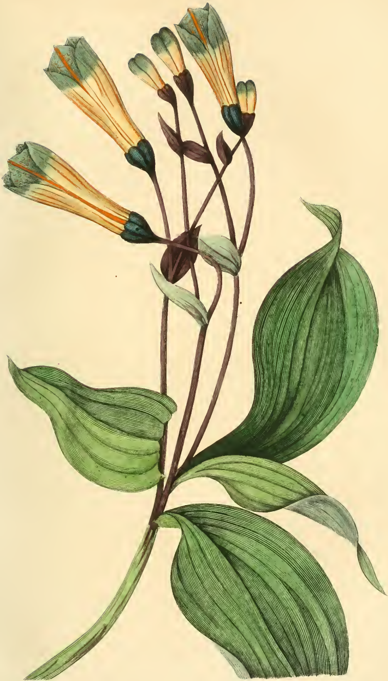
PÉLEGRINE À FEUILLES OVALES