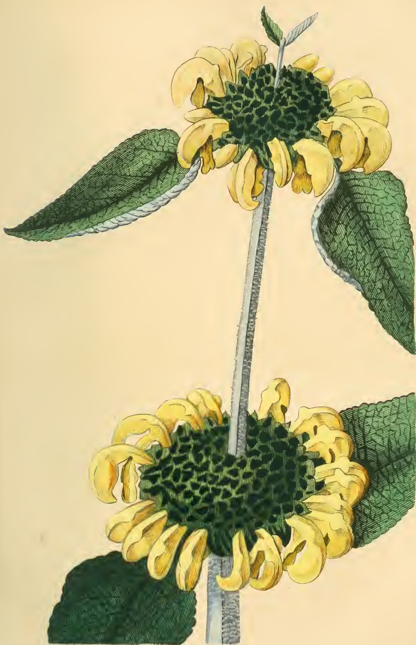
PHLOMIDE DE SAMOS