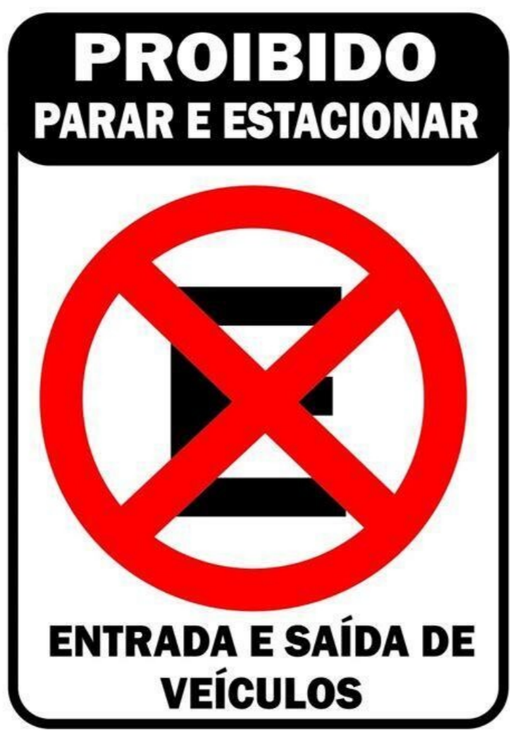
Prohibido estacionar y parar señal. En un cambio de rasante ¿está prohibido parar y estacionar. Línea amarilla prohibido parar y estacionar.