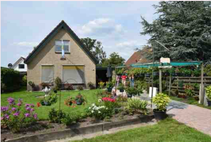
Tuin mevrouw Diever in Ter Idzard