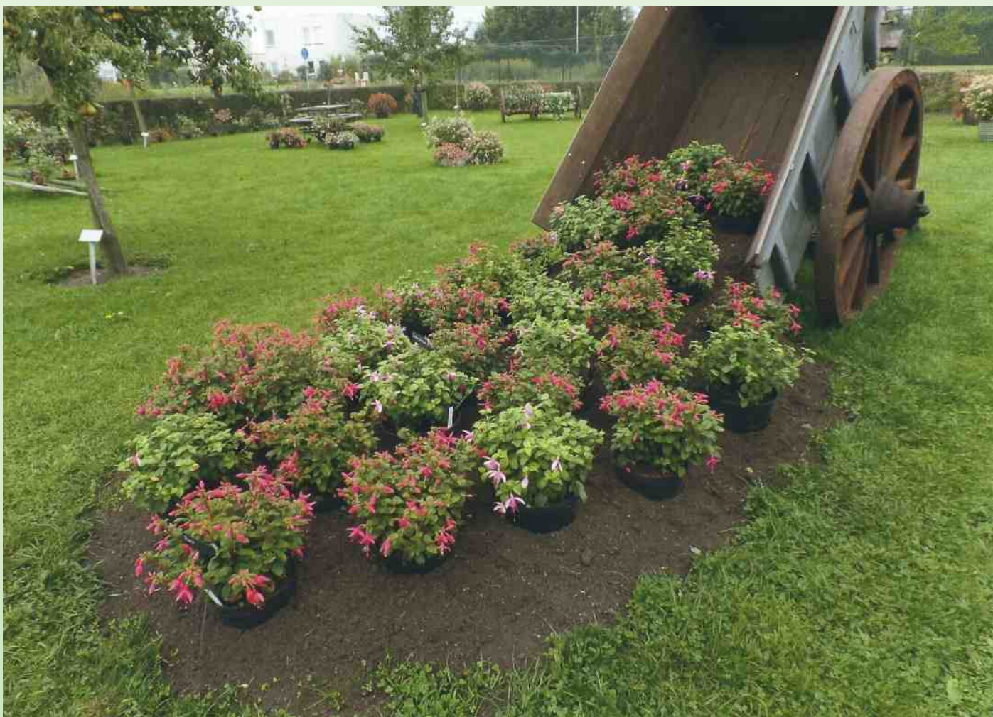
De winnende foto van de heer Hop