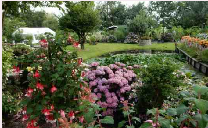
Tuin fam. Verschoor in Leerbroek