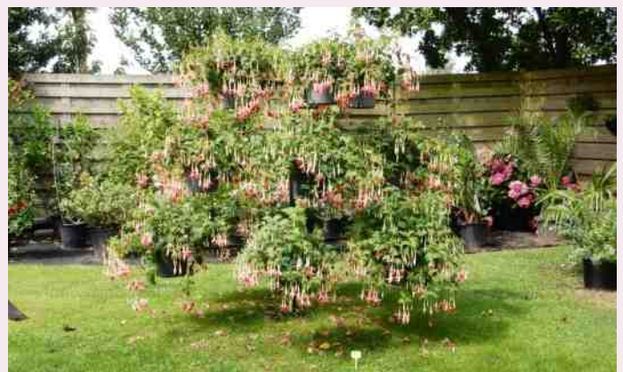
Tuin fam. Verschoor in Leerbroek