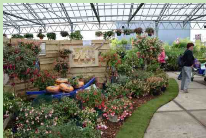
Plant geschenken aan de directeur van tuincentrum Ranzijn te Alkmaar