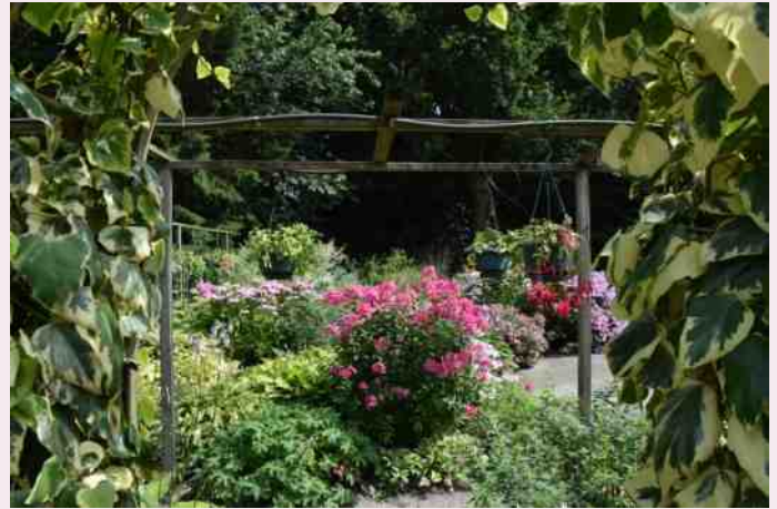
Tuin fam. Klijnstra in Oranjewoud