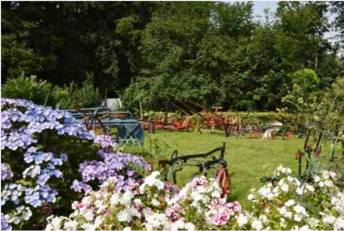
Tuin fam. Klijnstra in Oranjewoud