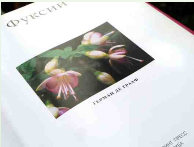
De Russische vertaling van mijn boek "Fuchsia's".