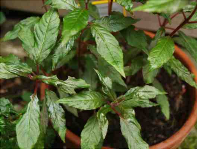
F. vargasiana (blad)