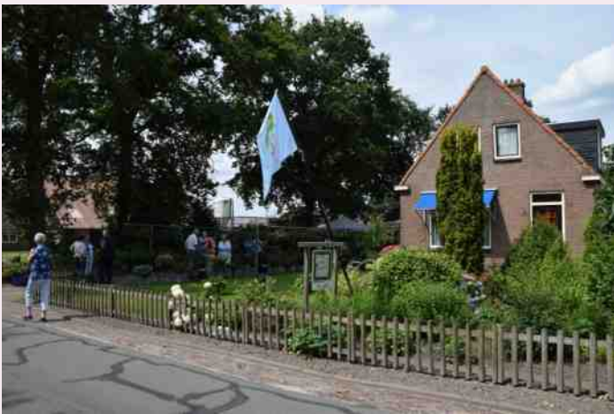
Tuin fam. Woudstra in Ter Idzard