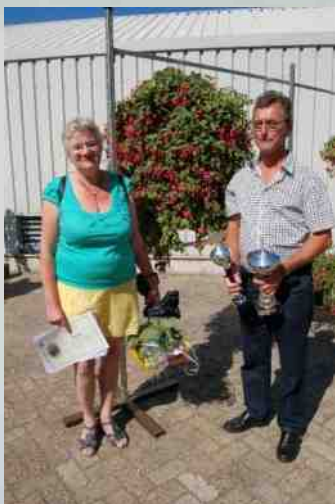
De heer en mevrouw Stals