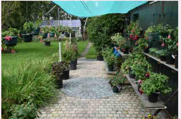
Tuin mevrouw Diever in Ter Idzard