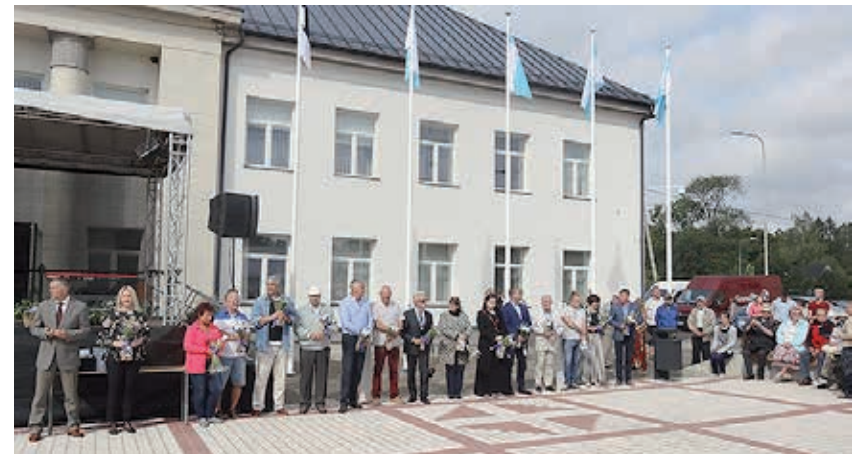
Tänusõnad tegijatele: mõtte algatajatele ja selle elluviijatele.

Väekatsumisel selgitati välja sitkeimad ühe käega kangil rippujad. Pari-