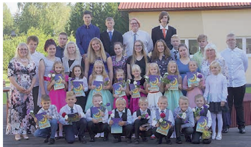
Rakke kooli 1. ja 9. klassi õpilased koos klassijuhatajatega.