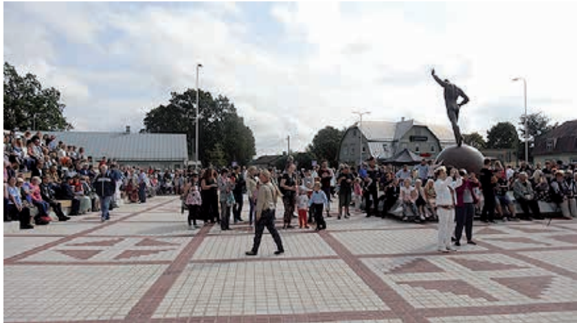
Avamispäev tõi kokku rohkesti rahvast.

Väike-Maarja avaliku ruumi väljarendamine sai teoks tänu Ettevõtluse Arendamise Sihtasutuse (EAS) Euroopa Regionaalarengu Fondi toetusele (piirkondade konkurentsivõime tugevdamise toetusmeede). Töid teostas YIT Eesti AS. Tööde kogumaksumus oli li-