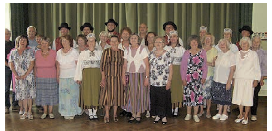
Meenutus 18. augusti tantsupäevast.