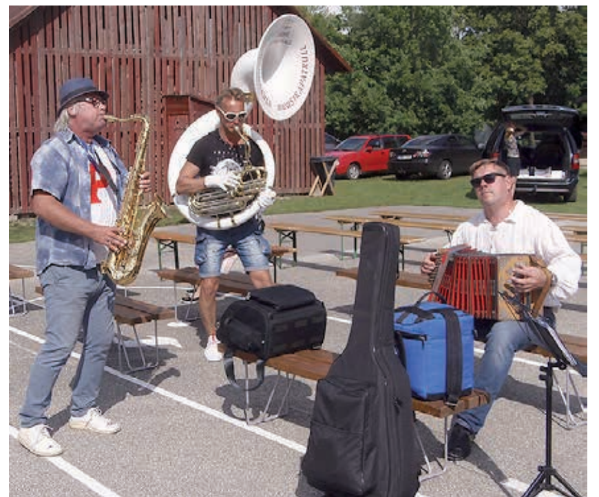
Moosekandid mänguhoos.