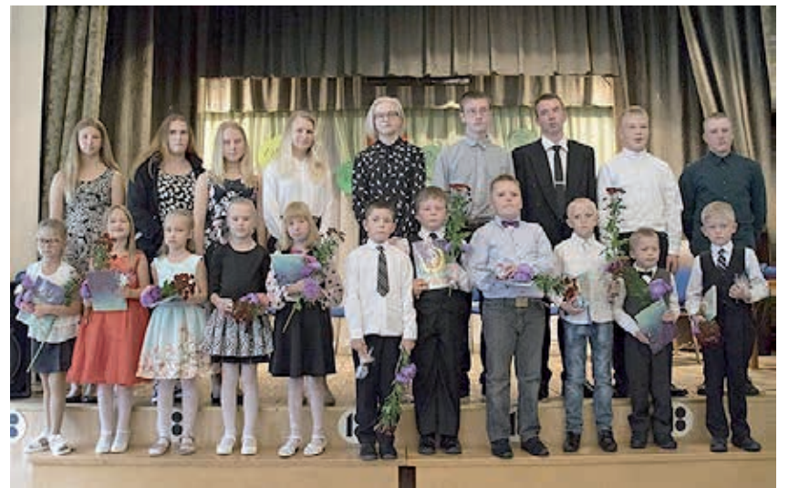
Simuna kooli 1. ja 9. klassi õpilased.