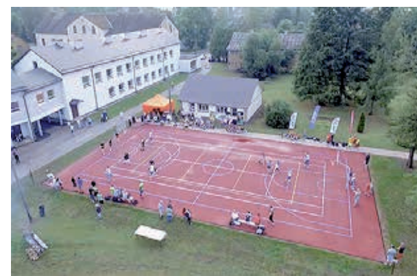
Simuna multifunktsionaalne pallimänguväljak.

Palliplatsi ehitustööd tegi OÜ Kivipartner. Tööde maksumus oli ligi 45 000 eurot, PRIA Leader-programmi toetus sellest oli 20 000 eurot.