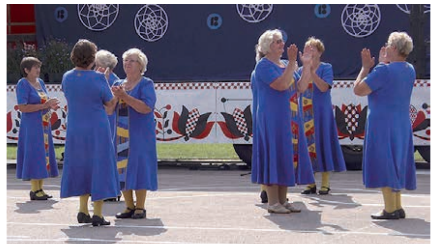
Esineb eakate tantsurühm Kadakane.