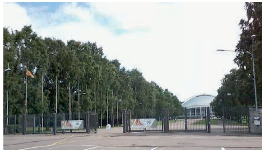
Päikeselipp Tallinna Mereväravate ees.