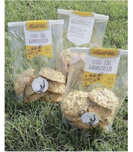
Luuri-Jüri rammupätsid.

Nii ühendabki Väike-Maarjast pärit maailmakuulsale rammumehele Georg Lurichile pühendatud jõuduandev amps endas vanaema kaerahelbepätsi ja moodsa aja energiabatooni. Kaarli talu värskeltsvaltsitud täistera-kaerahelvestele lisavad maitset kuivatatud jõhvikad ja purustatud metsapähklid – annid, mida ka Lurich ise kodukandi loodusest korjata võis. Kohevaks klopitud munad muudavad küpsise mõnusalt pehmeks ja biskviitjaks, taluvõi suussulavaks.