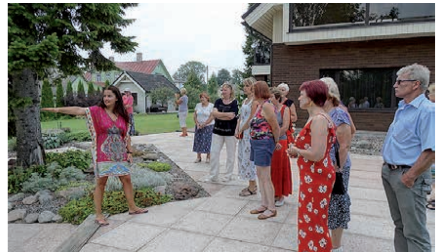
Noor perenaine tutvustamas oma kaunist koduaeda Rakveres Viru tänaval.