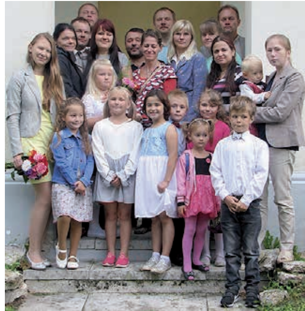
Kiltsi põhikooli 1. klassi õpilased koos klassijuhataja ja lapsevanematega.