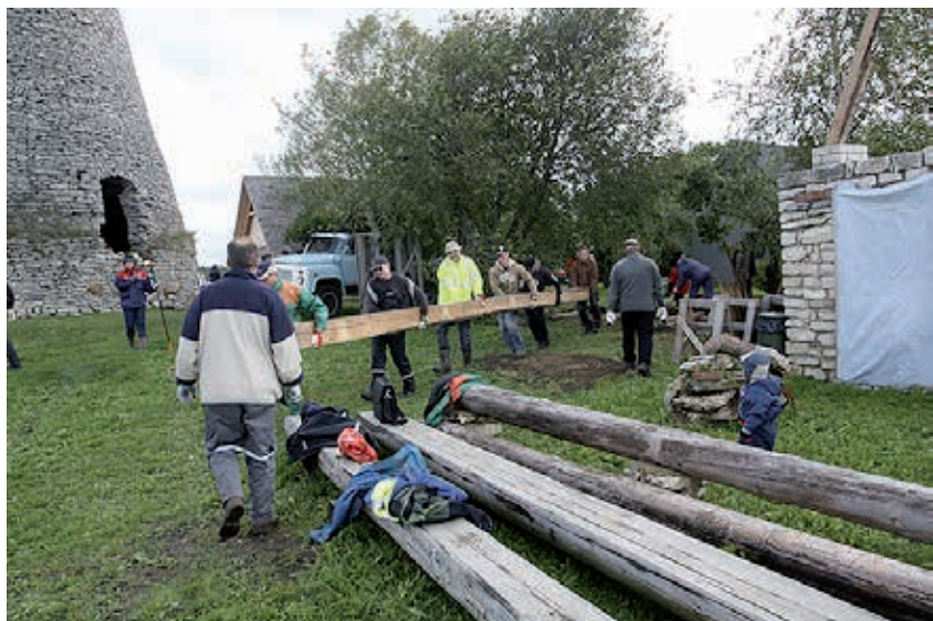
Eesti Geodeetide Ühingu poolt 2010. aastal Võiveres korraldatud talgupäeval punkti tähistamiseks vajalike eeltööde tegemiseks sündis mõte hakata korraldama augustikuu viimasel laupäeval baasjoone otspunktide vahelist matka.

pisutki rohkem võimalik kogeda ja teada saada, kui ainult see, mis hetkel on kättesaadav. Seepärast on tänuväärset, kõik ettevõtmised, mis aitavad lahti seletada enam kui kaheksa aasta vanust ettevõtmist.