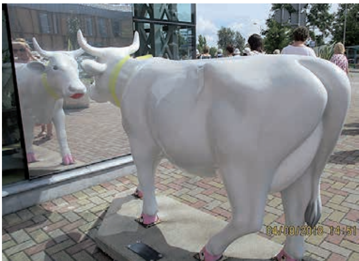
2002. aastast peale tuntakse Ventspils lehmade linnana. Üks paljudest linna lehmaskulptuuridest.

Päev lõppes hotelli jõudmisega 19.45. Hotell (äriklass) Ventspils „Vilnis“ paikneb Venta jõe paremal kaldal. Suur sadamalinna jäävaba sadamaga paikneb põhiliselt jõe vasakul kaldal. Sel õhtul, peale tubadesse jõudmise ja külma dušši, enam midagi ette ei võetud. Järgmine päev töötas olla väga tige oma lillevaipade-kujundite festivaliga. Kuuma õhu eest niiske vannilinnaga kaetuna tuli unigi. Muidu mugavas hotellis puudus konditsioneer.