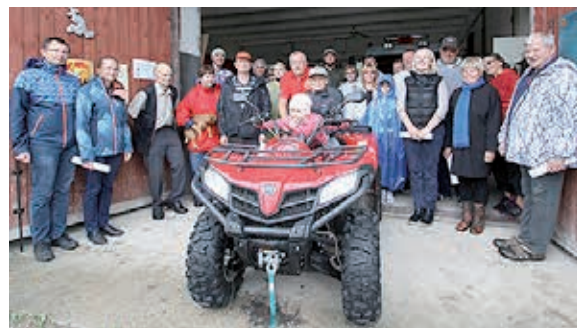
Maastikusõiduki näol sai Simuna kogukond vajaliku kingituse.

25. augustil toimus kingituse ülevõttekogukonnale. Avasime ka kin-