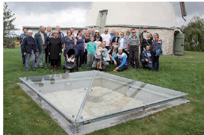
2018. aasta matkapäeval osalejad Võivere punkti juures.

Temaatiliste haridusprogrammide korraldamine on üks osa ühisprojekti „Struve kaar – kohaliku kultuuripärandi ühendaja“ tegevustest. Projekti rahastavad EL Leader-programm, Väike-Maarja vallavalitsus ja mittetulundusühing Võivere Tuuleveski.