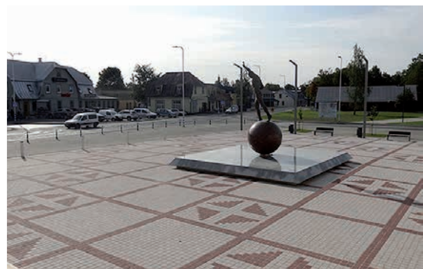
Väike-Maarja keskväljakult avaneb nüüd avar vaade.