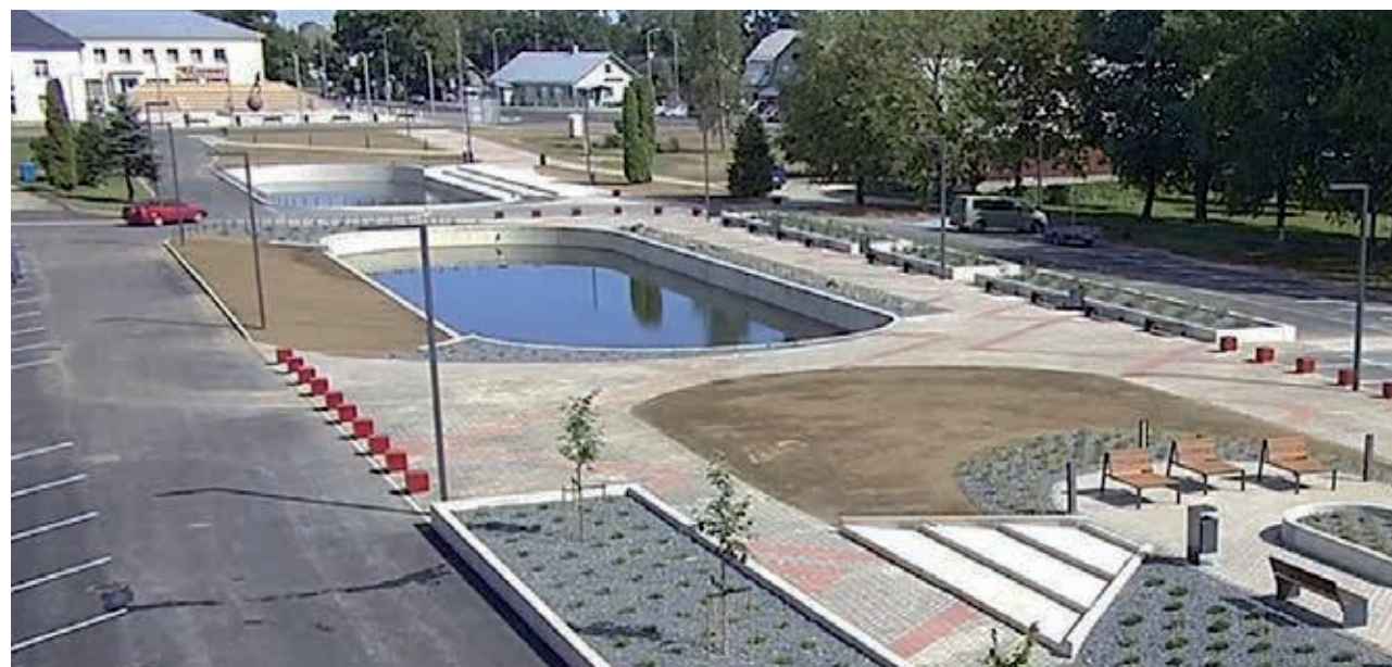
Uuenenud Väike-Maarja keskosk.