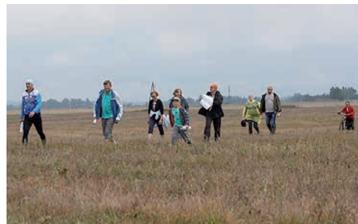
Tänavune matkateekond kulges osaliselt mööda baasjoont. Orienteerimisel oli matkalistele abiks matka eel valminud rohke teabega varustatud baasjoone kaart.

puhul trükis välja anti, tuleb anda kiriku arhiivi mälestusena siin lõpule viidud tähtsast ja huvitavast tööst.”