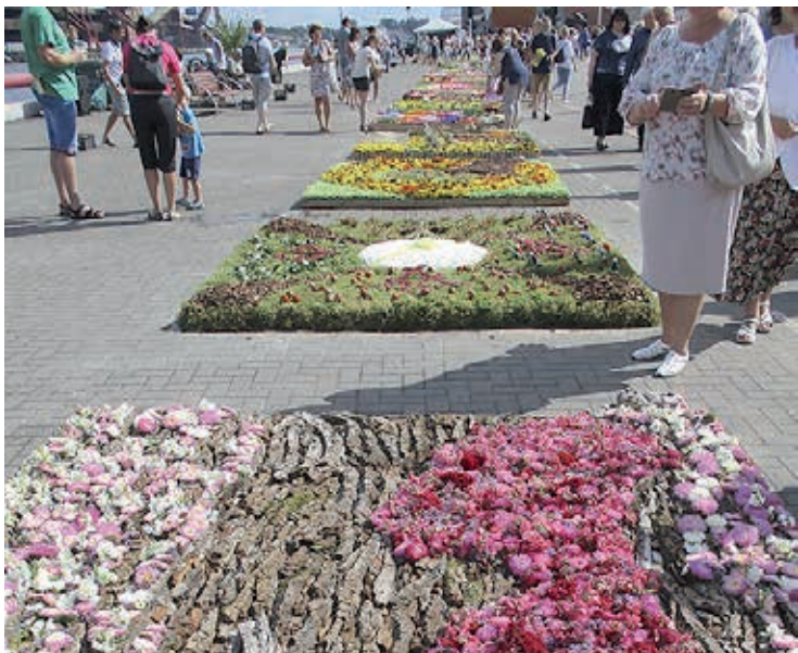
Ventspils festivalil: mitukümmend lillevaipa reas.