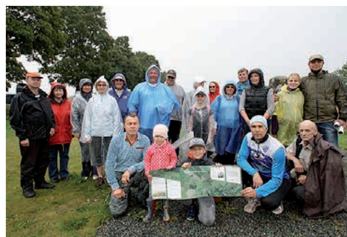
Ühispilt enne matka algust Simuna-Võivere baasjoone alguspunktis.

Mittetulundusühingu Võivere Tuuleveski eestvedaja ja matka korraldaja