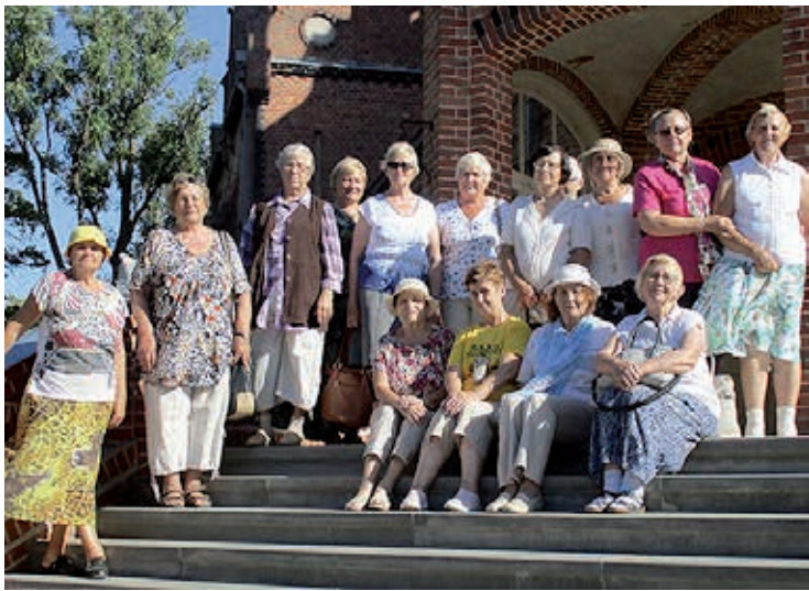
Reisiseltskond Jaunmokase lossi trepil.

Edasi suund Jaunmokase lossi poole. Üllrikaliku kujundusega punastest tellistest muinasjutuloss valmis 1901. aastal. Pilku püüdis vestibüülis säilinud maalitud glasuurkividega ahi, millel on kujutatud sajanditaguse Riia ja Jurmala vaateid.