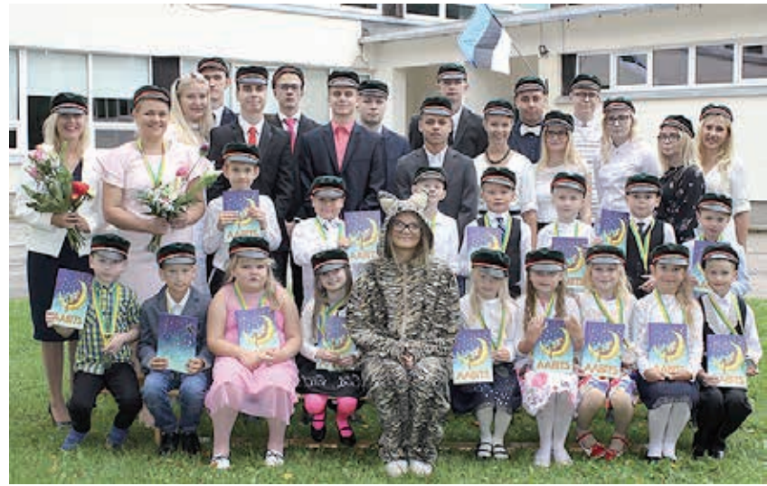
Väike-Maarja gümnaasiumi 1. ja 12. klassi õpilased koos klassijuhatajatega.