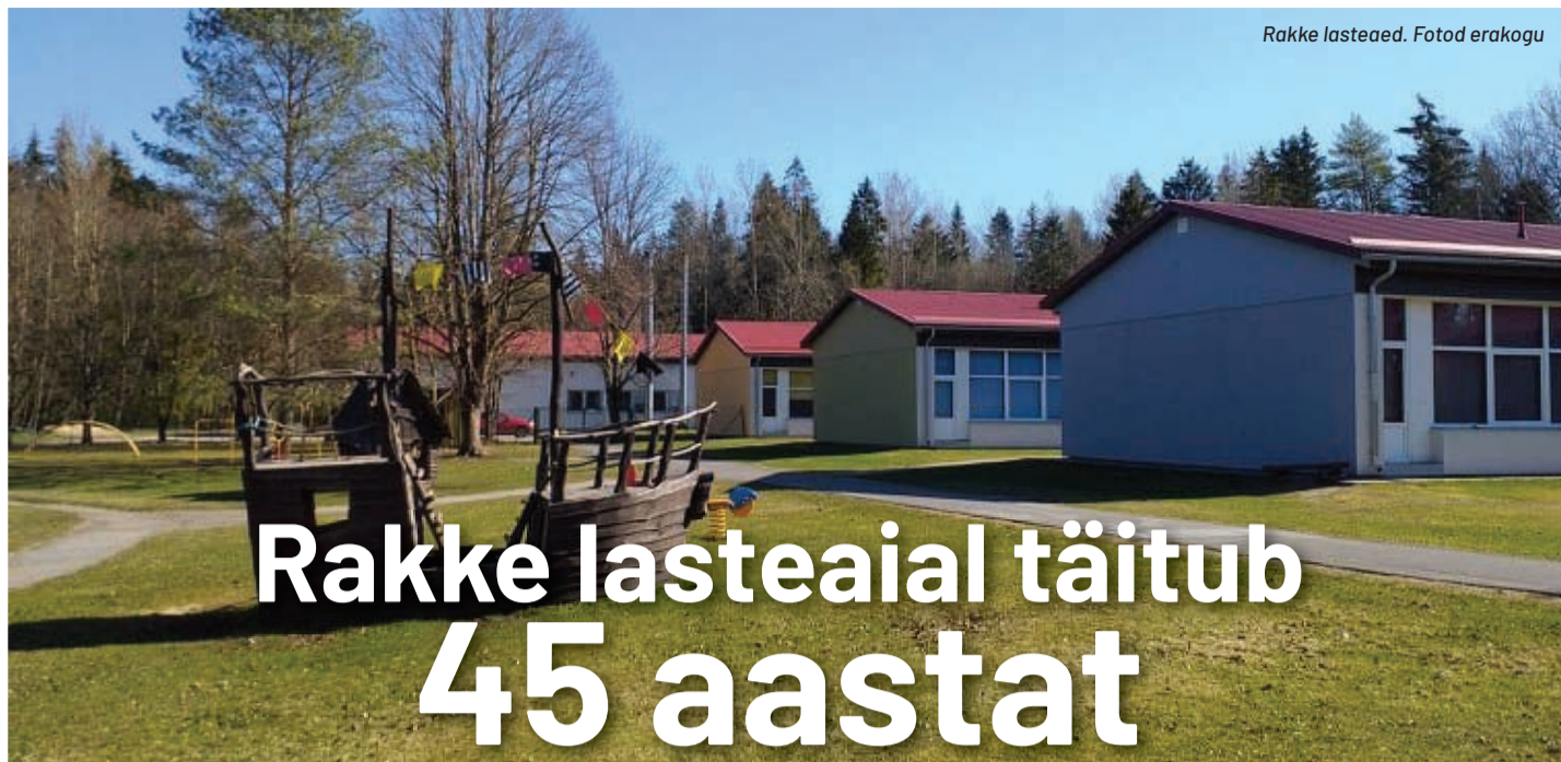
Rakke lasteaed.