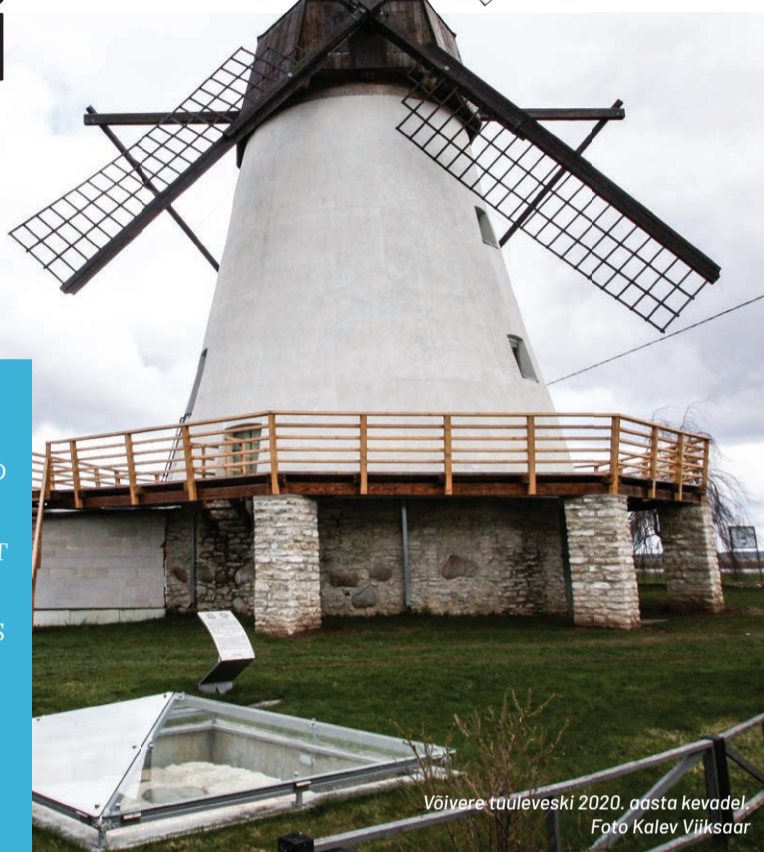
Võivere tuuleveski 2020. aasta kevadel.

VÕIVERE TUULEVESKI AVAB UKSED ALATES 12. JUUNIST JA ON SUVEPERIOODIL AVATUD REEDEST PÜHAPÄEVANI KELL 12-17, MUUL AJAL AINULT ETTETELLIMISEL. VESKI KOLMEL KORRUSEL ASUV NÄITUS PAKUB TEGEVUST NII VÄIKESTELE KUI KA SUURTELE. LISAKS ENESEHARIMISELE PAKUB VÕIVERE TUULIK TEMAATILISE INTERJÖÖRIS SEMINARIRUUMI KUNI 12-LIIKMELISELE SELTSKONNALE.