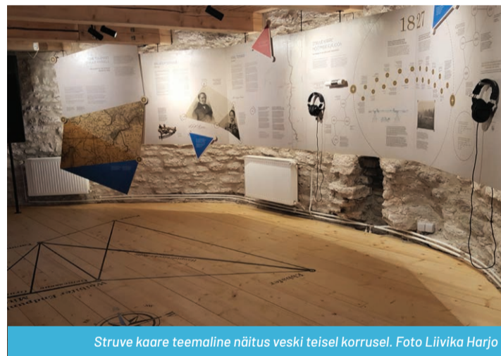
Struve kaare teemaline näitus veski teisel korrusel.

Aitäh kõigile, kes on panustanud Võivere tuuliku rekonstrueerimise ja näituse loomisele! Selleaastane eriolukord ei võimalda korraldada meil tänuüritust, seepärast peame ootama paremaid aegu, et teie kõigiga koos veeta üks tore päev ja rõõmustada koosloodu üle.