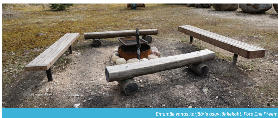
Emumäe vanas karjääris asuv lõkkekoht.