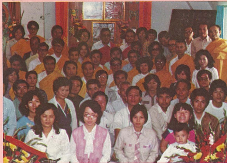
金剛乘學會台中佛堂新遷開光合影