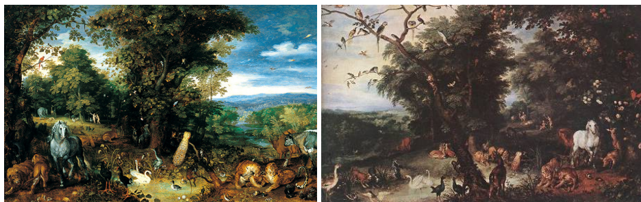
To fremstillinger af syndefaldet i Edens biodiverse have af Jan Brueghel den ældre fra 1610-12. Til venstre hedder Edens have (Galleria Doria-Pamphili, Rome), til højre Adam og Eva i Edens have (Royal Collection, Windsor).

(kapitel 8). Menneskene bliver således selv de afgørende skabere og fortolkere. Fortæringen af kundskabens æble giver mulighed for selv at skelne. Det selvudviklende arbejde i vildniset overvinder umyndiggørelsen. Afprøvningen af grænserne for det gode og rette ender i både syndflod og frihedspagt. Gud udnævnte menneskene til herskere. Da dyrearterne var kommet velbeholdne ud af arken, kunne menneskene gøre med dem, hvad de ville. Noa og hans sønner blev instrueret om at blive frugtbare og sprede sig ud over jorden, og tilmed om at få andre dyr til at skælve. Overfor en jord, som Gud selv forbandede, synes der ikke megen grund til at holde sig tilbage. På den anden side kan mennesket netop ikke længere blindt tage mod ordre. Før syndefaldet levede Adam og Eva i lykkelig uskyld og gjorde som Gud ville. Efter syndefaldet bliver det en selvstændig opgave at leve op til dette at være skabt i Guds billede – eller slet og ret at være menneske. Med Rousseau kan vi sige, at de tabte uskylden for i stedet at måtte kæmpe for dyden.