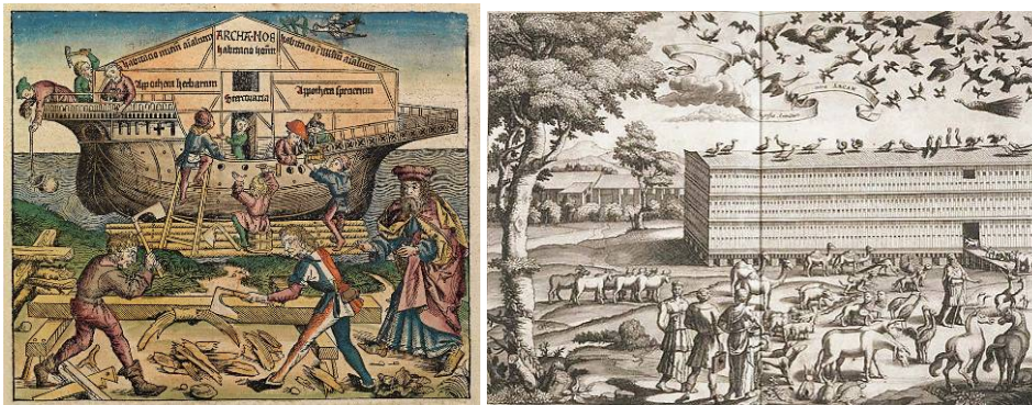
Til venstre Noas Ark under udarbejdelse i Hartmann Schedels Liber Chronicarum fra 1493. Til højre jesuitterpræsten Athanasius Kirchers Arc Noë fra 1675. Kirchers bog var en af de sidste, der søgte at forsvare fortællingen om Noa som en realistisk historie.

var det alene som føde. Resten måtte klare sig som de bedst kunne. Da syndflo- den var ovre, indgik Gud en pagt om aldrig mere at udrydde dyr og mennesker. Han tillod menneskene at spise kød og sprede frygt og rædsel blandt dyrene. Gør alt hvad I vil, lød det generøse tilbud, jeg skal ikke længere blande mig.