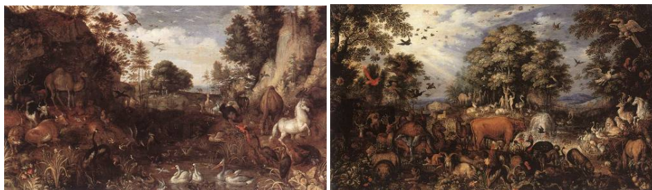
Paradisets have i to biologisk mangfoldige udgaver af den flamske kunstner Roelant Savery fra 1620'erne. Til venstre Edens have (Koninklijk Museum voor Schone Kunsten, Antwerp). Til højre Paradiset (Staatliche Museen, Berlin).

I begyndelsen skabte Gud himlen, jorden og havet. 11 I følge den første skabelsesberetning, samler-, jæger- og hyrdesamfundets version, kom planteverdenen til på andendagen, at (selvom lyset først fulgte på tredjedagen). På fjerdedagen begyndte skabelsen af dyreverdenen med havenes og luftens skabninger, der blev til “efter deres arter.” På femtedagen var det landdyrene tur, både de nyttige og tamme som kvæget, de skræmmende som krybet og alle de vildtlevende dyr. Samme dag skabte Gud menneskene i sit eget billede og satte dem til at herske over alle havets, luftens og jordens dyr. Menneskene tildeltes frugt og grøntsager til føde, mens de øvrige dyr tildeltes grønne urter. Efter hver skabelsesakt konstaterede Gud, at resultatet var blevet godt.