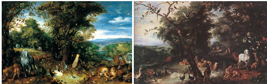
To fremstillinger af syndefaldet i Edens biodiverse have af Jan Brueghel den ældre fra 1610-12. Til venstre hedder Edens have (Galleria Doria-Pamphili, Rome), til højre Adam og Eva i Edens have (Royal Collection, Windsor).

(kapitel 8). Menneskene bliver således selv de afgørende skabere og fortolkere. Fortæringen af kundskabens æble giver mulighed for selv at skelne. Det selvudviklende arbejde i vildniset overvinder umyndiggørelsen. Afprøvningen af grænserne for det gode og rette ender i både syndflod og frihedspagt. Gud udnævnte menneskene til herskere. Da dyrearterne var kommet velbeholdne ud af arken, kunne menneskene gøre med dem, hvad de ville. Noa og hans sønner blev instrueret om at blive frugtbare og sprede sig ud over jorden, og tilmed om at få andre dyr til at skælve. Overfor en jord, som Gud selv forbandede, synes der ikke megen grund til at holde sig tilbage. På den anden side kan mennesket netop ikke længere blindt tage mod ordre. Før syndefaldet levede Adam og Eva i lykkelig uskyld og gjorde som Gud ville. Efter syndefaldet bliver det en selvstændig opgave at leve op til dette at være skabt i Guds billede – eller slet og ret at være menneske. Med Rousseau kan vi sige, at de tabte uskylden for i stedet at måtte kæmpe for dyden.