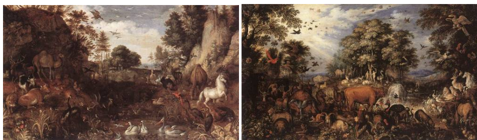
Paradisets have i to biologisk mangfoldige udgaver af den flamske kunstner Roelant Savery fra 1620'erne. Til venstre Edens have (Koninklijk Museum voor Schone Kunsten, Antwerp). Til højre Paradiset (Staatliche Museen, Berlin).

I begyndelsen skabte Gud himlen, jorden og havet. 11 I følge den første skabelsesberetning, samler-, jæger- og hyrdesamfundets version, kom planteverdenen til på andendagen, at (selvom lyset først fulgte på tredjedagen). På fjerdedagen begyndte skabelsen af dyreverdenen med havenes og luftens skabninger, der blev til “efter deres arter.” På femtedagen var det landdyrene tur, både de nyttige og tamme som kvæget, de skræmmende som krybet og alle de vildtlevende dyr. Samme dag skabte Gud menneskene i sit eget billede og satte dem til at herske over alle havets, luftens og jordens dyr. Menneskene tildeltes frugt og grøntsager til føde, mens de øvrige dyr tildeltes grønne urter. Efter hver skabelsesakt konstaterede Gud, at resultatet var blevet godt.