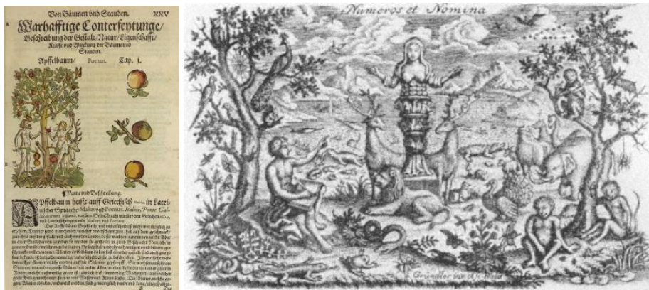
Til venstre opslaget om æbletræet i Adam Lonicers Kreuterbuch fra 1582. Til højre Linné fremstillet som ”den anden Adam,” der navngiver og nummererer i en tysk version fra 1760 af den tiende udgave af Systema Naturae .