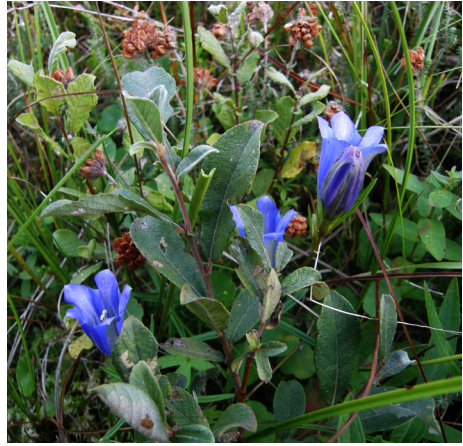
Klockgentiana Gentiana pneumonanthe i ett danskt dike

Jag hade hoppats få se klockgentiana här, i en något annorlunda miljö än där man ser den i Västsverige, men den lyste med sin frånvaro. Det gjorde inget, jag fotograferade heden i dess många olika former, skepnader och färger och tiden gick fort. På tillbakavägen till bilen såg jag så något lysande lilablått i ett dike. Klockgentiana! Det var två, tre exemplar som växte i dikets botten. Jag lade mig i diket för att få några närbilder. Efter ett tag hörde jag vad jag bedömde som ett stort fordon bromsa in och stanna på vägen