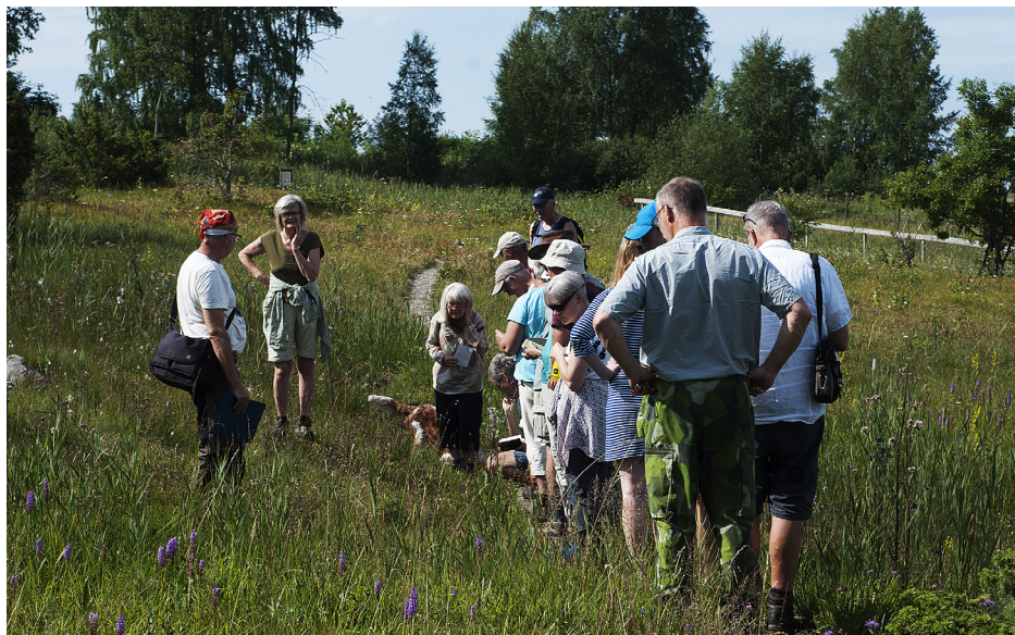
Exkursionsdeltagare i Skogatorpskärret sommaren 2016

Trolltjärn 18, 436 40 Askim, aimon@bahnhof.se