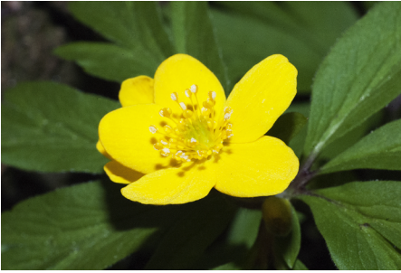
Gulsippa Anemone ranunculoides

Letar man lite bland löven hittar man ofta vätteros Lathraea squamaria som pollineras av årets första humlor Bombus sp. eller ibland till och med självbefruktar sig under jord! Det släktnamn Linné gav arten syftar på dess hemlighetsfulla liv. Här finns gulsippa Anemone ranunculoides som har sin naturliga nordgräns på västkusten i Göteborgstrakten och där den åtminstone i Årekärnsdalen får anses helt säkert ursprunglig. Här finns även tandrot Cardamine bulbifera med sina svarta groddknoppar. Letar man kan man ofta hitta skogsskräppa Rumex sanguineus med fjolårsfrön kvar med sin enda ”nöt”. Vårärten Lathyrus vernus är nog även den möjliga ursprunglig. Almen Ulmus glabra är ursprunglig liksom den av skalbaggar spridda svampen Ophiostoma ulmi , som ger upphov till almsjuka och gett upphov till ett flertal döda almar. Dessa har ofta svarta rhizomorfer som slingrar sig upp längs stammarna och som syns när barken lossnar. Det är honungskivlingens Armillaria mellea s.lat. sätt att ha kontakt med almarna. På bar ved hittar man ofta olika kärnsvampar exempelvis Hypoxylon spp. och en del tickor.