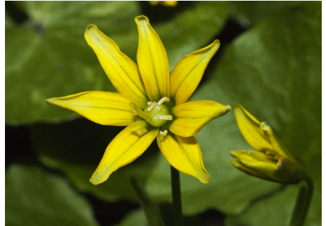
Lundvårlök Gagea spathacea

Den allra finaste tiden att besöka Vitsippsdalen är på våren vid tiden för vitsippornas blomning. Här finns dock mycket annat att se, dofta, höra och upptäcka på annat sätt under årets alla årstider. Dock bör man inte uppehålla sig i skogen vid stark vind, på grund av risken för nedfallande träd och grenar. Ett bra sätt att bekanta sig med dalen är att gå genom grinden vid den nordvästra delen av den gula prefektvillans stora trädgård (Vårstigen), stanna till där innan