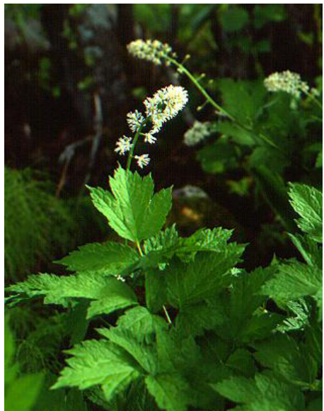
Svart trolldruva Actaea spicata

Nu väntar vi på vårens snara ankomst och den första vårfloran som är lika spännande att möta varje år. Kom ihåg att anteckna när de första arterna blir synliga för att kunna rapportera dem.