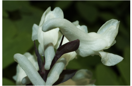
Hålnunneört Corydalis cava

Men här i nedre delen av dalen finns också ett flertal växter som kommit ut från