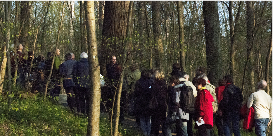
Man kan få se många trevliga växter under en vårpromenad