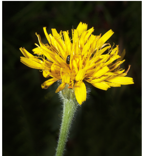
Sommarfibbla Leontodon hispidus

Ytterligare tre obligata kalkkrävande växter var den lilla ”knäböjarväxten” vildlin Linum catharticum med sina vita