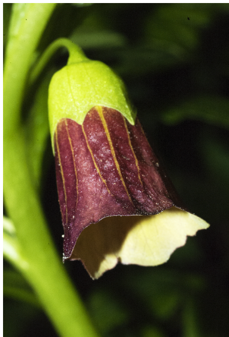
Dårört Scopolia carniolica

Möjligen börjar det redan skymma om du går här på kvällen och kanske bara rödhakens Erithacus rubecula frenetiska