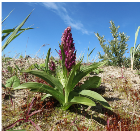
Strandnycklar Dactylorhiza majalis ssp. purpurella på Uggerby strand

Den väldiga, vandrande dynen Råbjerg mile är en egenartad upplevelse och ligger nära huvudvägen norrut. Huvudvägen skär också genom flera hedar, till exempel