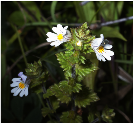
Stor ögontröst Euphrasia officinalis subsp. pratensis

Sedan började vi vandra ner mot den plana delen av kärret och såg då bockrot Pimpinella saxifraga (dock ej Bellmans pimpinella), backtimjan Thymus serpyllum och kärknipprot Epipactis palustris , den senare överblommad. En av de stora rariteterna, som vi fick se var stor ögontröst Euphrasia officinalis subsp. pratensis , med sina stora vita blommor och dessutom solvända Helianthemum nummularium i blom. Någon påstod sig ha sett ett överblommat flugblomster Ophrys insectifera , som jag missade då jag försökte kolla upp en sexfläckig bastardsvärmare