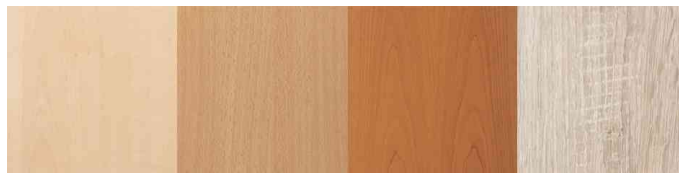
Farben: ahorn - buche - kirsche - wildeiche