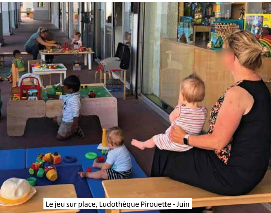
Le jeu sur place, Ludothèque Pirouette - Juin