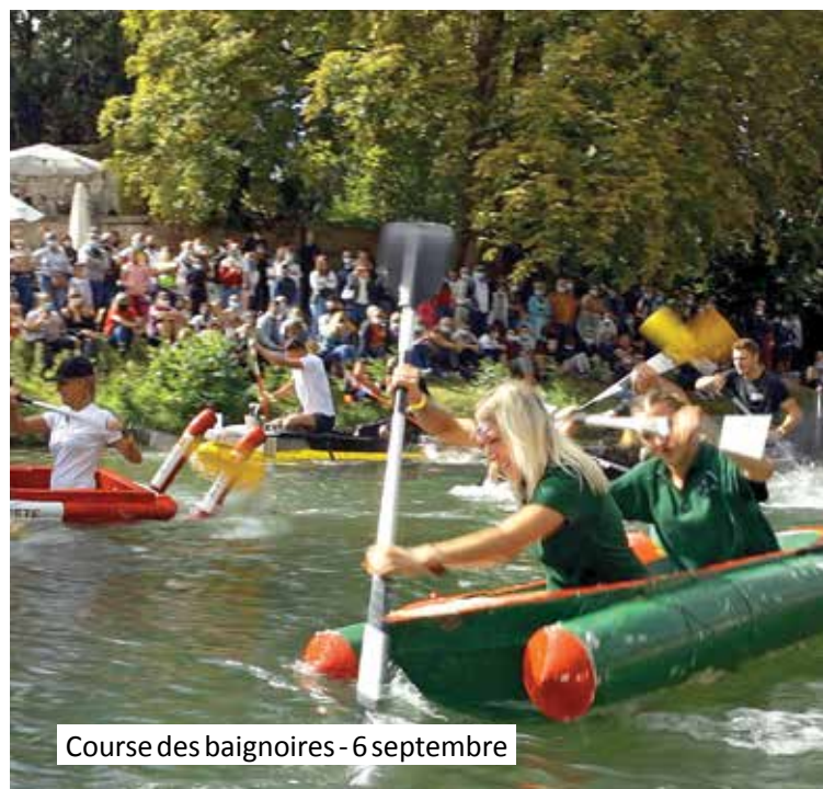
Course des baignoires - 6 septembre