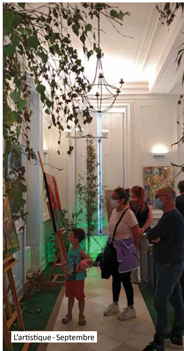
L'artistique - Septembre