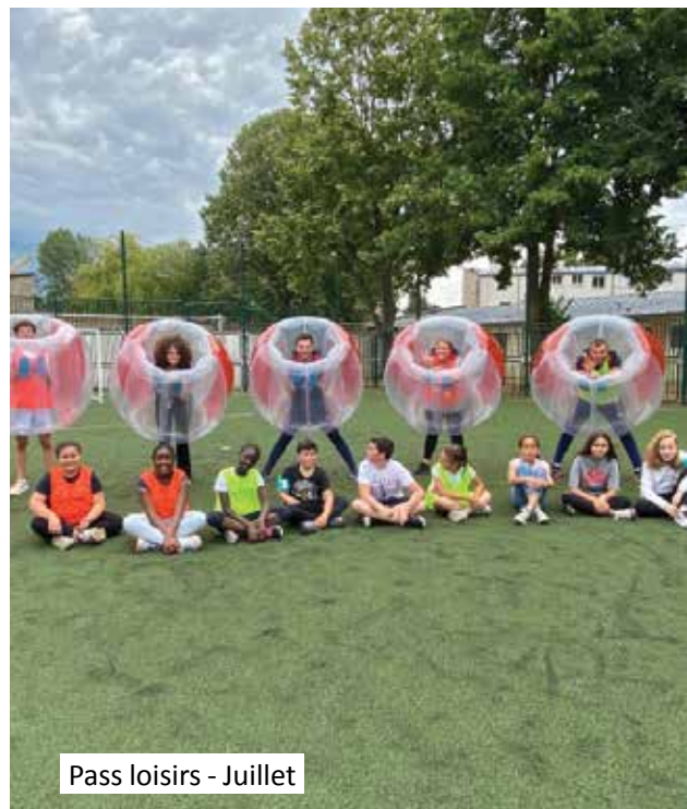
Pass loisirs - Juillet