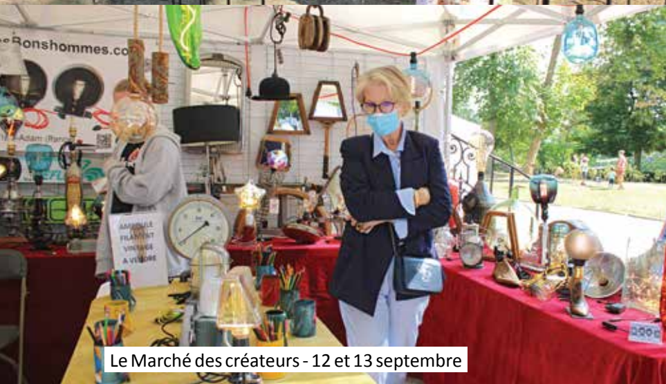
Le Marché des créateurs - 12 et 13 septembre