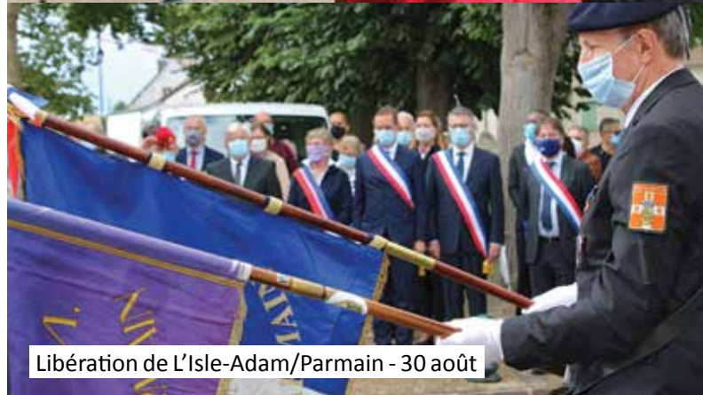
Libération de L'Isle-Adam/Parmain - 30 août