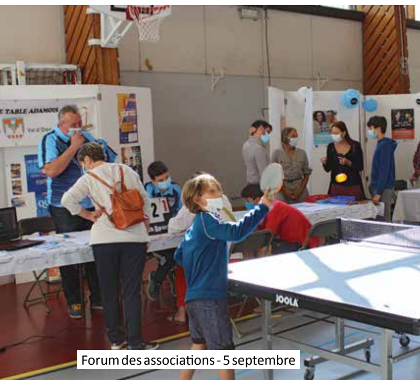
Forum des associations - 5 septembre