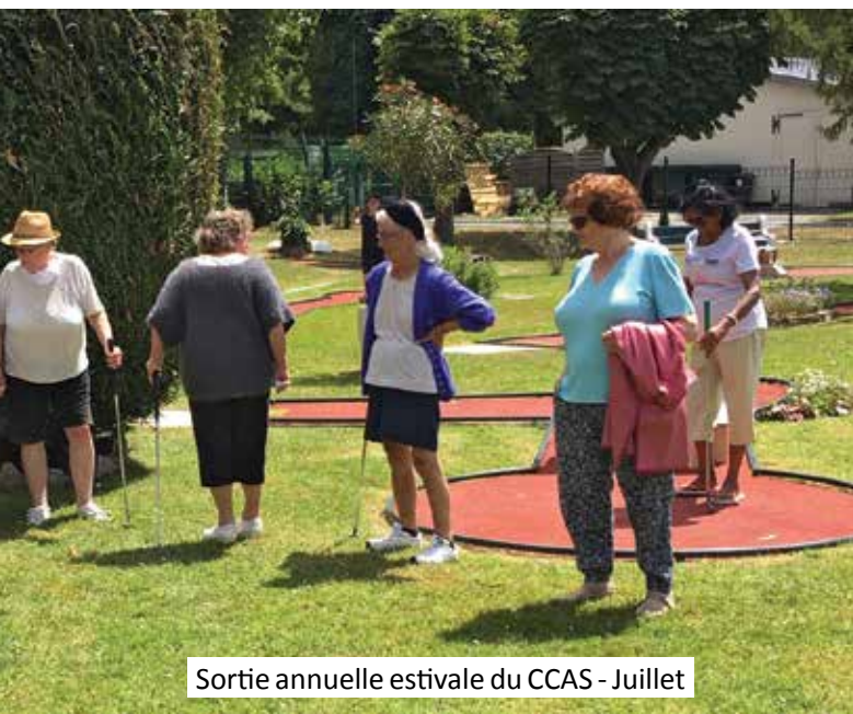
Sortie annuelle estivale du CCAS - Juillet