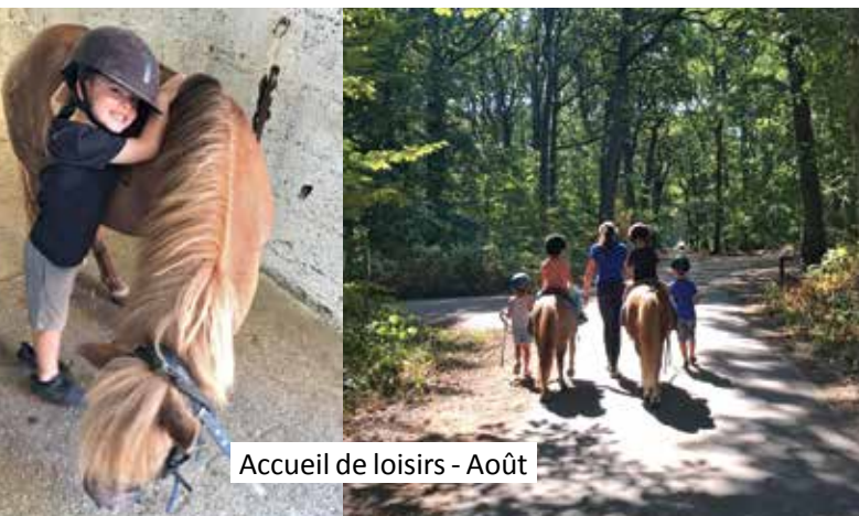
Accueil de loisirs - Août