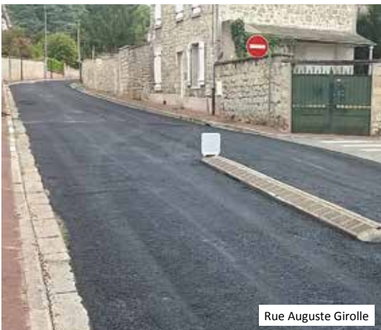
Rue Auguste Girolle