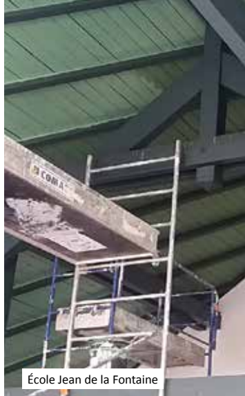
École Jean de la Fontaine