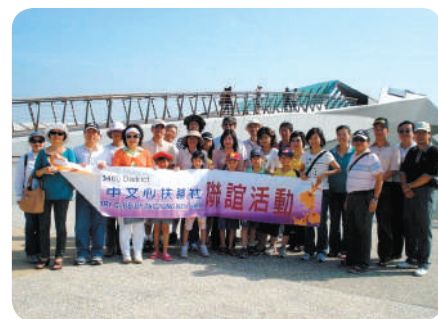
秋季旅遊—王功漁港聯誼郊遊