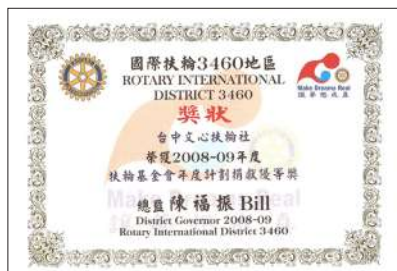
2008-09年度-年度計畫捐獻優等獎