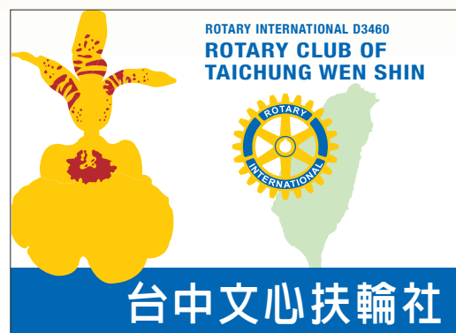
文心社社徽 The LOGO of Wen Shin Rotary

文心扶輪社以文心蘭作為社徽圖騰。文心蘭是常見的洋蘭之一，由於它的花形看起來猶如舞台上婆娑起舞的女郎，所以歐美愛花人士將它命名為「跳舞女郎蘭」（Dancing Lady Orchid）。在歐美各國，文心蘭風頭十足，每當有新品種育出時，就如同我國的藝蘭、蝴蝶蘭那般的令人瘋狂！