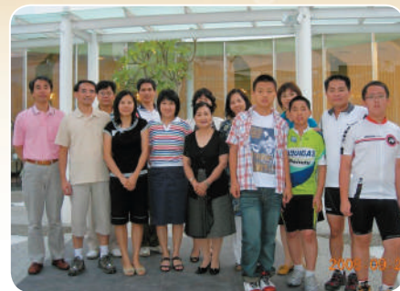
第一季家庭懇談會