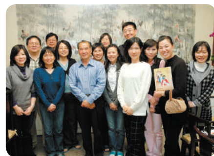
寶眷聯誼活動—南投藝文之旅