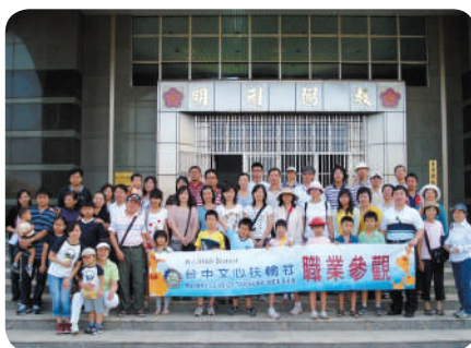
關懷受刑人—彰化監獄