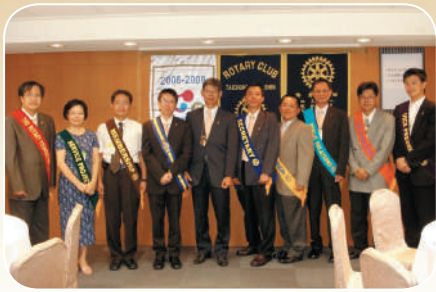
社長暨職員交接例會