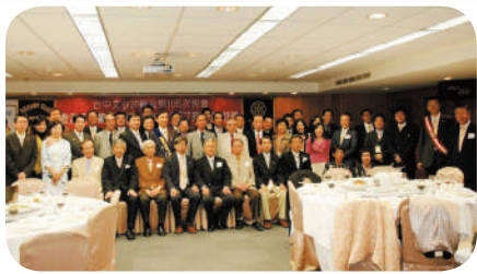
日本東久留米扶輪社來訪