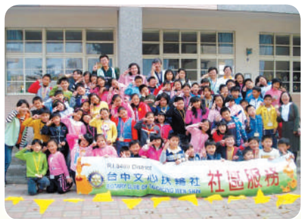
關懷弱勢兒童服務計畫—美麗心視界活動