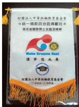
中華扶輪百分百捐獻社