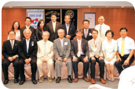
日本友好社—豐田中扶輪社來訪