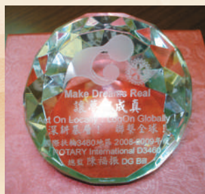
2008-09年度社區服務傑出獎