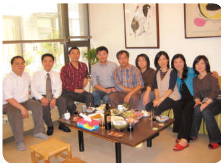
第三季家庭懇談會