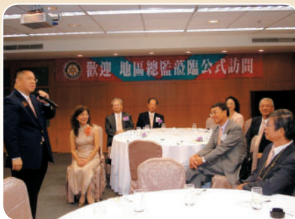
地區總監公式訪問