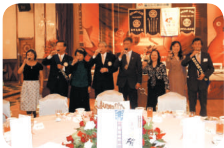
與台中社聯合舉辦忘年會