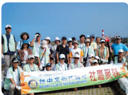
地球清潔日社區服務—高美溼地淨灘活動