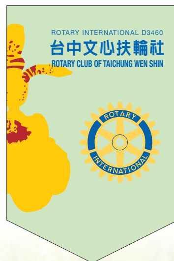
文心社社旗 The Flag of Wen Shin Rotary

文心扶輪社以文心蘭作為社徽圖騰。文心蘭是常見的洋蘭之一，由於它的花形看起來猶如舞台上婆娑起舞的女郎，所以歐美愛花人士將它命名為「跳舞女郎蘭」（Dancing Lady Orchid）。在歐美各國，文心蘭風頭十足，每當有新品種育出時，就如同我國的藝蘭、蝴蝶蘭那般的令人瘋狂！