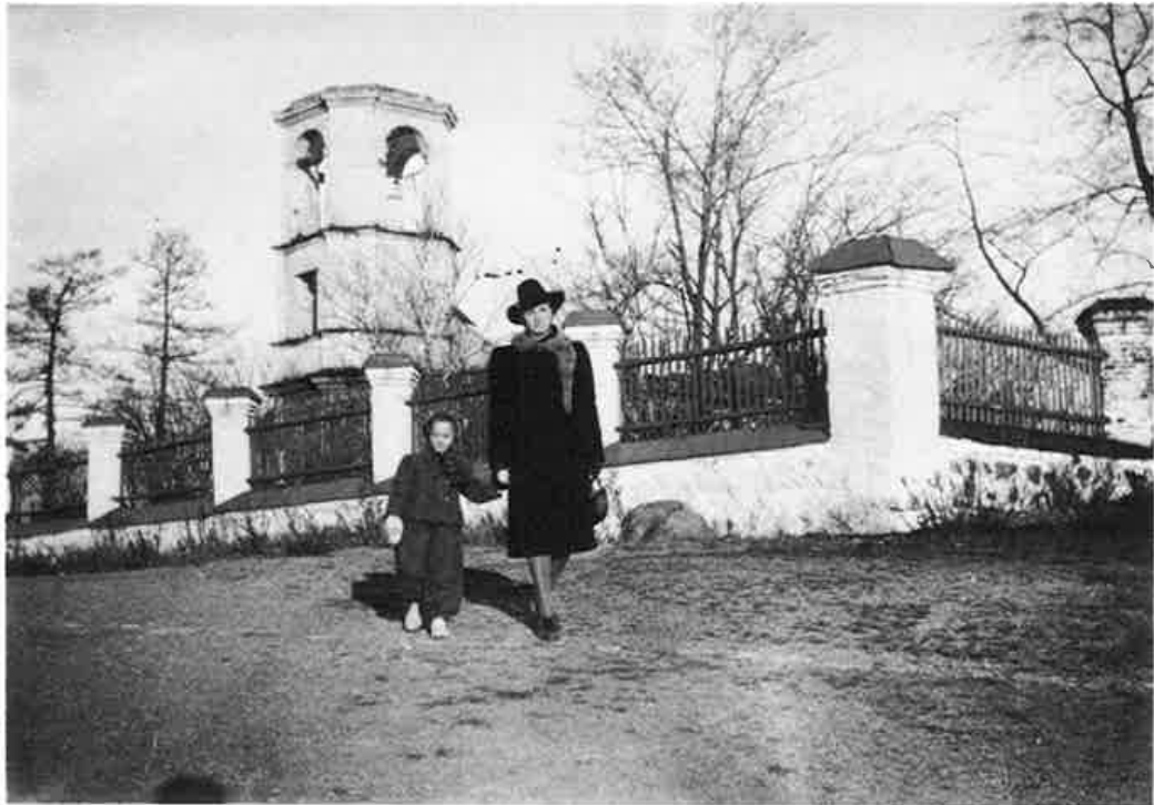
Eliaan kirkon rauniot.