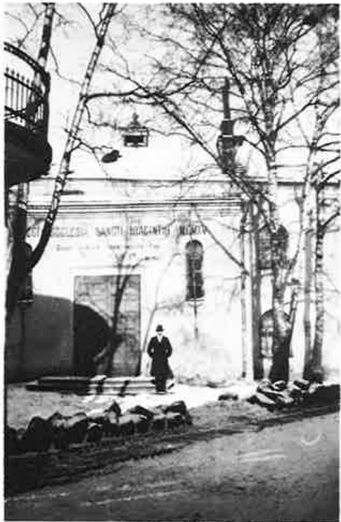
Pyhän Hyacintuksen kirkko Vesiportinkadun varressa. Valok. 1930 Erkki Eerikäinen.