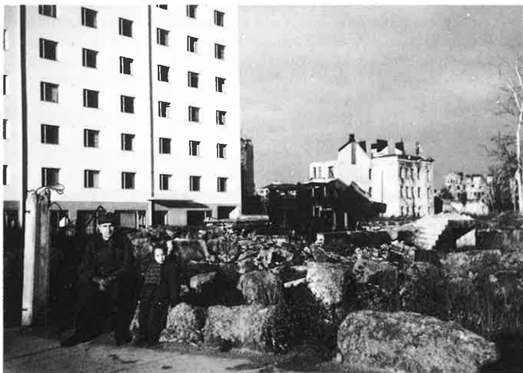
Sanomalehti Maakansan kirjapainon rauniot ja painokone. Vasemmalla korjattu As. Oy. Brahenlinnan talo.