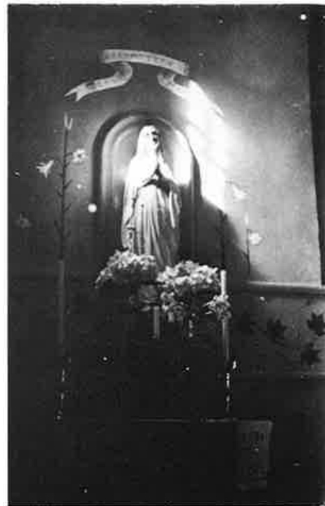
Pyhän Hyacintuksen kirkko sisältä. Valok. 1930 Erkki Eerikäinen.