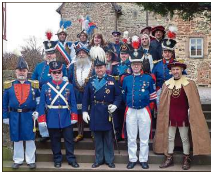
Zur Frühjahrstagung waren die Teilnehmer von weither angereist.