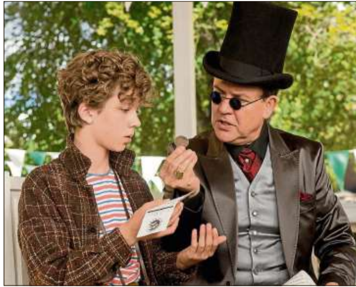
Andreas Dresen hat „Timm Thaler oder Das verkaufte Lachen“ fantasievoll für die Kinoleinwand adaptiert.

Famose Figuren, starke Situationskomik, funkelnde Dialoge – in Josef Haders herrlicher Tragikomödie „Wilde Maus“ stimmen nicht nur die Pointen, sondern auch alles andere. Nach dem Ausflug ins große Charakterfach mit „Vor der Morgenröte“ präsentiert der österreichische Kult-Kabarettist nun sein Regiedebüt – und landete prompt im Bären-Rennen der Berlinale. Nach eigenem Drehbuch spielt Hader darin einen tragikomischen Helden, der – wegen Sparmaßnahmen – seinen Job als Musikkritiker einer Wiener Zeitung verliert. Georg sinnt auf Rache an seinem Ex-Chef. Die nächtliche Sachbeschädigung beim verhassten Boss macht aber erst den Anfang, denn Georg weitet seine Angriffe be-