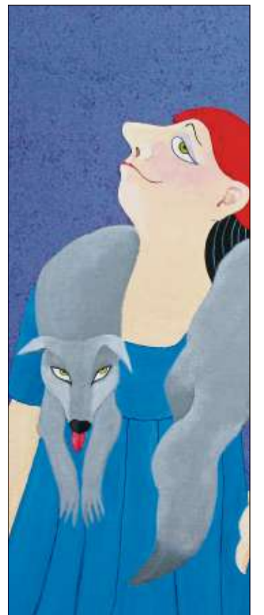
Den Wolf trägt Rotkäppchen stolz um den Hals.