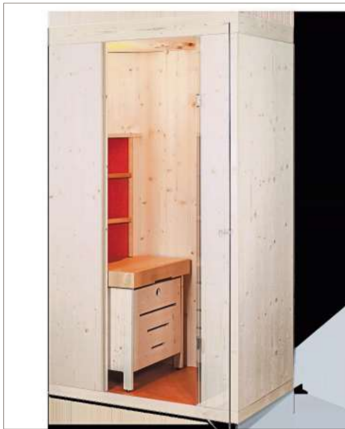
Die HYDROSOFT® Private SPA Kabine ist eine revolutionäre Alternative zu heißen Saunen und trockenen Infrarotkabinen.