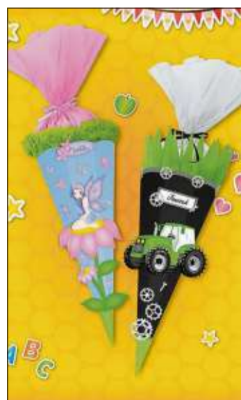
Eine Elfe oder ein Traktor – egal, welche Vorliebe das Kind hat – sie lässt sich auf der Schultüte verewigen.

Im Sortiment der Kreativwelt stehen dafür hochwertige Artikel der Firmen Pelikan, Faber Castell, Lamy und Kreul Künstlerfarben bereit. Und was wäre der 1. Schultag ohne die Vorfreude auf die eigene Schultüte? Das Team der Kreativwelt war schon fleißig und hat einige Modelle gebastelt, die auf der Aktionsbühne präsentiert werden. Da findet sicher je-