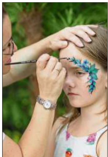
Auf den Gesichtern entstehen kreative Bemalungen.

gibt es Spiel- und Bastelspaß mit einem großen Bastelbuffet und seit vergangem Jahr auch ein Seifenblasenspaß-Modul, das für viele Veranstaltungen gemietet werden kann.