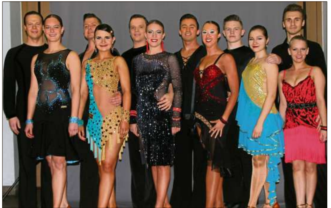
Die Turniertänzer der Hauptgruppe C Latein.