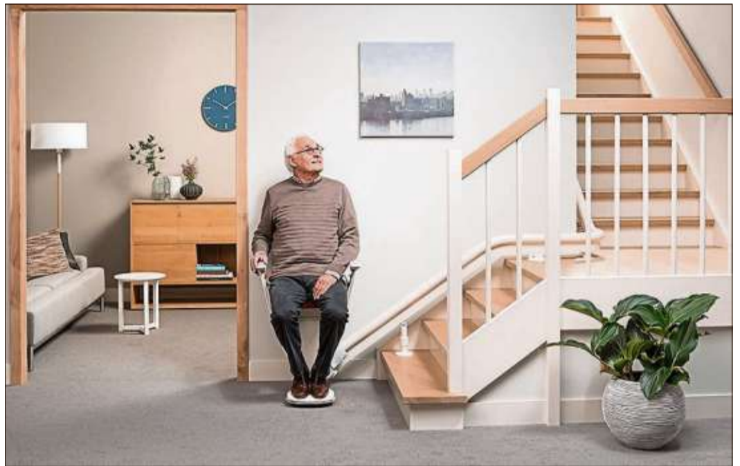
Mit einem Treppenlift von Lifta lassen sich die heimischen Treppen auch mit zunehmendem Alter oder bei körperlicher Beeinträchtigung mühelos überwinden.

20 Prozent Aktionsrabatt Auf die komplette Lagerkollektion bietet das Team vom Vital-Zentrum Ruppert am Tag der offenen Tür am 22. April 20 Prozent Aktionsrabatt. Von 10 bis 18 Uhr ist Zeit zum Stöbern und Ausprobieren.