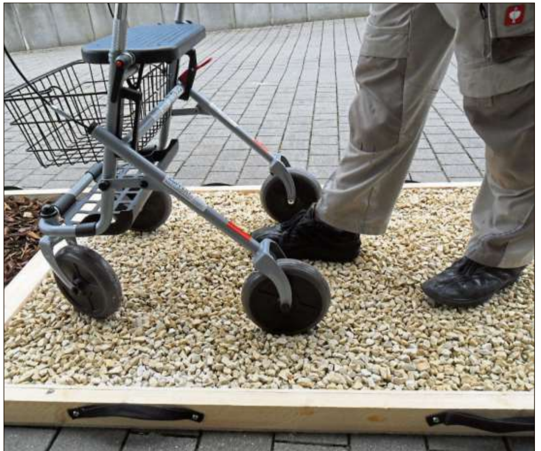
Auf dem Rollator-Parcours können Interessierte verschiedene Untergründe testen.