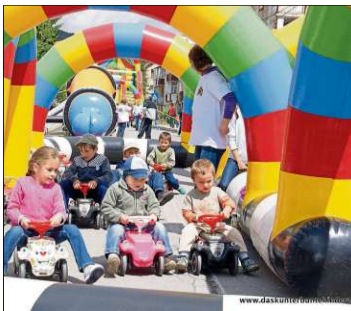
Auf der Bobby-Car-Bahn können die Kinder ihre Geschicklichkeit testen.