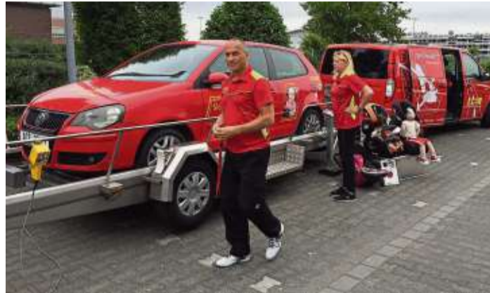
Der Crash-Simulator simuliert einen Aufprall und die Kräfte, die selbst bei geringen Geschwindigkeiten auf den Körper einwirken.

www.takeoff-reisen.de/kerstin-schlingloff