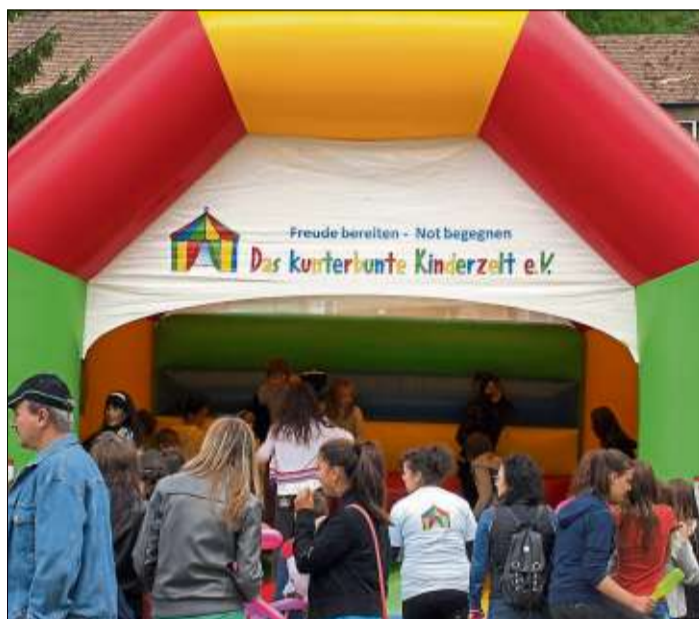
Die Hüpfburg des Kunterbunten Kinderzeltes ist immer ein sehr beliebter Anlaufpunkt.

präsentieren neueste Trends auf der Bühne. Natürlich bieten auch das Vital-Zentrum Ruppert und Baby-Express Hüniche für die Besucher und Interessierten viele Top-Angebote und Aktionsrabatte an diesem Tag.