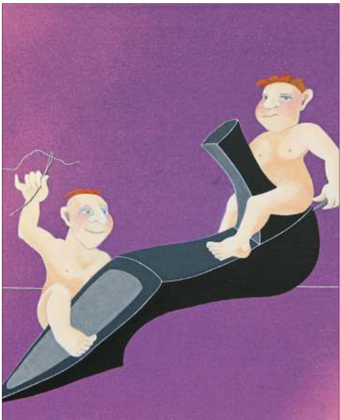
Die Heinzelmännchen zu Köln – ein Werk der Künstlerin Dorle Obländer.

Museum Brüder Grimm-Haus Brüder-Grimm-Straße 80 Steinau an der Straße Telefon (06663) 76 05 E-Mail: info@museum-steinau.de www.brueder-grimm-haus.de