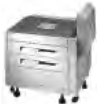
HP 2 x 500-Blatt- Papierzuführung C4780A