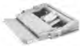
HP Duplex-Einheit C4782A