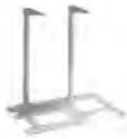
HP Kopiermodulhalterung C4231A