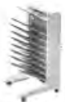
HP Multifunktionsausgabefach mit 8 Ausgabefächern C4785A