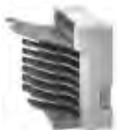
HP Tischausgabefach mit 7 Ausgabefächern C4783A