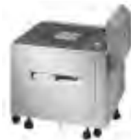
HP 2000-Blatt-Papierzuführung C4781A