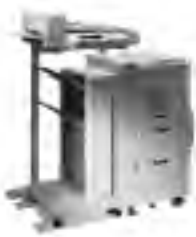
HP LaserJet 8150MFP *