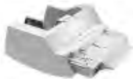
HP Briefumschlagzuführung C3765B