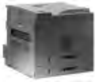
HP LaserJet 8150/N/DN