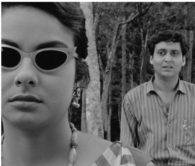
Le lâche, Satyajit Ray, 1965

Distinctes par leur définition, mémoire, souvenir et oubli, sont cependant des notions corrélées et poreuses. Leur enchevêtrement dessinent des lignes aux croisements sensibles, oscillant du particulier au général, leurs tracés glissent de l'expérience intime et subjective au plan collectif, de ce que nous pensons nous devoir à nous-même à ce qu'il nous faut transmettre aux autres. Ainsi, si l'on parle fréquemment de devoir de mémoire, rappelons que nulle mémoire n'existe qui ne