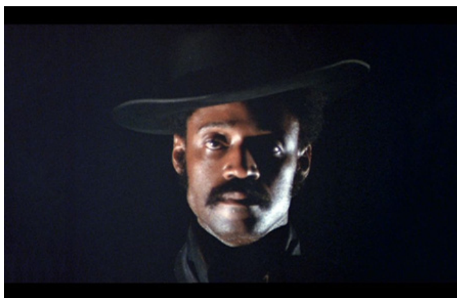
Sweet Sweetback's Baadasssss Song, Melvin Van Peebles, 1971