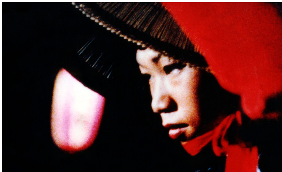
Sans soleil, Chris Marker, 1983