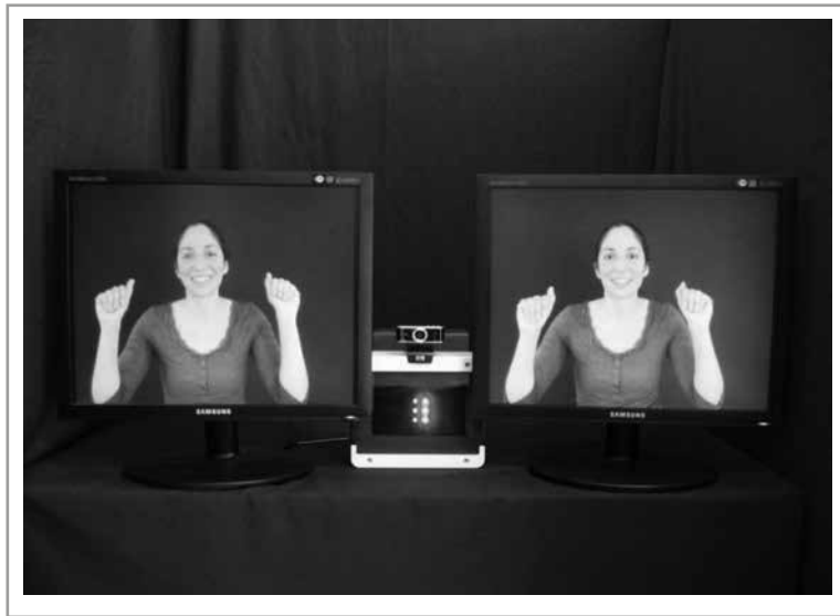
Figura 1. Fotografía tomada en nuestro laboratorio. Entre ambos monitores se observa el dispositivo LED utilizado para atraer la atención del bebé al inicio de cada ensayo. Por sobre él se encuentra la cámara utilizada para videofilmar el rostro del bebé. Dicha filmación se utiliza para, luego, calcular el tiempo de fijación visual a cada monitor. Por detrás, y entre ambos monitores, se ubica el altavoz a través del cual se presenta el estímulo sonoro durante los ensayos.

misma consiste en la presentación simultánea de dos estímulos, generalmente, visuales a través de dos monitores ubicados lado a lado. Entre ellos se ubica un altavoz que emite el sonido congruente con el estímulo visual que se exhibe en uno de los monitores. Los bebés participan en una serie de ensayos en los cuales se intercambian las imágenes y los sonidos que se le presentan (ver figura 1). Para cada bebé se calcula la proporción de tiempo total de mirada (PTTM) la cual resulta de dividir el tiempo de fijación visual sobre el estímulo visual congruente con el sonoro por la sumatoria del tiempo de fijación visual a ambos estímulos visuales. Una diferencia estadísticamente significativa a favor de la PTTM sobre el estímulo visual congruente se toma como indicador del reconocimiento de la relación intersensorial estudiada.