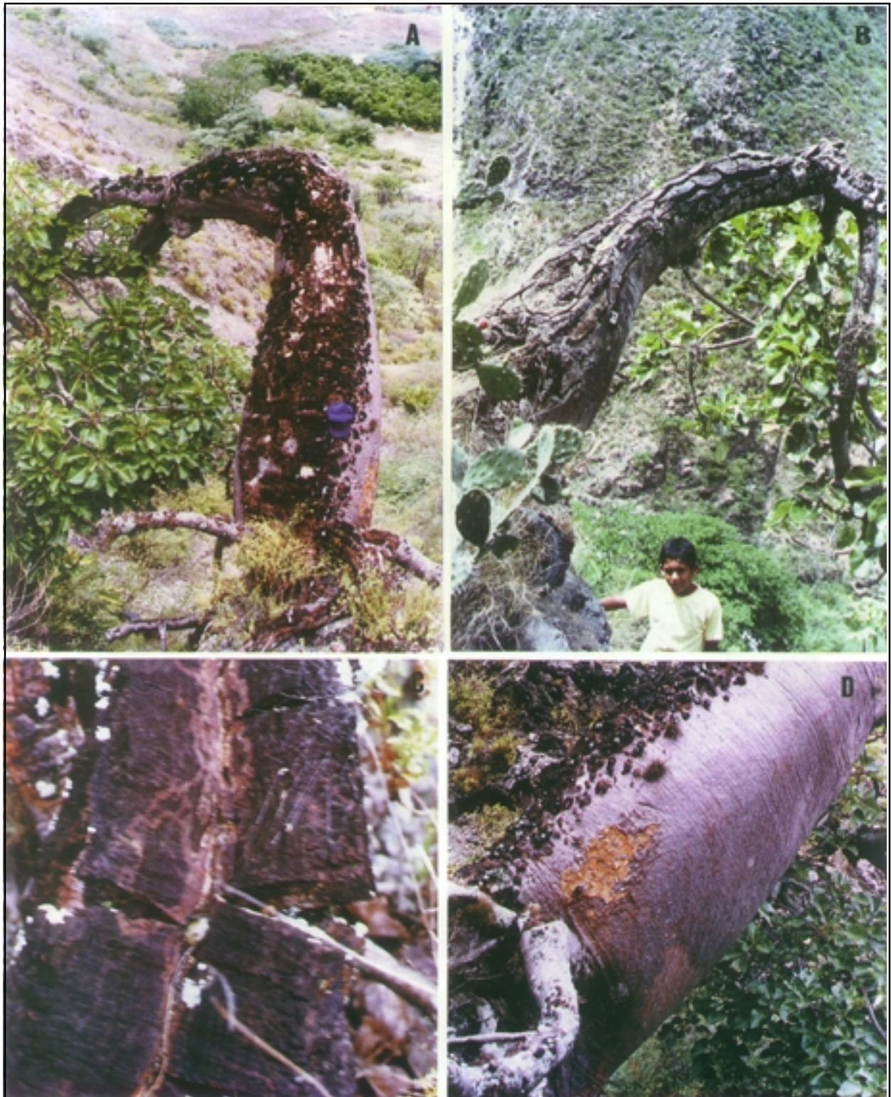
Figura 1. Cavanillesia chicamochae Fern. Alonso. A-B. Porte del árbol, especímenes fotografiados en la localidad típica, Pescadero, Santander. C- Aspecto de una banda de corteza desprendida del tronco. D- Base de un tronco mostrando el anclaje con zancos a la pendiente..