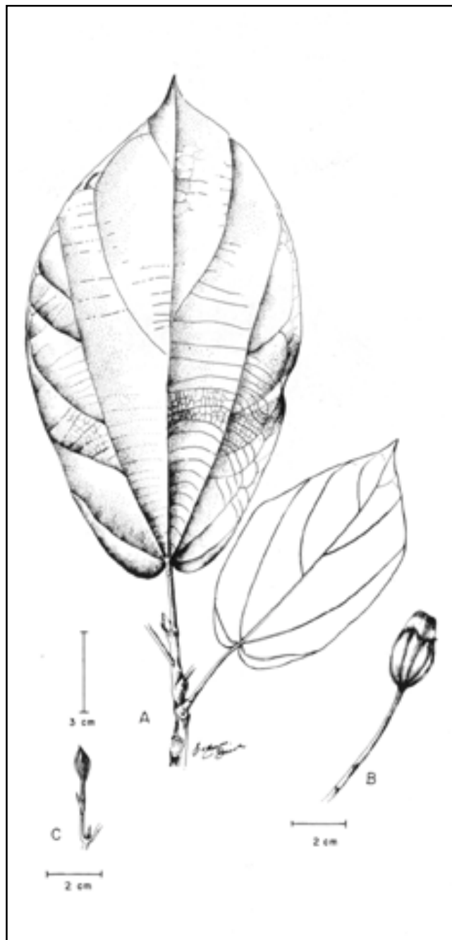
Figura 4. Matisia anchicayana Fern. Alonso. A.- Ápice de rama. B.- Fruto maduro acompañado del pedúnculo y el cáliz acrescente. C.- Detalle del pedicelo floral con bractéolas y de un botón floral. (Dibujado a partir de la serie típica Fernández-Alonso & al. 8027 )

con nudos muy marcados y de aspecto articulado; yemas, ápices de las ramas y peciolo con indumento oscuro y áspero al tacto, de pelos fasciculado-estrellados, de radios cortos; estípulas anchamente triangulares de c. 3-4 mm de longitud, prontamente caducas. Hojas dis-