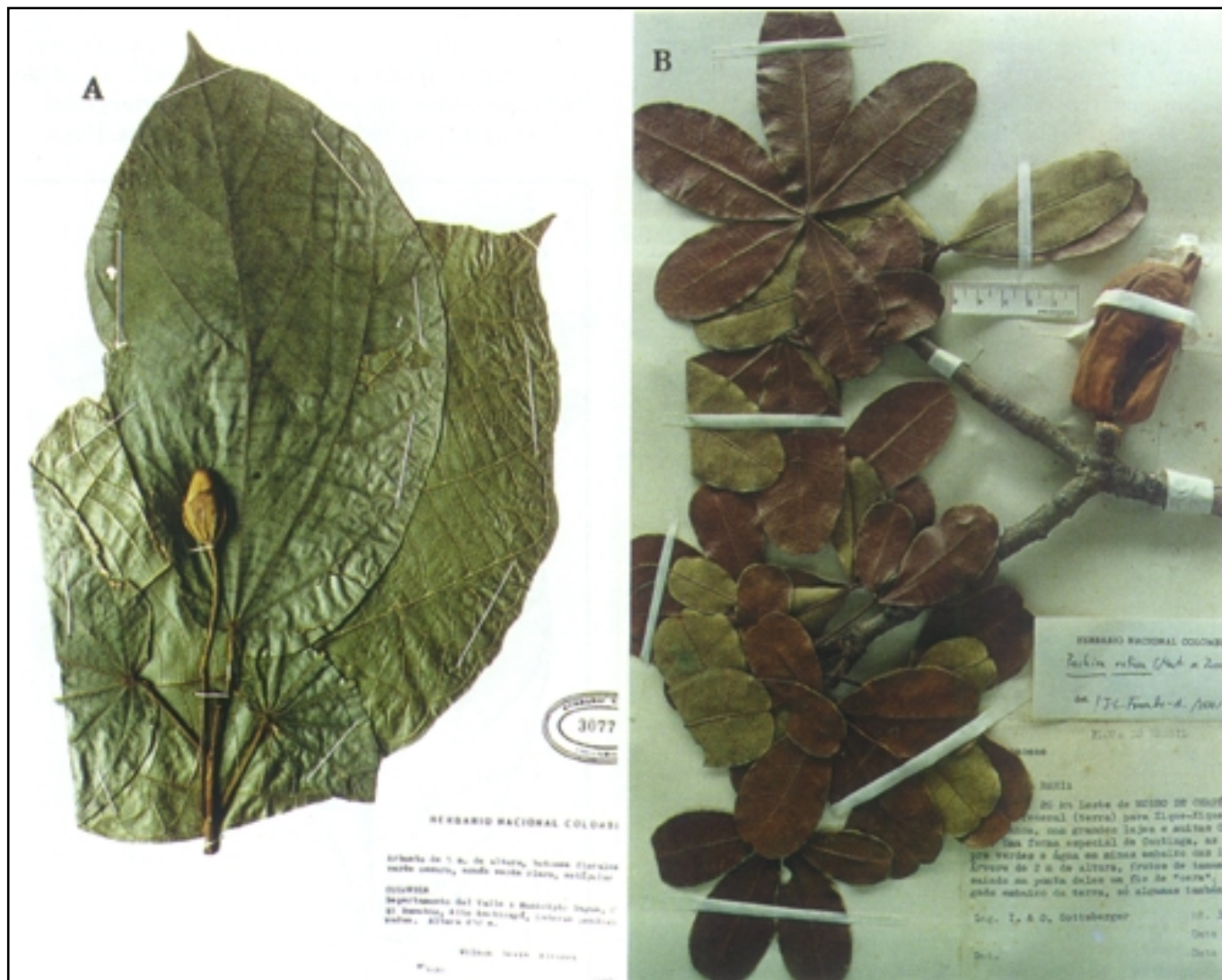
Figura 5. A. Matisia anchicayana Fern. Alonso. A.- Detalle de una rama con fruto, de la serie típica. B.- Pachira retusa (Mart. & Zucc.) Fern. Alonso. Detalle de una rama con fruto, fotografiado de I. & G. Gottsberg 311-3273 (ULM).

puestas en un solo plano en las ramas (Figs. 4A, 5), con peciolo de (2)3 cm de longitud, con pulvínulo proximal de c. 0,8 cm de diámetro; láminas membranoso-cartáceas, de obovadas a trapezoides, ligeramente asimétricas, de 12-40 cm x 8-19 cm (en plantas jóvenes de hasta 50 cm de longitud), subagudas en el ápice y cordadas en la base, seno basal de c. 1 cm (ocasionalmente hasta 4 cm en plantas jóvenes), con (5)7-8(10) nervios basales, dos de ellos poco conspicuos; haz y envés con pelos estrellado-lepidotos diminutos, dispersos. Flores generalmente dispuestas en ramas cortas, solitarias, opuestas a las hojas, patentes o péndulas en la rama; bractéolas 3, hacia la mitad del pedicelo floral,