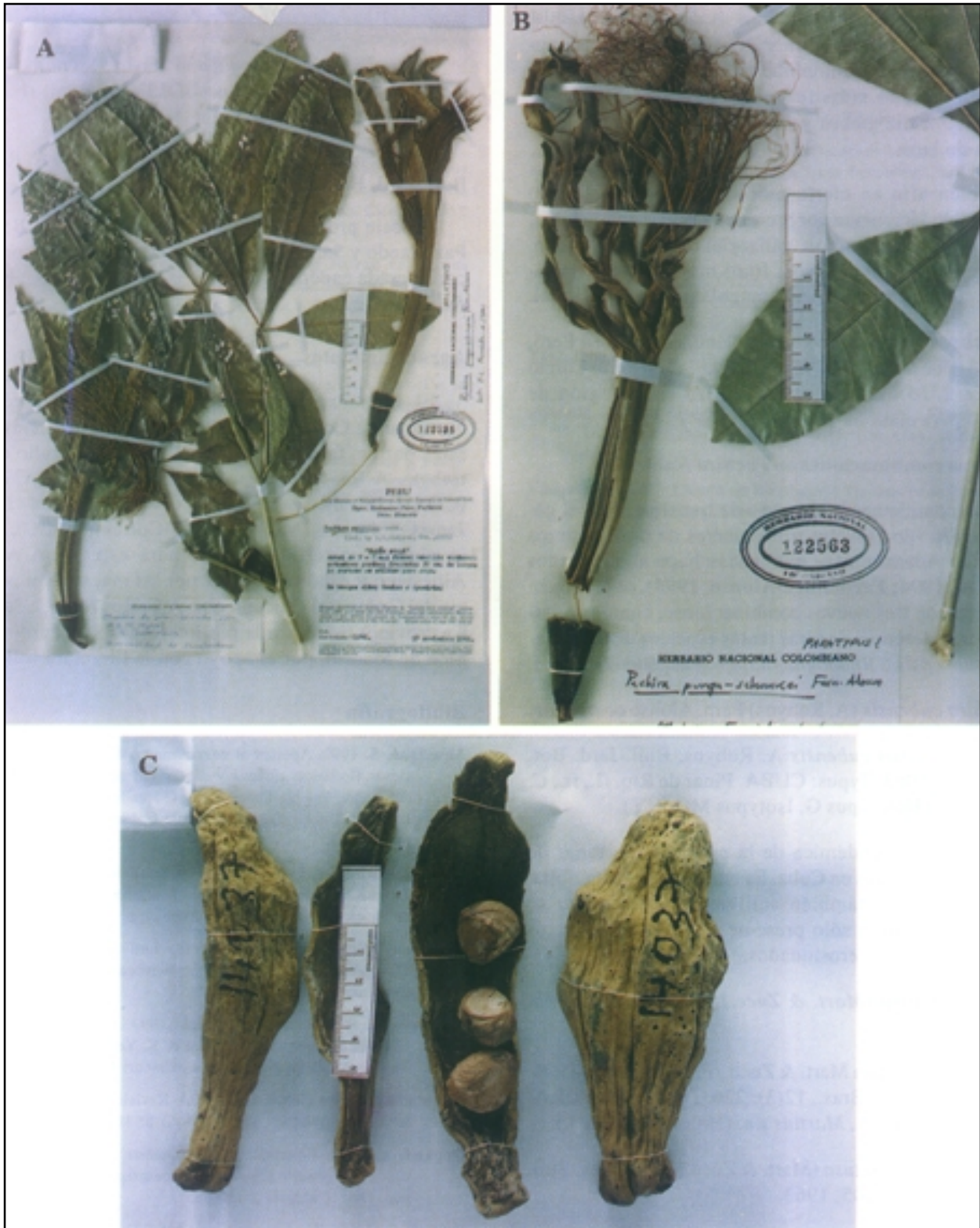
Figura 6. Pachira punga-schunkei Fern. Alonso. A.- Fotografía del holotipo, Schunke- 1246 (COL); B.- Detalle de una flor, de -Schunke 2716-; C.- Detalle de las valvas del fruto y las semillas de J. Pipoly 14037, (COL).