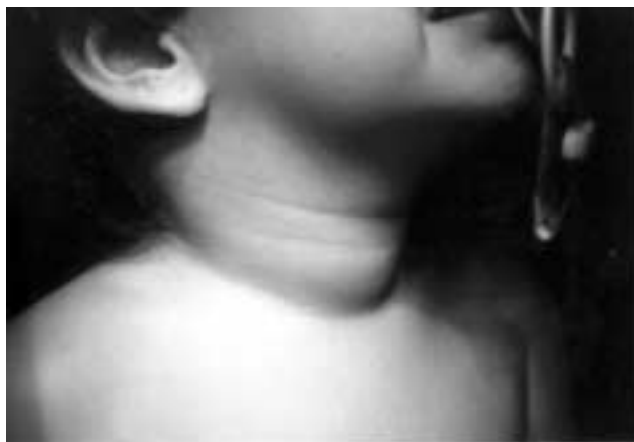
Figura 1. Tumefacción cervical con rigidez de cuello.