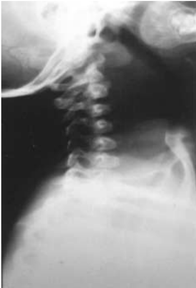
Figura 2a. Rx lateral de cuello: Ensanchamiento del espacio retrofaríngeo.

rexia y vómitos. A la exploración presenta mal estado general, faringe hiperémica con abombamiento de su pared posterior hacia adelante. Tumefacción cervical y submandibular izquierda. La radiografía lateral de cuello muestra ensanchamiento del espacio retrofaríngeo con rectificación de la columna cervical.