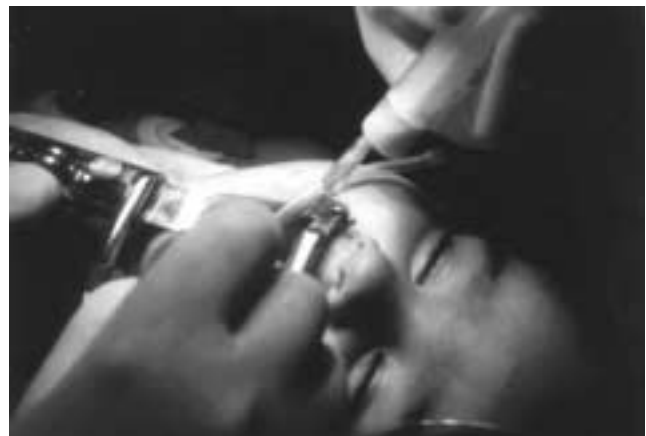
Figura 3. Drenaje del absceso por vía transoral.

tir dificultad respiratoria y disfagia. A la exploración se observa el abombamiento hacia adelante de la pared faríngea posterior (4-6) .